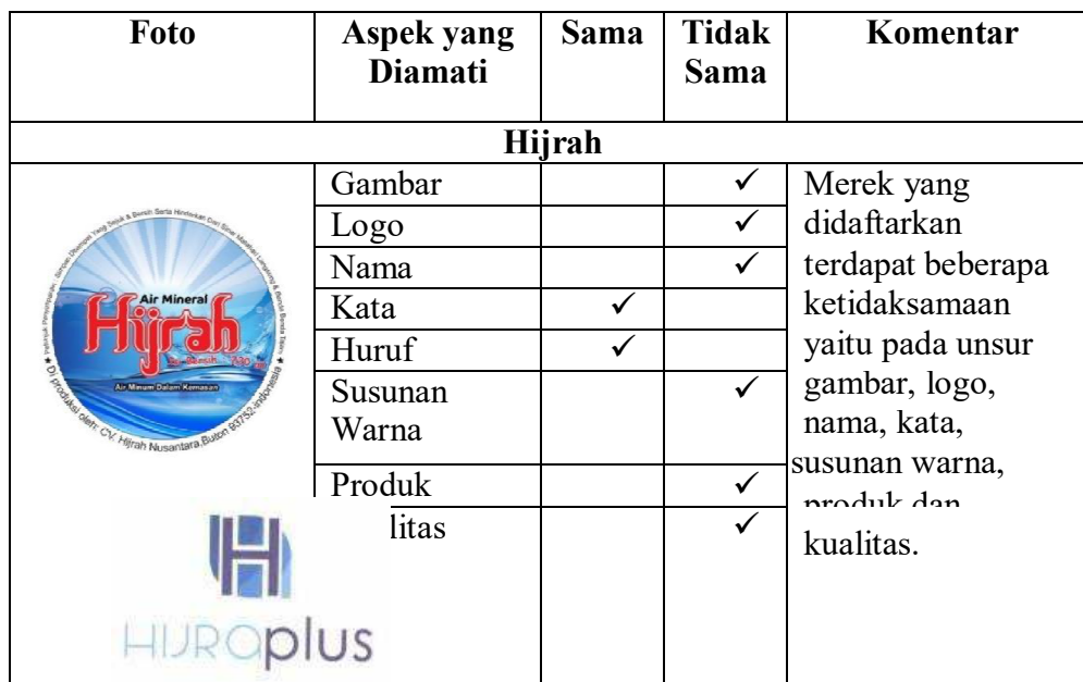
Tabel 2 Lembar Checklist Pengamatan Merek Hijrah

Merek logo Hijraplus terdaftar secara resmi pada tanggal 22-12-2020.