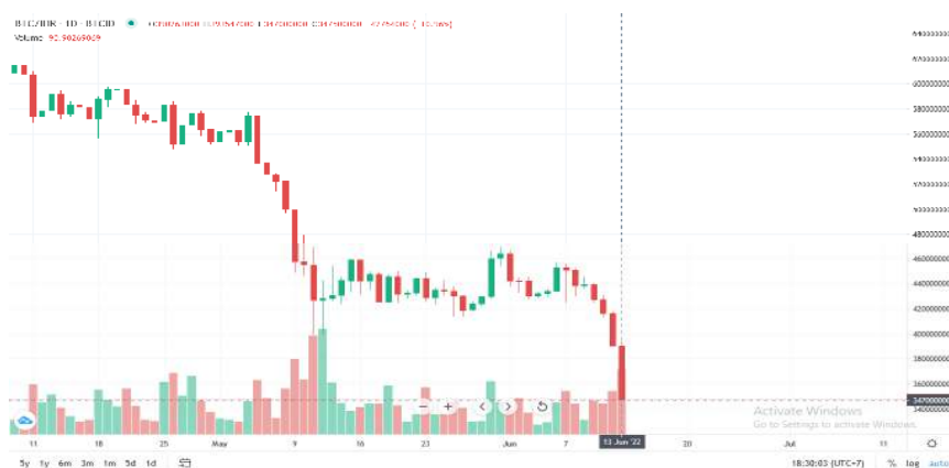
Gambar 4.3 Pergerakan market BTC/IDR timeframe hari pada Indodax