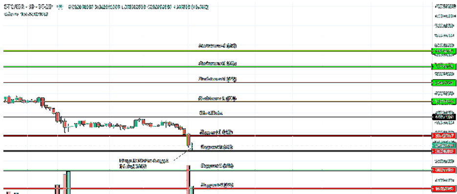
Gambar 4.4 Indikator Pivot Point Standard pada market BTC/IDR per-hari pada Indodax

Berdasarkan gambar diatas dapat dipahami sebagai berikut: