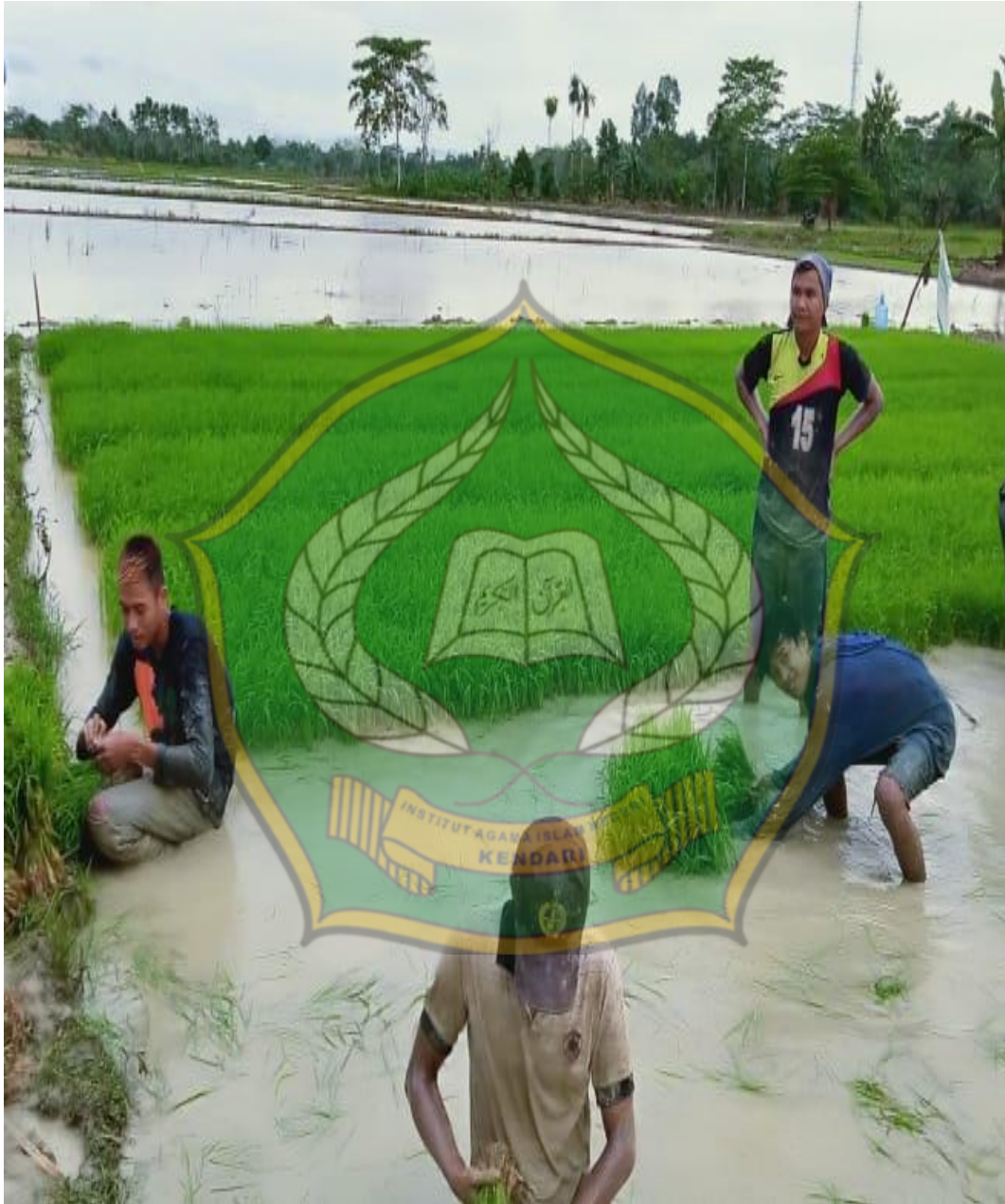
Peruses penanaman padi