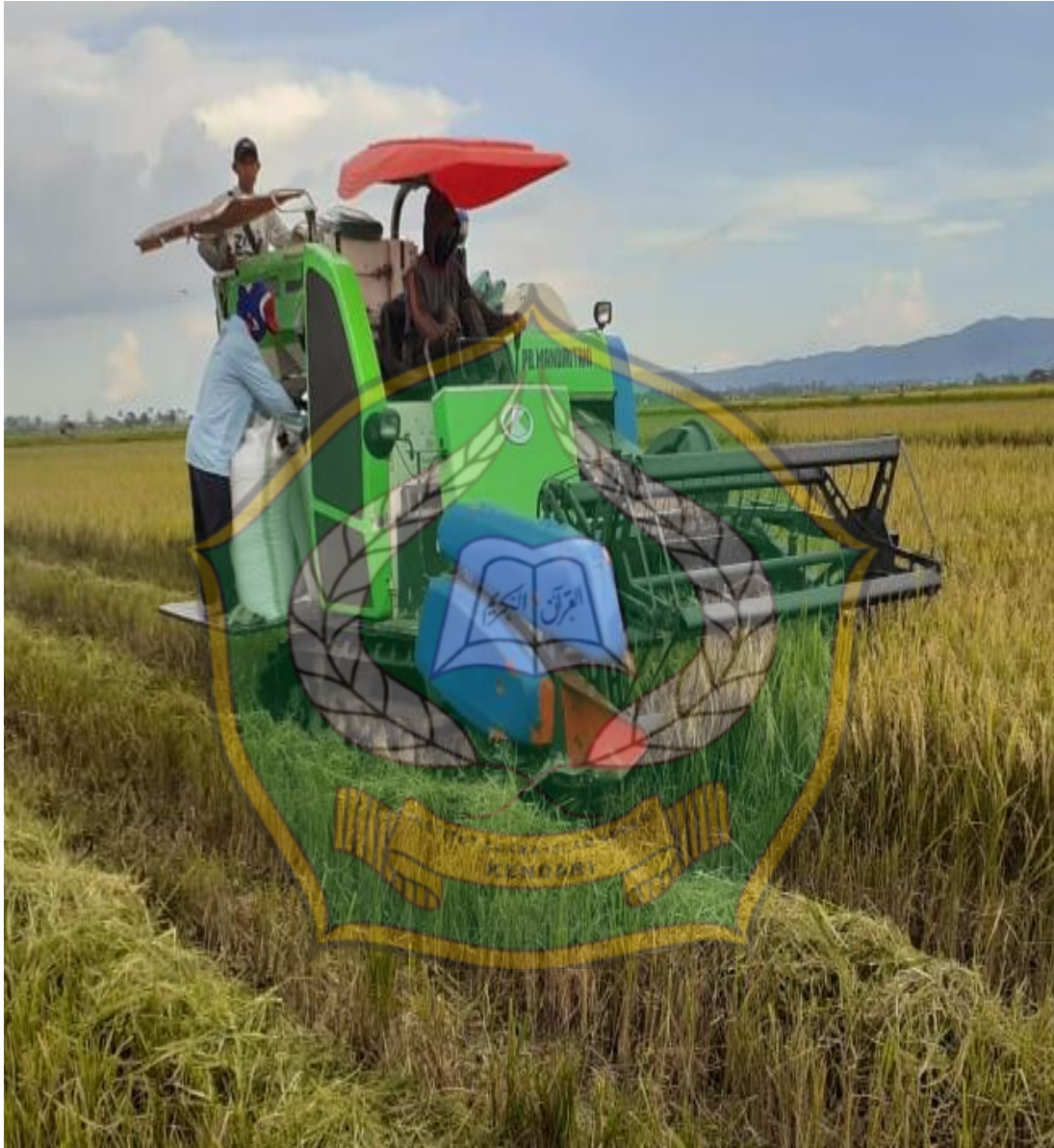
Peruses pemanenan padi