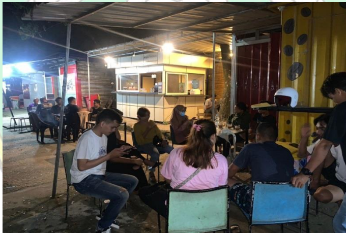
Dokumentasi Kedai Kopi Trotoar 15 Maret 2023