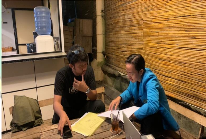
Dokumentasi Karyawan Kedai Kopi Trotoar (23 Februari 2023)