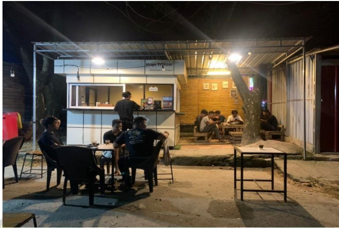
Dokumentasi Kedai Kopi Trotoar 15 Maret 2023