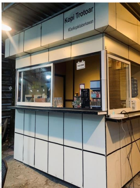
Dokumentasi Kondisi Kedai Kopi Trotoar Tahun 2018-2022