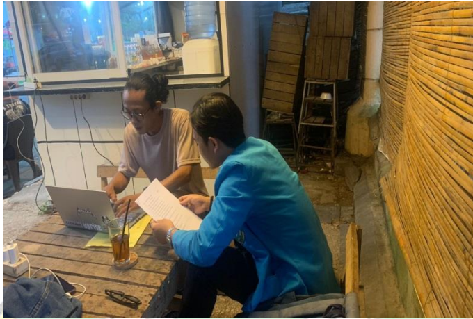
Dokumentasi Pemilik Usaha Kedai Kopi Trotoar (23 Februari 2023)