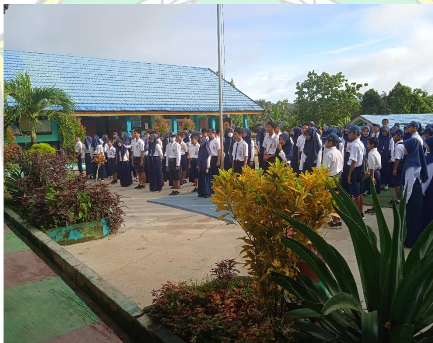
Pengarahan oleh guru pada saat apel pagi