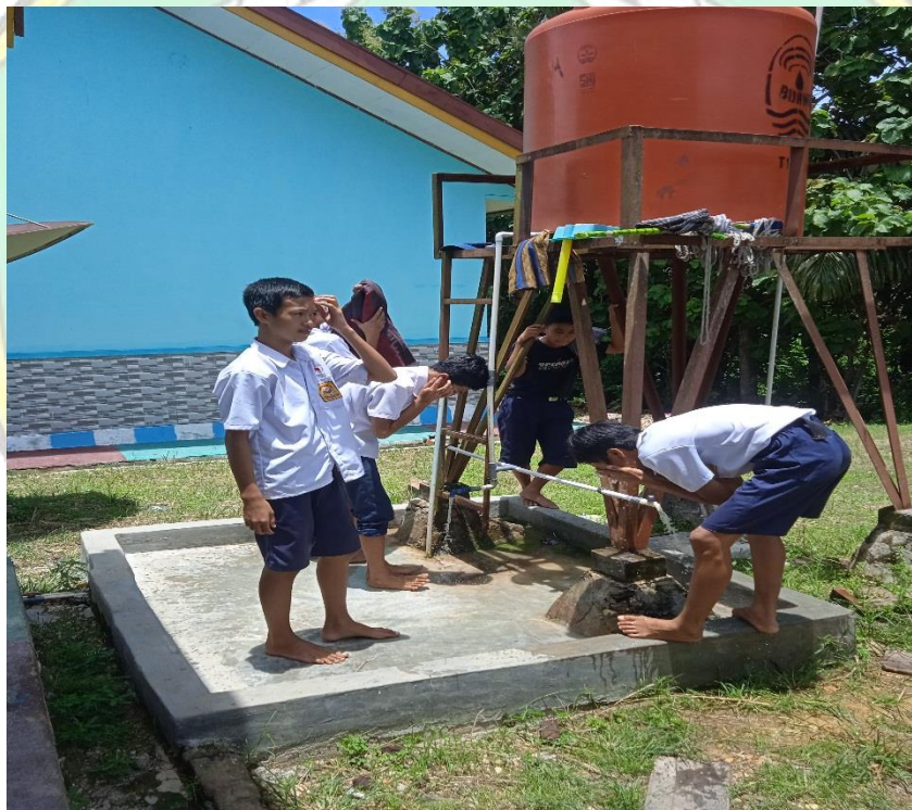
Gambar Mushalah Sekolah