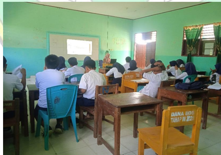
Observasi pada saat proses pembelajaran