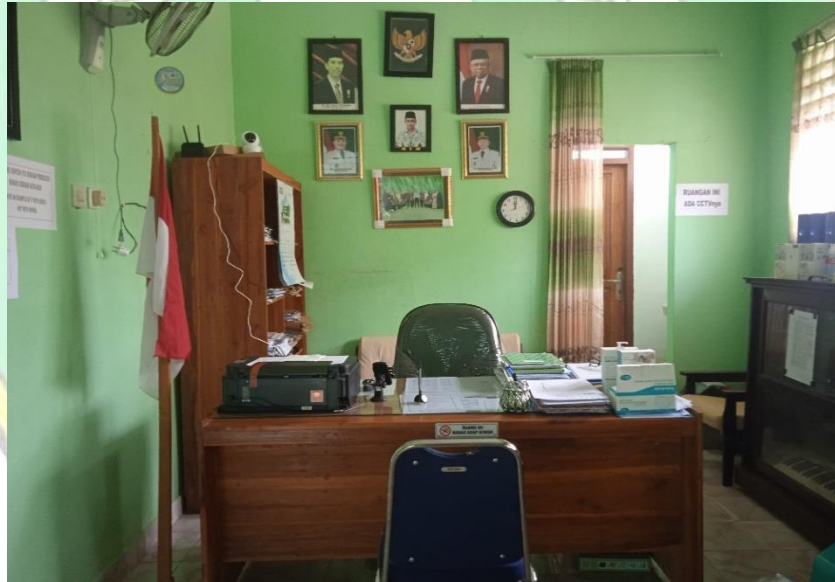
Wawancara bersama Kepala SMPN 3 Abuki