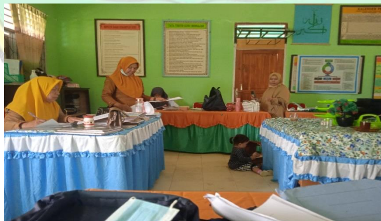
Wawancara bersama guru PAI SMPN 3 Abuki