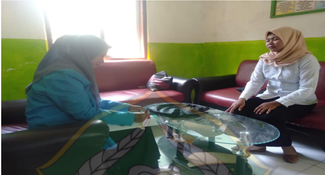
FOTO DOKUMENTASI PADA SAAT WAWANCARA BERSAMA MASYARAKAT DESA JAWI-JAWI