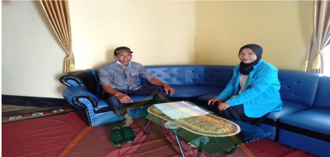
FOTO DOKUMENTASI PADA SAAT WAWANCARA BERSAMA APARAT DESA JAWI-JAWI