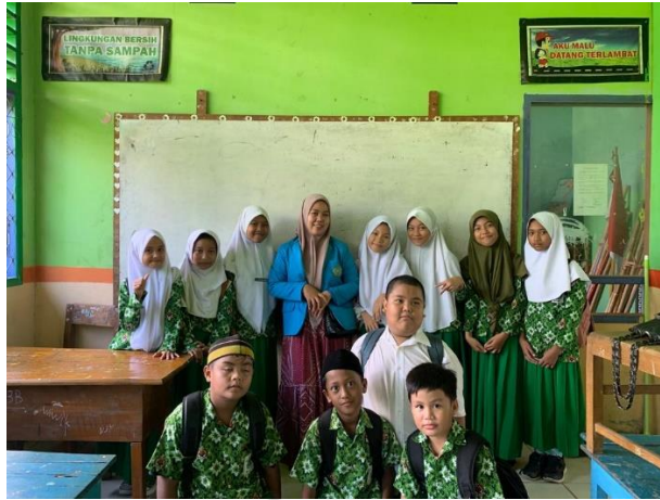
Foto bersama siswa kelas V