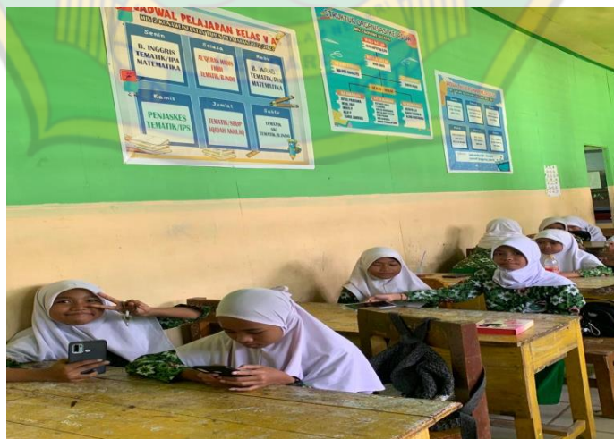
Siswa Menggunakan Gadget di Kelas