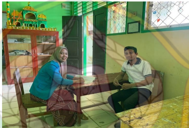
Foto bersama guru Kelas V