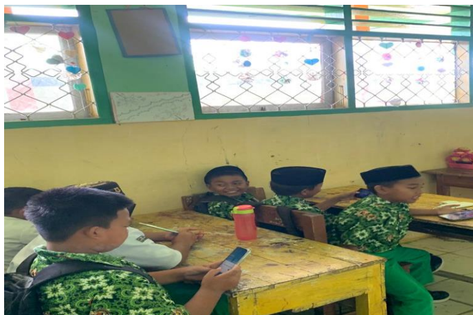
Siswa Menggunakan Gadget di Kelas