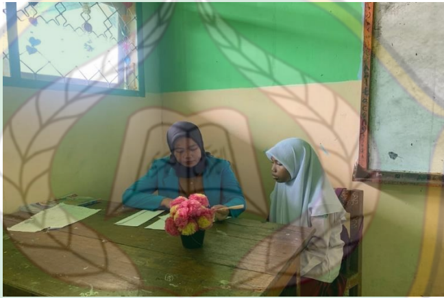
Wawancara Siswa Kela V