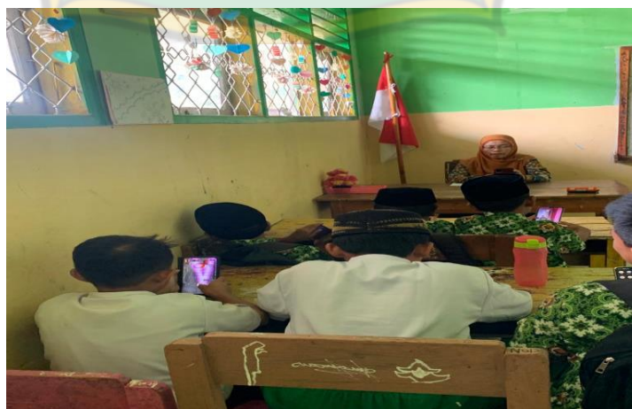
Siswa Menggunakan Gadget di Kelas