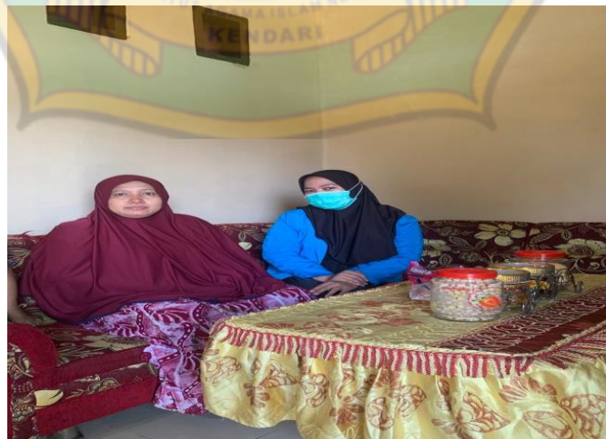
Wawancara Orang Tua Siswa