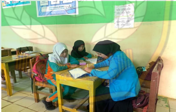
Wawancara Siswa Kela V