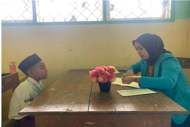
Wawancara Siswa Kela V