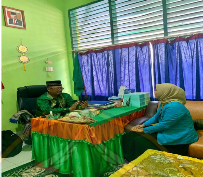
Pengantaran surat izin penelitian