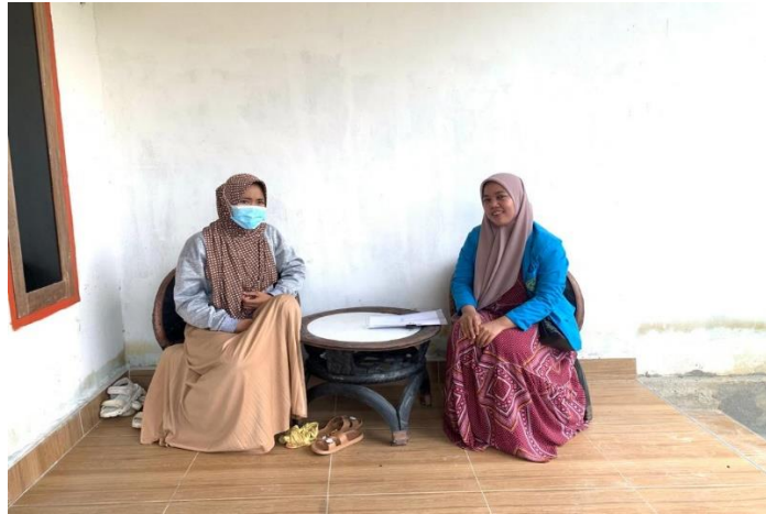
Wawancara Orang Tua Siswa