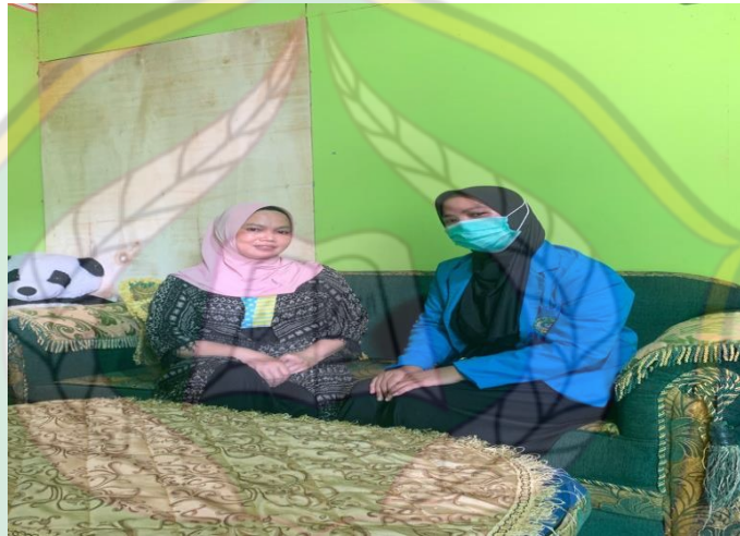
Wawancara Orang Tua Siswa