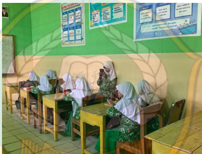
Siswa Menggunakan Gadget di Kelas