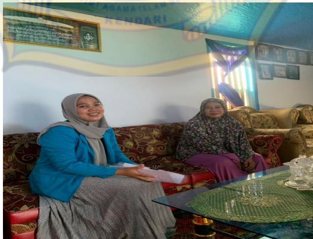
Wawancara Orang Tua Siswa