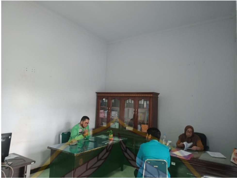
Gambar 9 dengan kepala bagian kebijakan Perlindungan Anak serta Kepala Bidang Perlindungan Anak.