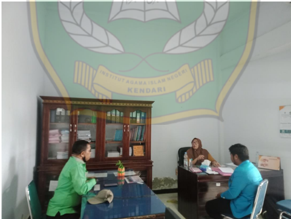
Gambar 6 dengan kepala bagian kebijakan Perlindungan Anak serta Kepala Bidang Perlindungan Anak