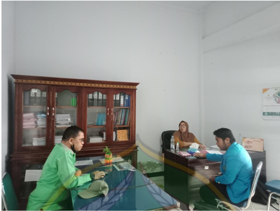
Gambar 5 dengan kepala bagian kebijakan Perlindungan Anak serta Kepala Bidang Perlindungan Anak