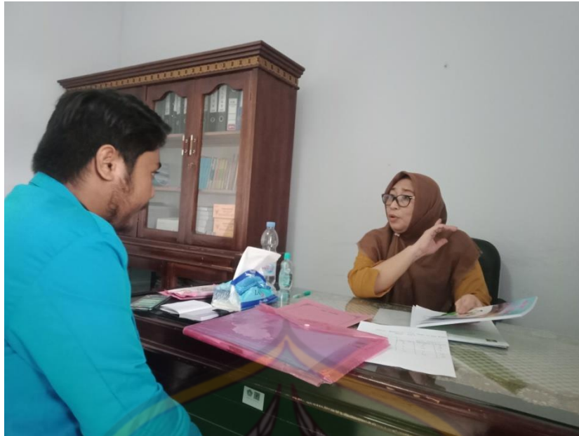
Gambar 3 Dengan Kepala Bidang Perlindungan Anak