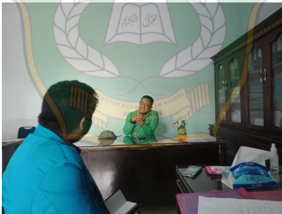
Gambar 4 dengan kepala bagian kebijakan Perlindungan Anak.