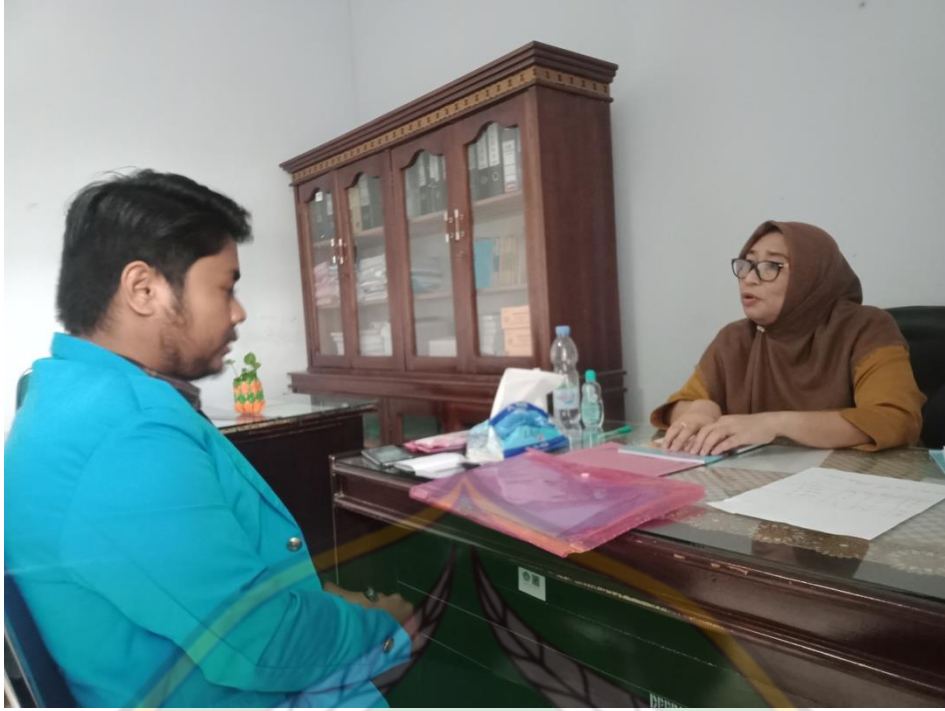
Gambar 7 Dengan Kepala Bidang Perlindungan Anak.