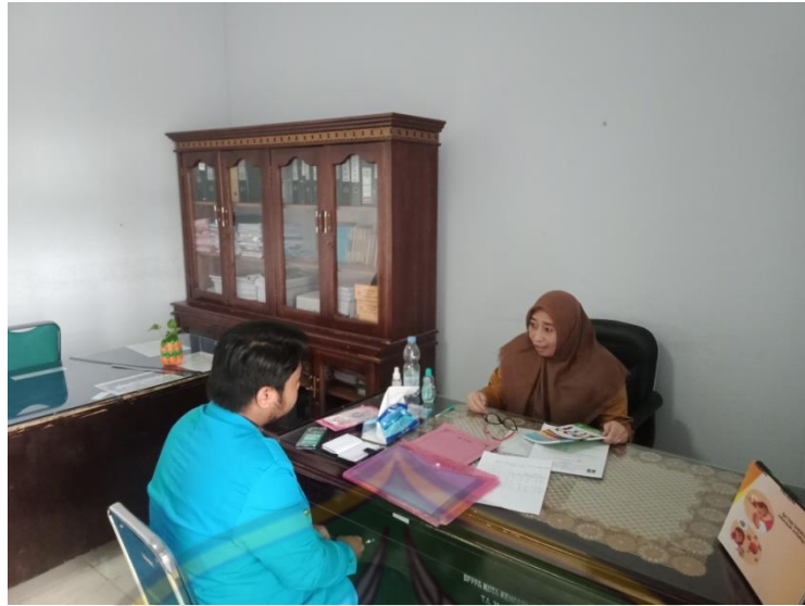
Gambar 1. Dengan Kepala Bidang Perlindungan Anak