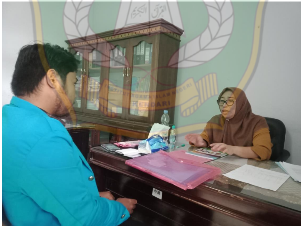
Gambar 8 Dengan Kepala Bidang Perlindungan Anak.