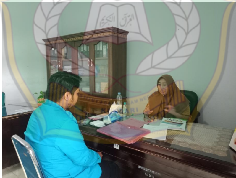
Gambar 2. Dengan Kepala Bidang Perlindungan Anak