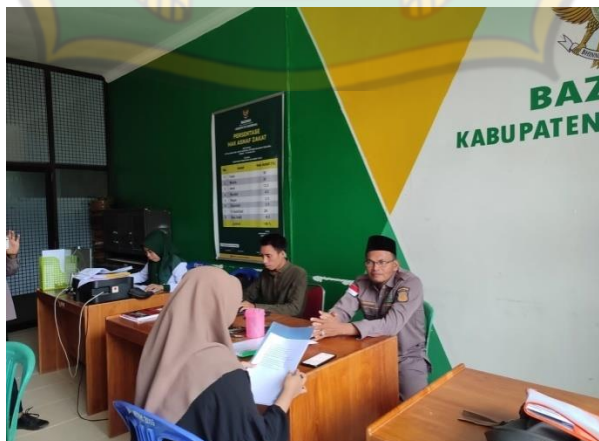
Wawancara dengan Ketua Baznas Bombana pada hari Senin tanggal 13 Februari 2023 pukul 11.15 WIB