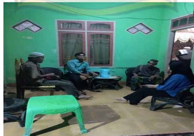
Wawancara dengan BU pada hari Rabu tanggal 15 february 2023 pukul 20.15 WIB