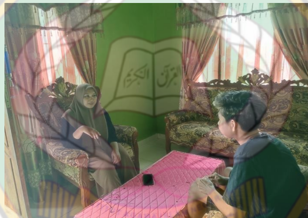
Wawancara dengan AD pada hari Senin 13 Februari 2023 pada pukul 15.20 WIB