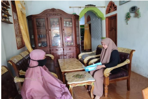
Wawancara dengan NI pada hari Kamis tanggal 16 Februari 2023 pukul 14.03 WIB