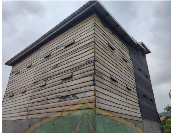
2. Rumah Walet Milik BU