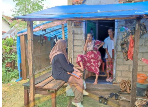
Wawancara dengan HN pada hari Senin, 13 Februari 2023 pada pukul 14.25 WIB