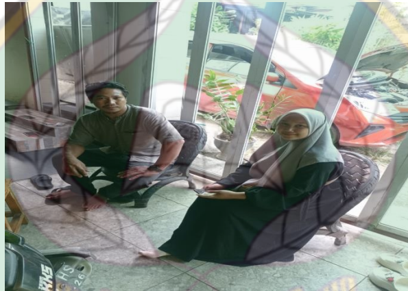
Wawancara dengan AF pada tanggal 20 Februari 2023 pukul 14.05 WIB