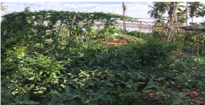
Hasil tanaman jangka pendek