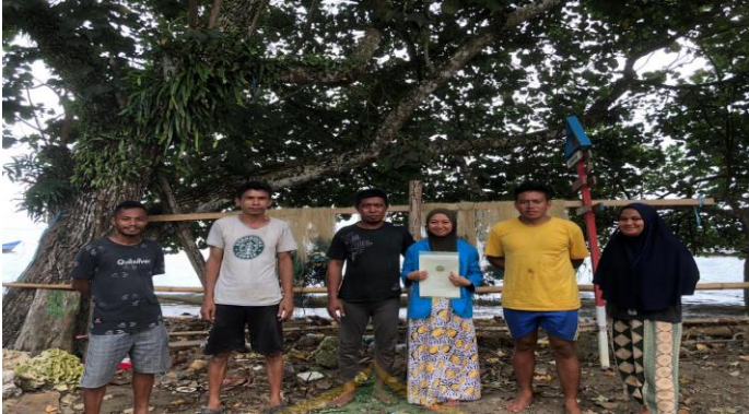
Wawancara dengan para nelayan Desa Mata Iwoi