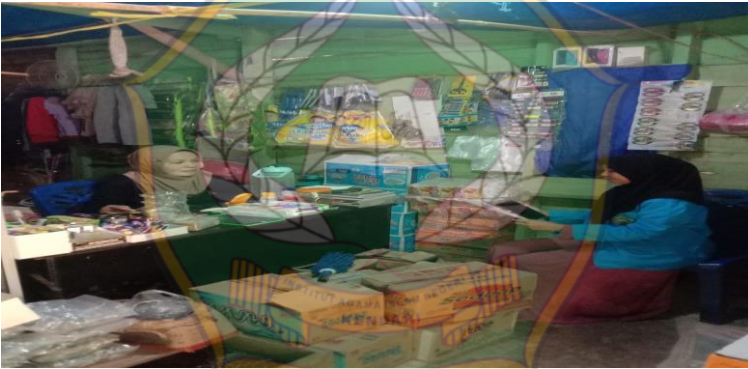
Wawancara dengan ibu asmira seorang pedagang sembako dan BBM