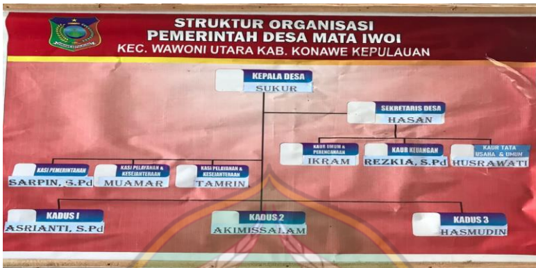
Struktur organisasi pemerintah desa mata iwoi