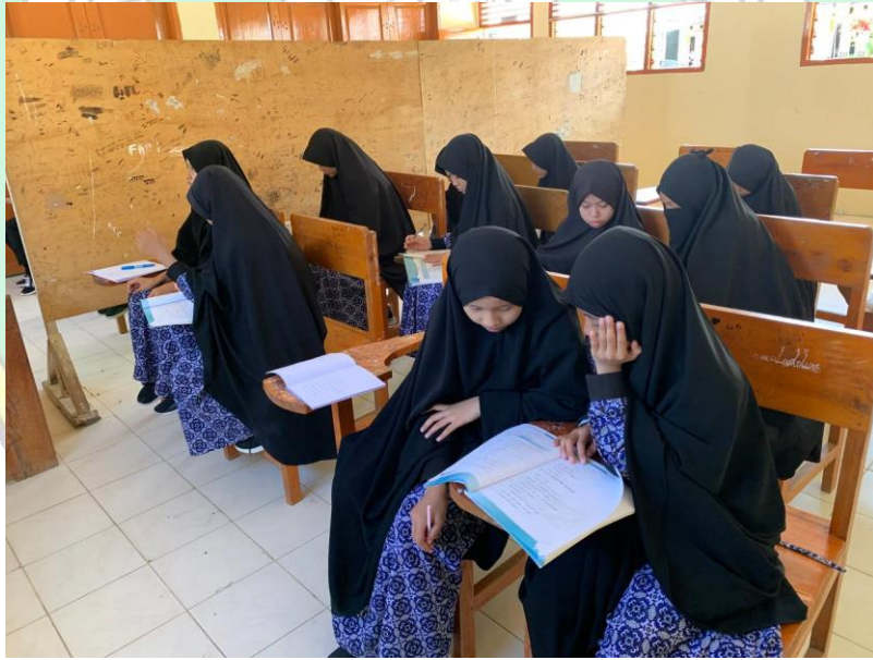
صورة لطلاب يأخذون دروس اللغة العربية