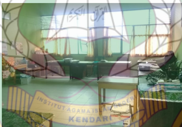
Ruang kelas MTs Al-Khairaat Konawe Selatan