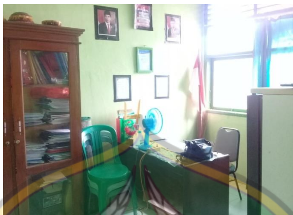
Ruang guru MTs Al-Khairaat Konawe Selatan