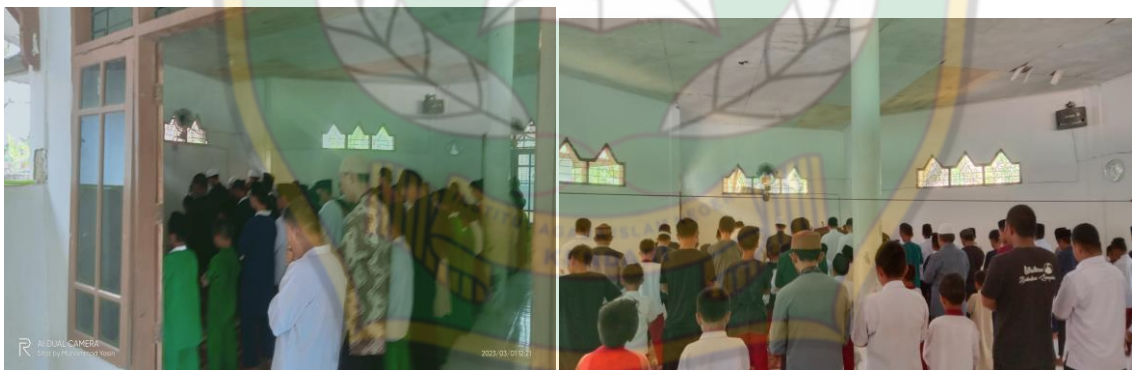
Sholat berjama'ah zuhur dan asar