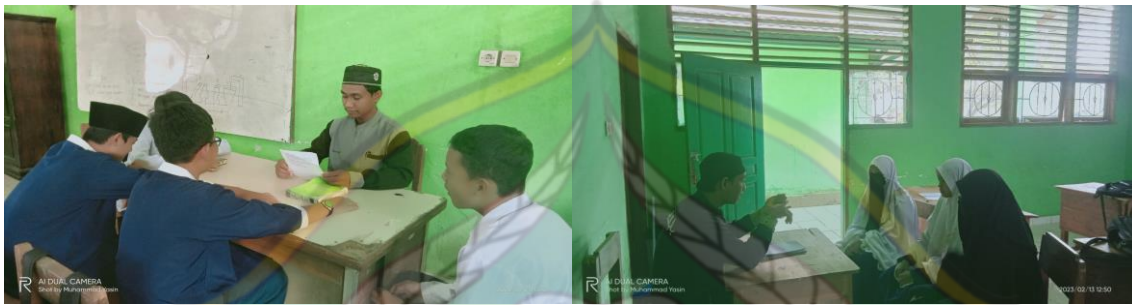
wawancara siswa/siswi MTs Al-Muhajirin Kendari