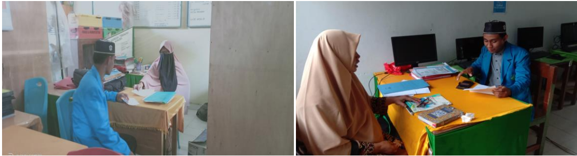
Wawancara Kepala Madrasah dan Wakasek Kurikulum