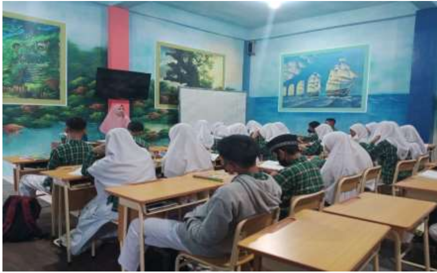
Kelas IX C yang sedang melakukan pembelajaran