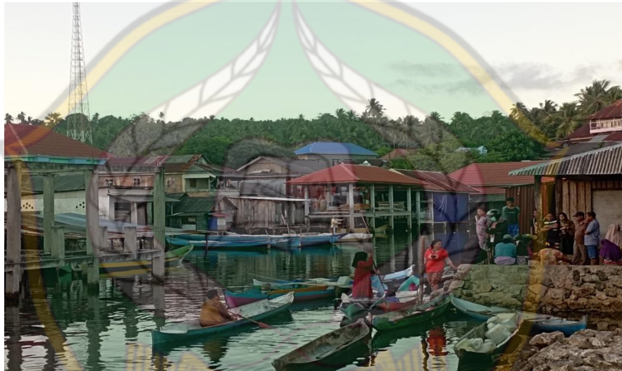
Gambar 3. Pasar Sempuawatu Tampak Luar