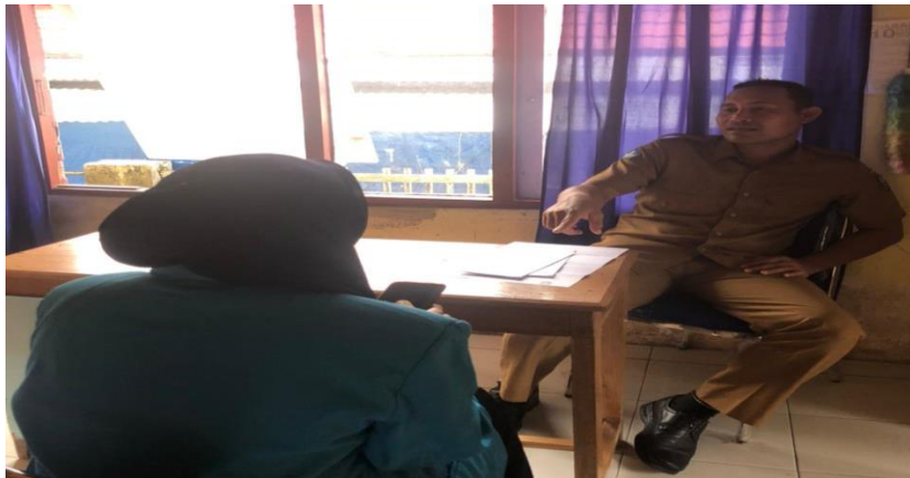
Gambar 8. wawancara pada tanggal 2 Juli 2022, bersama Kepala Lurah Lau-lua