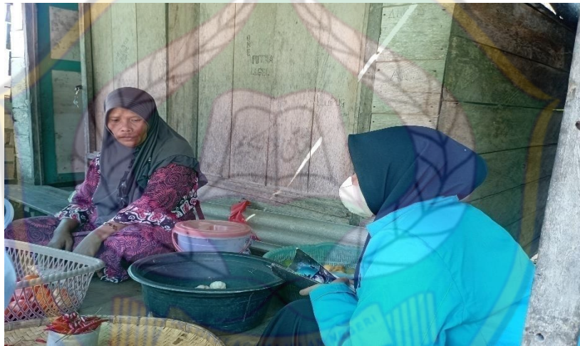
Gambar 18. Proses wawancara bersama Ibu NU pada tanggal 23 Juli 2022,