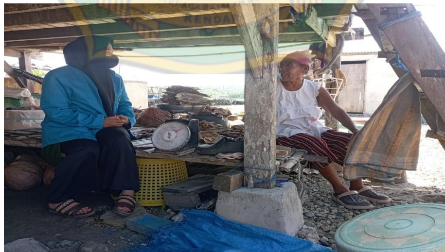
Gambar 13. Proses wawancara bersama Ibu FM pada tanggal 23 Juli 2022