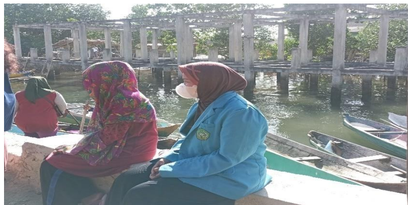
Gambar 19. Proses wawancara bersama Ibu PN pada tanggal 25 Juli 2022