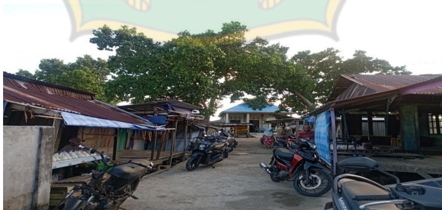
Gambar 4. Pasar Sempuawatu Tampak Depan