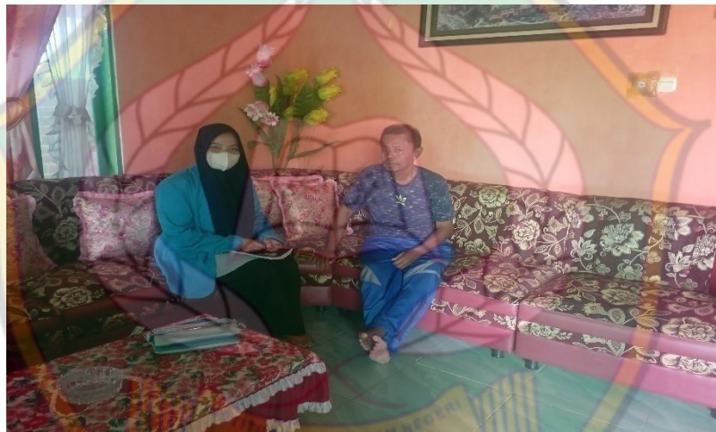
Gambar 9. Proses wawancara pada tanggal 2 Juli 2022, bersama Mantan Kepala Lurah Lau-lua