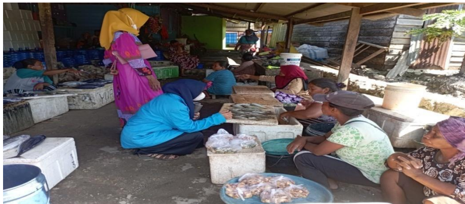
Gambar 14. Proses wawancara bersama Ibu PA pada tanggal 26 Juli 2022