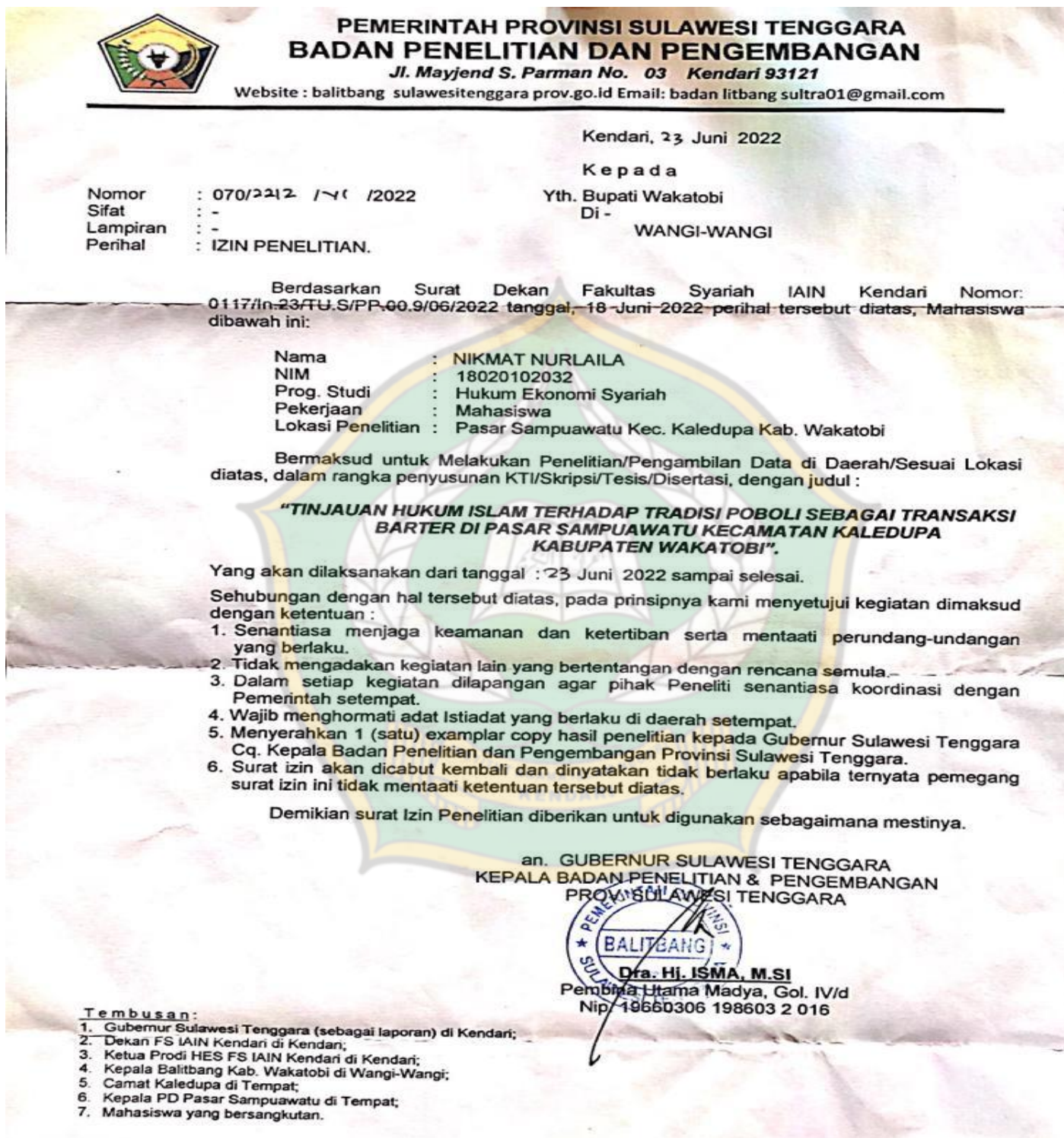
Gambar 1. Surat izin penelitian