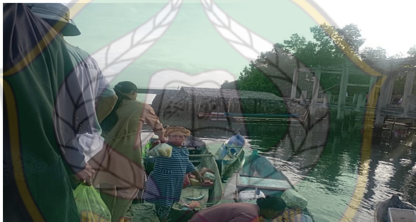
Gambar 6. Proses Transaksi Pobolosi