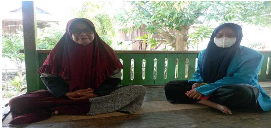
Gambar 11. Proses wawancara bersama Ibu NM pada tanggal 27 Juli 2022,