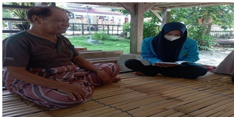
Gambar 10. Proses wawancara pada tanggal 5 Juli 2022, bersama Tokoh Adat