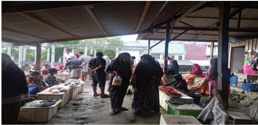
Gambar 2. Pasar Sempuawatu Tampak Dalam