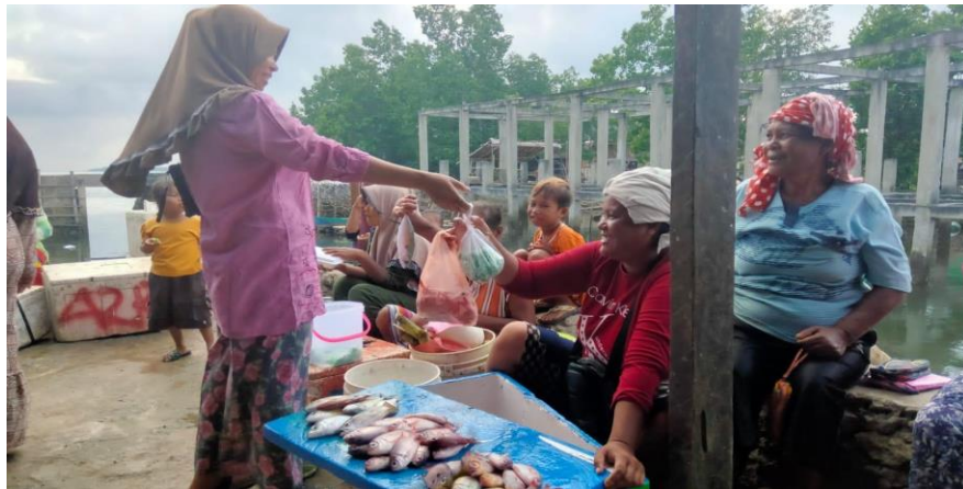
Gambar 5. Proses Transaksi Pobolosi