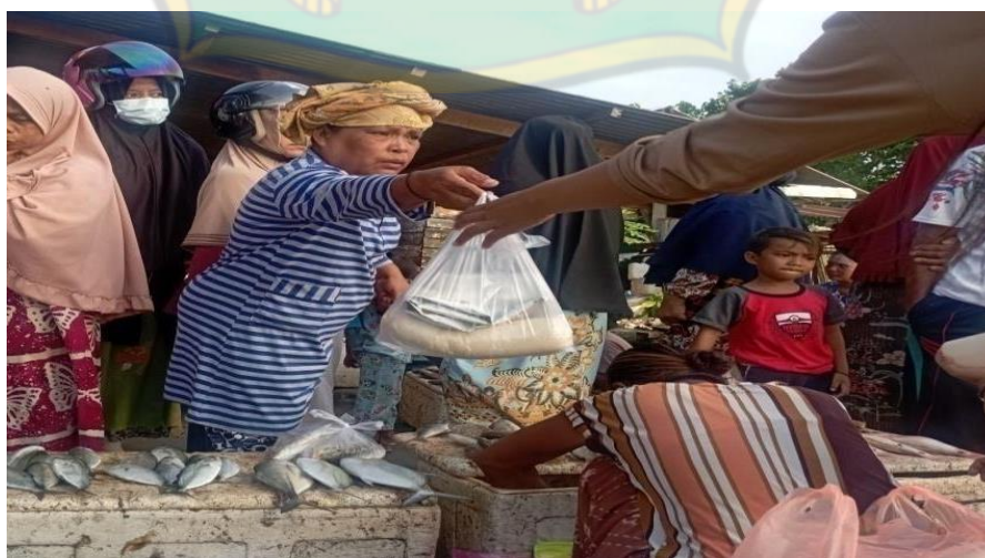
Gambar 7. Proses Transaksi Pobolosi