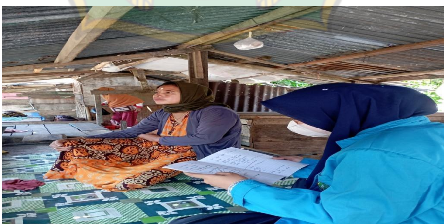
Gambar 16. Proses wawancara bersama Ibu AS pada tanggal 20 Juli 2022,