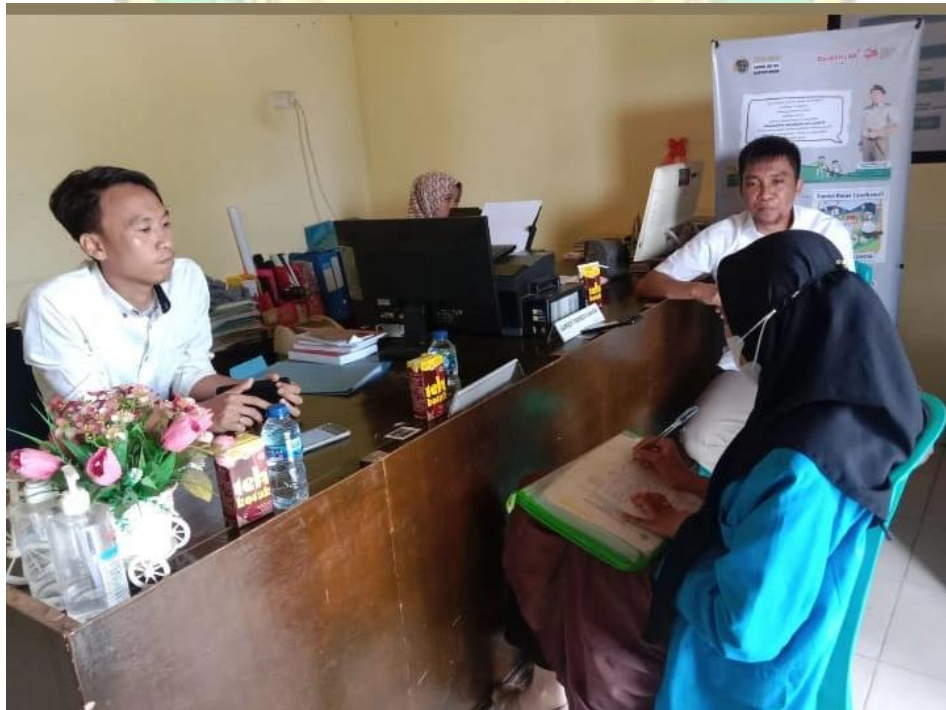
Gambar 4 . Wawancara bersama Staf/Panitia Adjudikasi