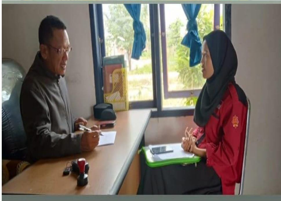
Gambar 7. Wawancara peneliti bersama Kepala Kelurahan Ladongi