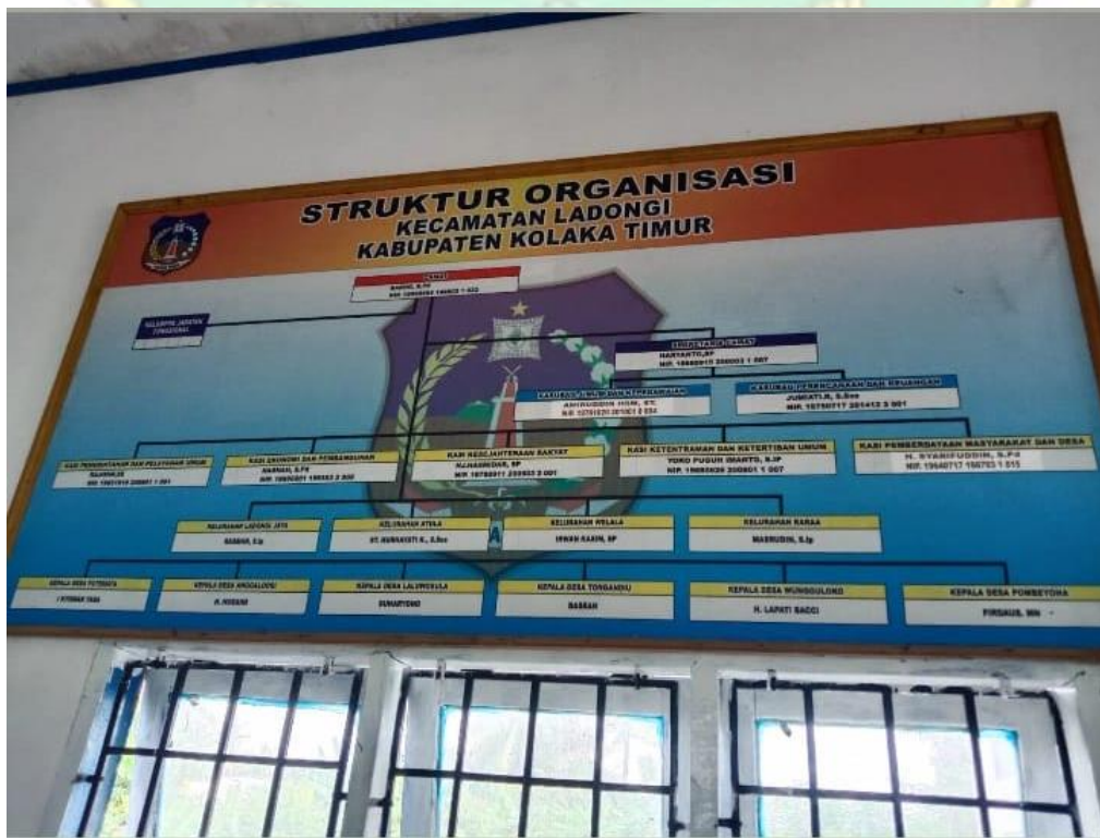
Gambar 3. Struktur Organisasi Kecamatan Ladongi