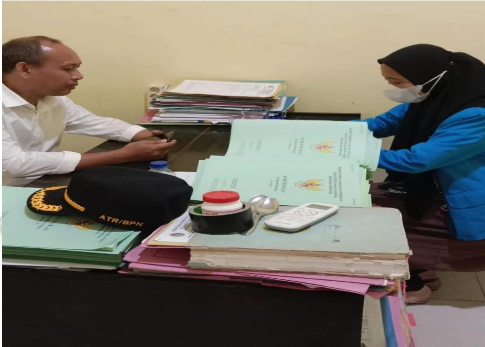
Gambar 4. Wawancara Kepala seksi Penataan Hak dan Pendaftaran