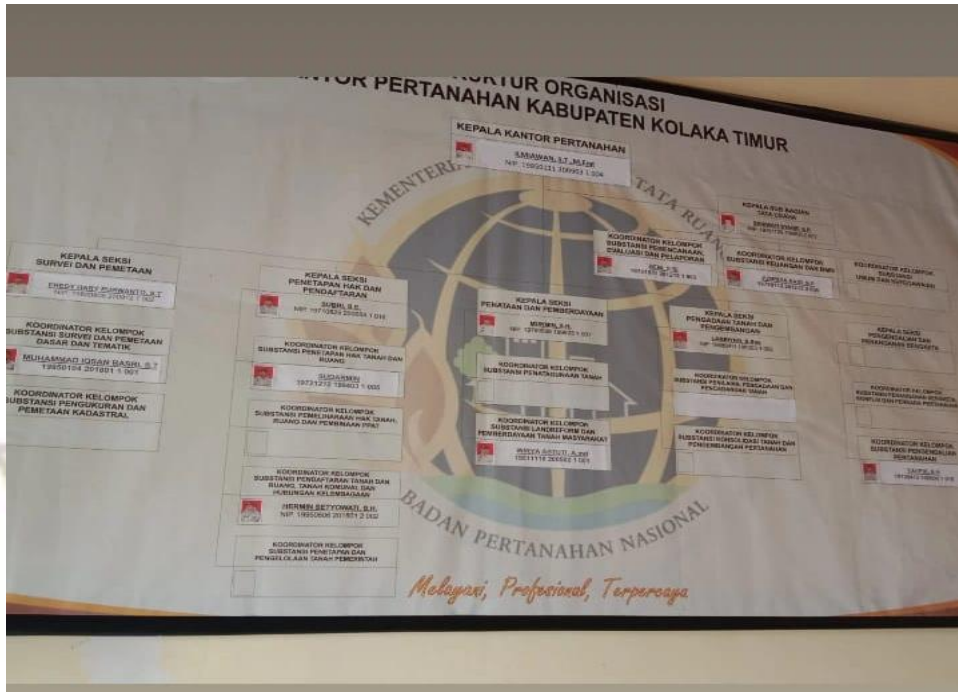
Gambar 2. Struktur Organisasi BPN Kolaka Timur