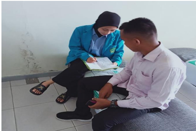
Wawancara Peneliti dengan masyarakat/ Nasabah generasi milenial di Kota Raha wawancara, 29 Agustus 2022