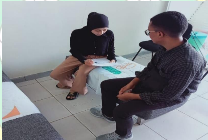
Wawancara Peneliti dengan masyarakat/nasabah generasi milenial BSI di Kota Raha, wawancara, 29 agustus 2022