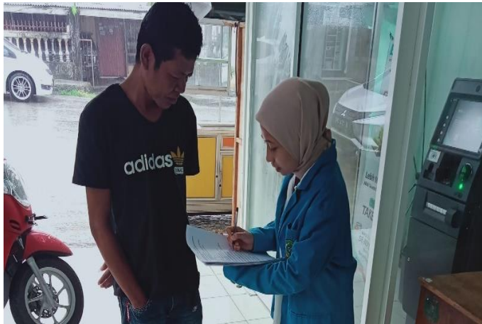
Wawancara Peneliti dengan nasabah generasi milenial BSI di Kota Raha wawancara, 19 september 2022