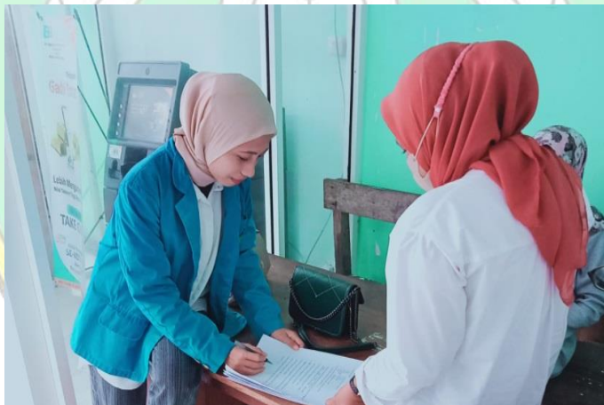
Wawancara Peneliti dengan masyarakat/ nasabah generasi milenial di Kota Raha wawancara, 13 September 2022