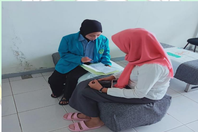
Wawancara Peneliti dengan masyarakat/ Nasabah generasi milenial di Kota Raha Wawancara 19 Agustus 2022