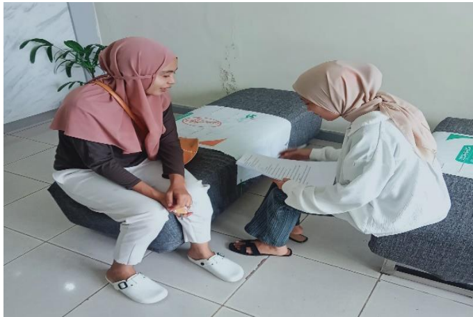
Wawancara Peneliti dengan nasabah generasi milenial, di Kota Raha, wawancara, 09 september 2022