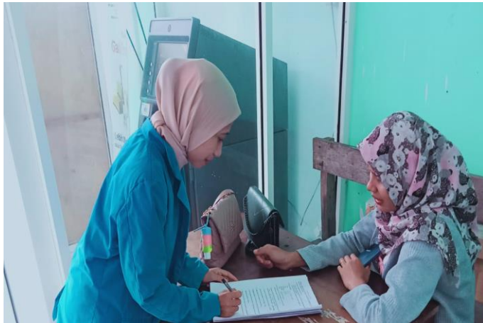
Wawancara Peneliti dengan nasabah generasi milenial BSI di Kota Raha , wawancara 19 Agustus 2022