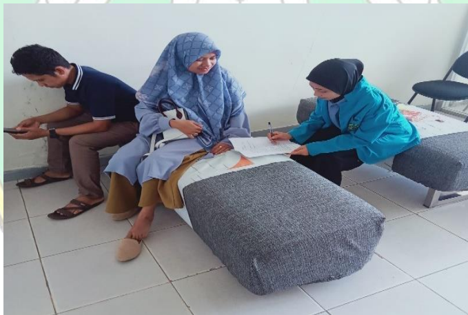
Wawancara Peneliti dengan nasabah BSI di Kota Raha, wawancara, 22 september 2022