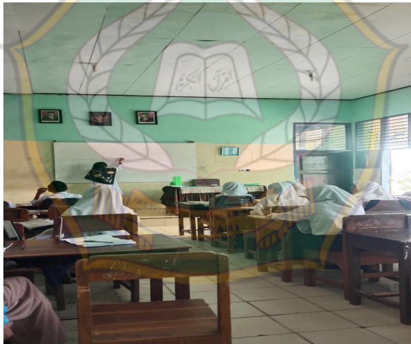
Gambar 11 : Dokumentasi implementasi akhlakul karimah siswa dikelas