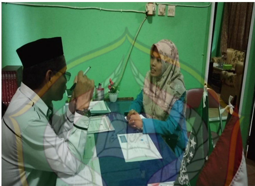
Gambar 2: Wawancara dengan Guru Bimbingan Konseling