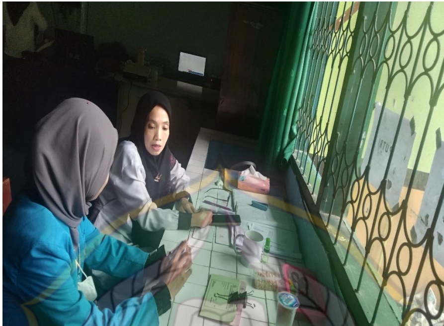
Gambar 4: Wawancara dengan siswi kelas VII6