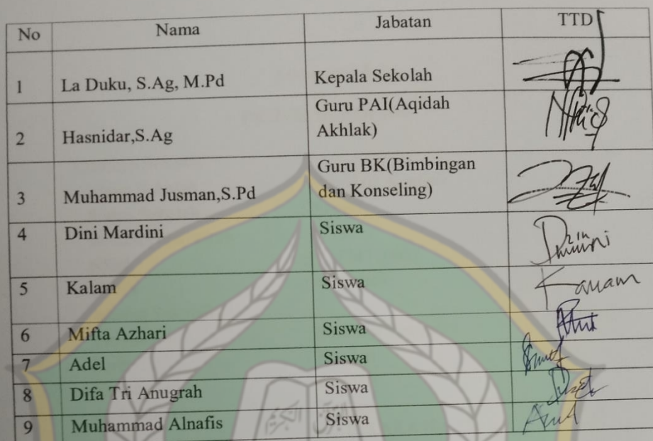
Tabel 3.1 Informan Penelitian