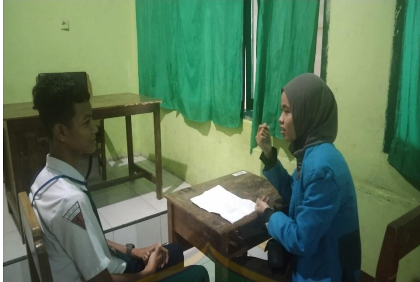
Gambar 10: Dokumentasi suasana proses Pembelajaran Aqidah Akhlak