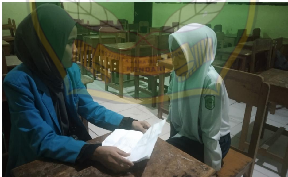
Gambar 5 : Wawancara dengan siswi kelas VII5