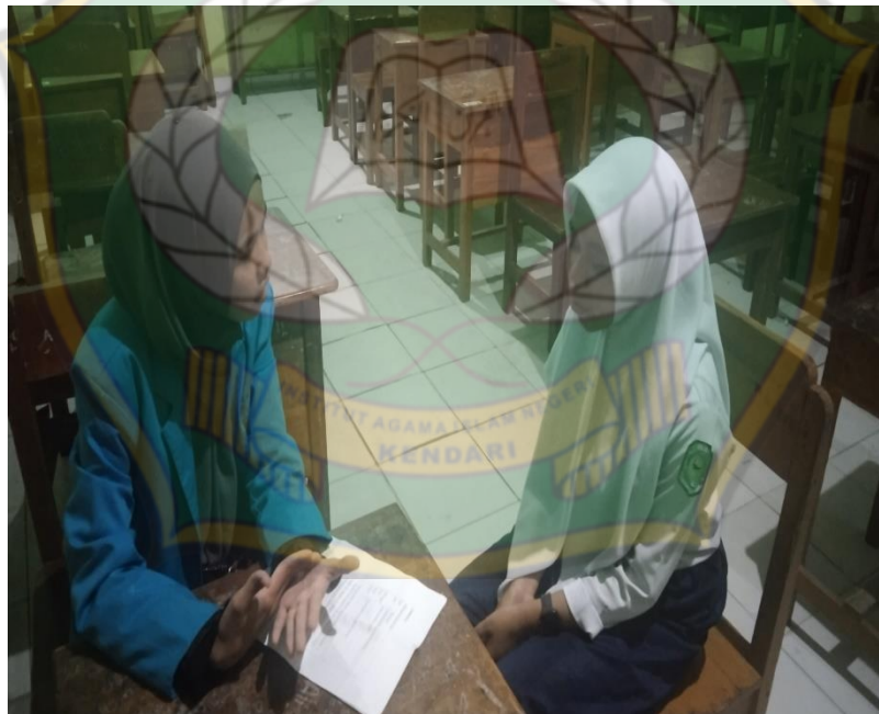
Gambar 7: Wawancara dengan siswa kelas VIII3