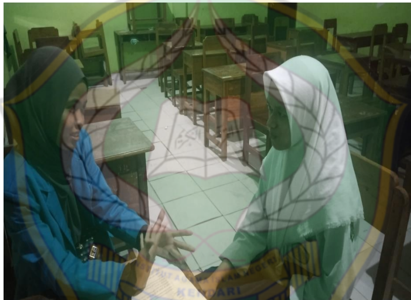
Gambar 9: Wawancara dengan siswa kelas IX1