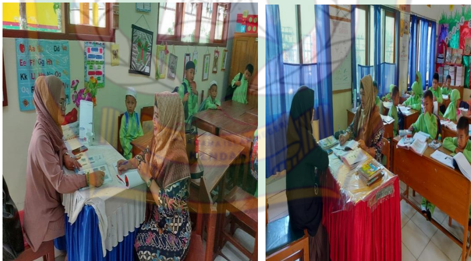
Gambar 6.6 Wawancara Bersama Guru SD Negeri 92 Kendari