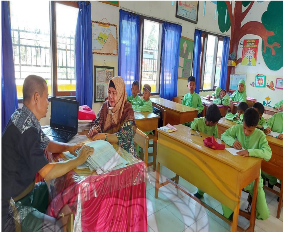
Gambar 7.7 Wawancara Bersama Guru SD Negeri 92 Kendari