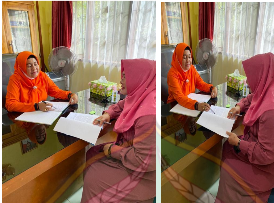
Gambar 3.3 Wawancara dengan Kepala Sekolah SD Negeri 92 Kendari