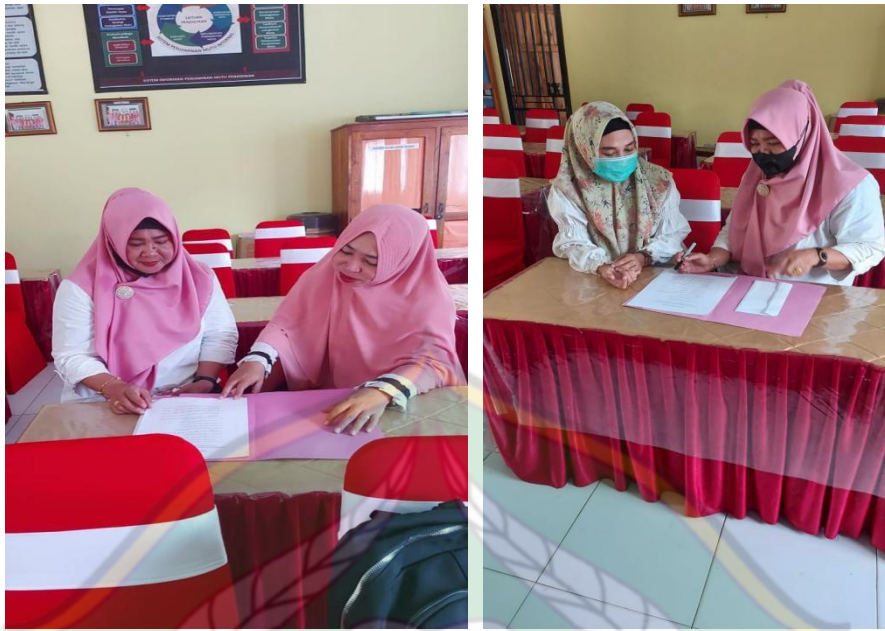
Gambar 5.5 Wawancara dengan Guru SD Negeri 92 Kendari