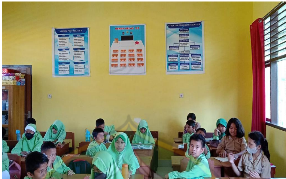
Gambar 2.2. Ruang Kelas SD Negeri 92 Kendari