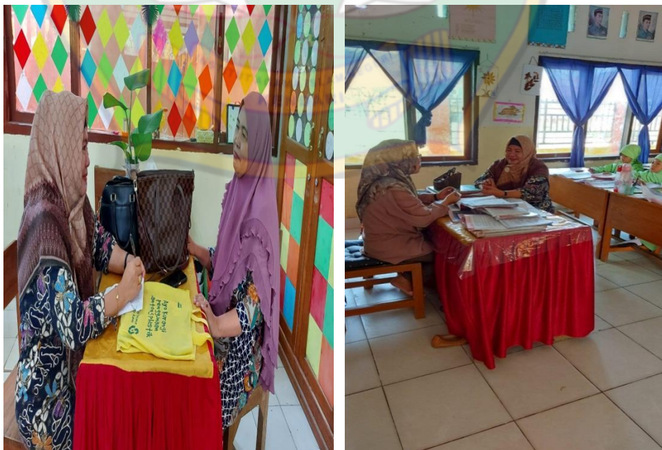
Gambar 8.8 Wawancara Bersama Guru SD Negeri 92 Kendari