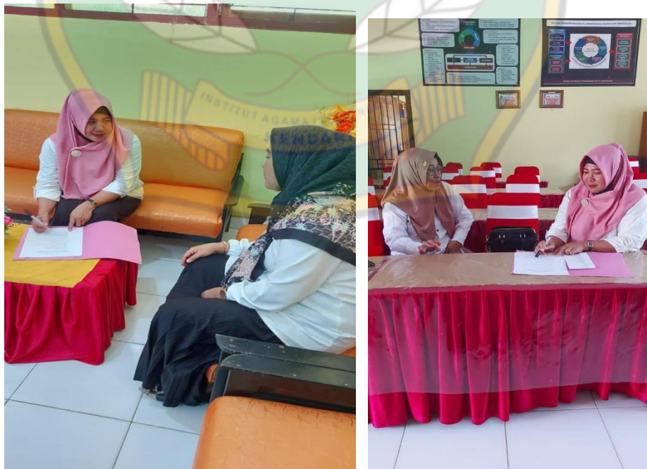
Gambar 4.4 Wawancara dengan Guru SD Negeri 92 Kendari