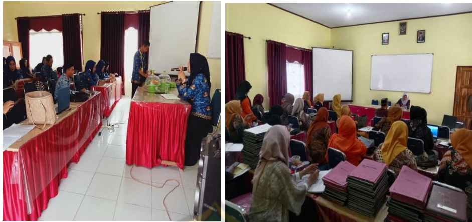
Gambar. 8.9 Rapat KS dan Guru-guru SD Negeri 92 Kendari