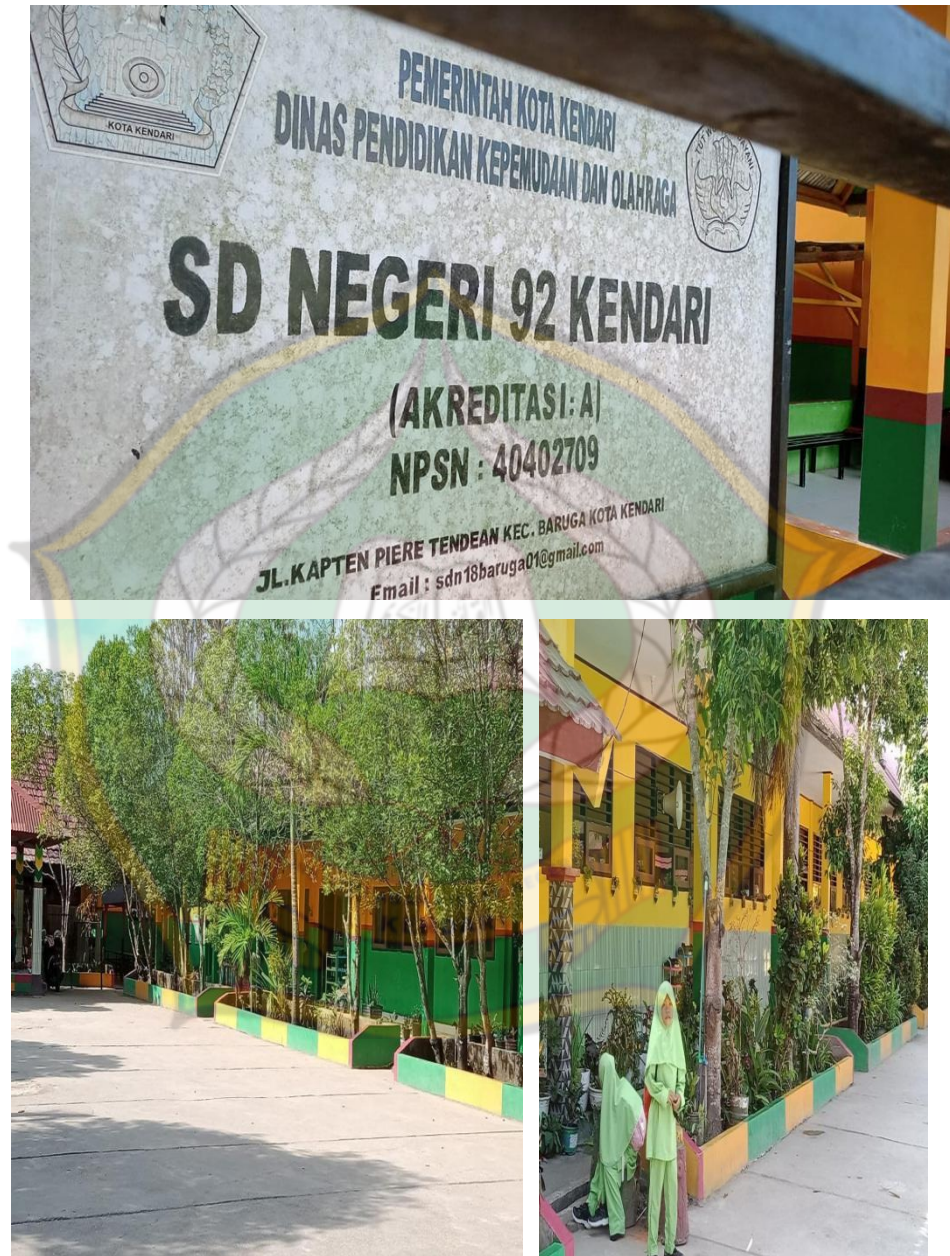
Gambar 1.1 Sekolah SD Negeri 92 Kendari