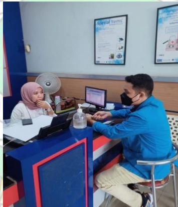
(wawancara bersama Front Office Tiki Kendari)