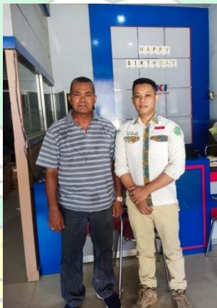
(bersama kepala pimpinan Tiki Cabang Kendari)