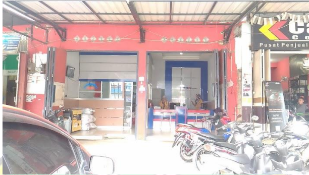
(Tiki Cabang Kendari)