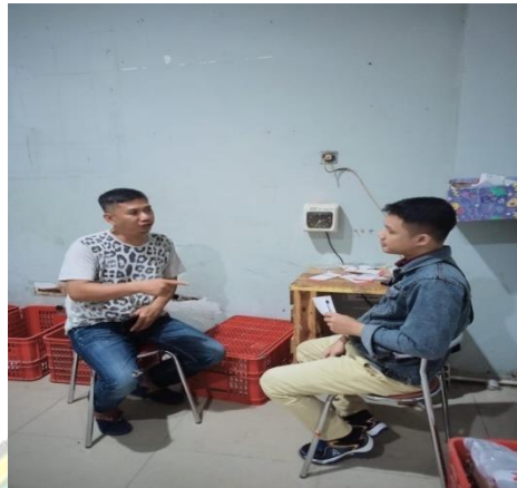
(wawancara bersama manager operasional Tiki Kendari)