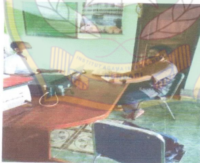
Dokumentasi : Wawancara Penghulu Kua Kecamatan Wua-Wua