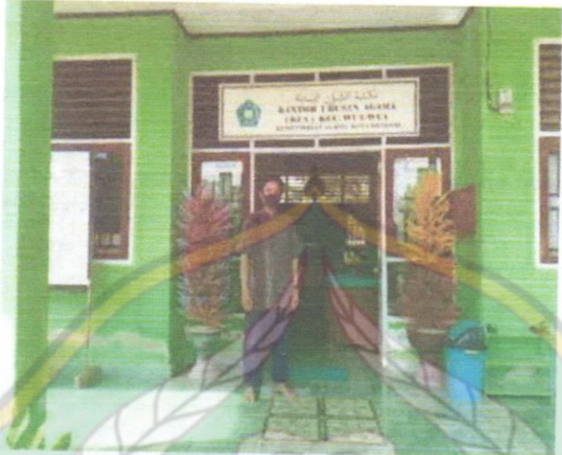
Dokumentasi : Kantor Kua Kecamatan Wua-Wua