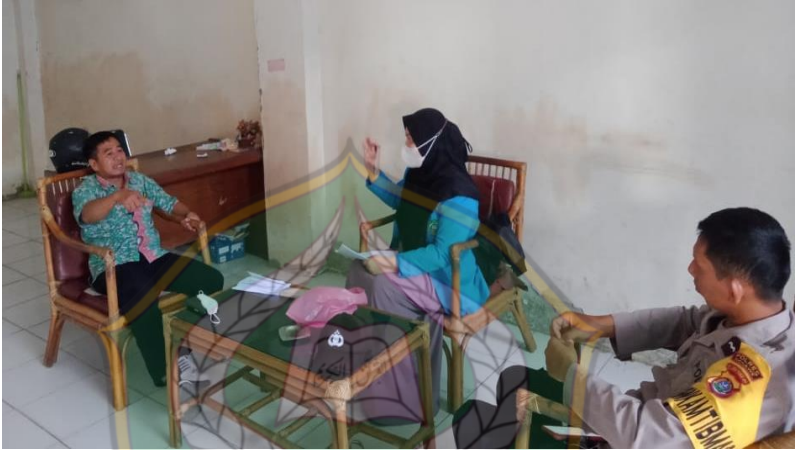
Gambar 2 wawancara dengan pedagang pasar