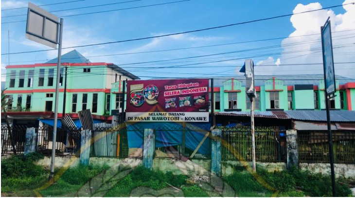
Gambar 4 kantor pengelola pasar