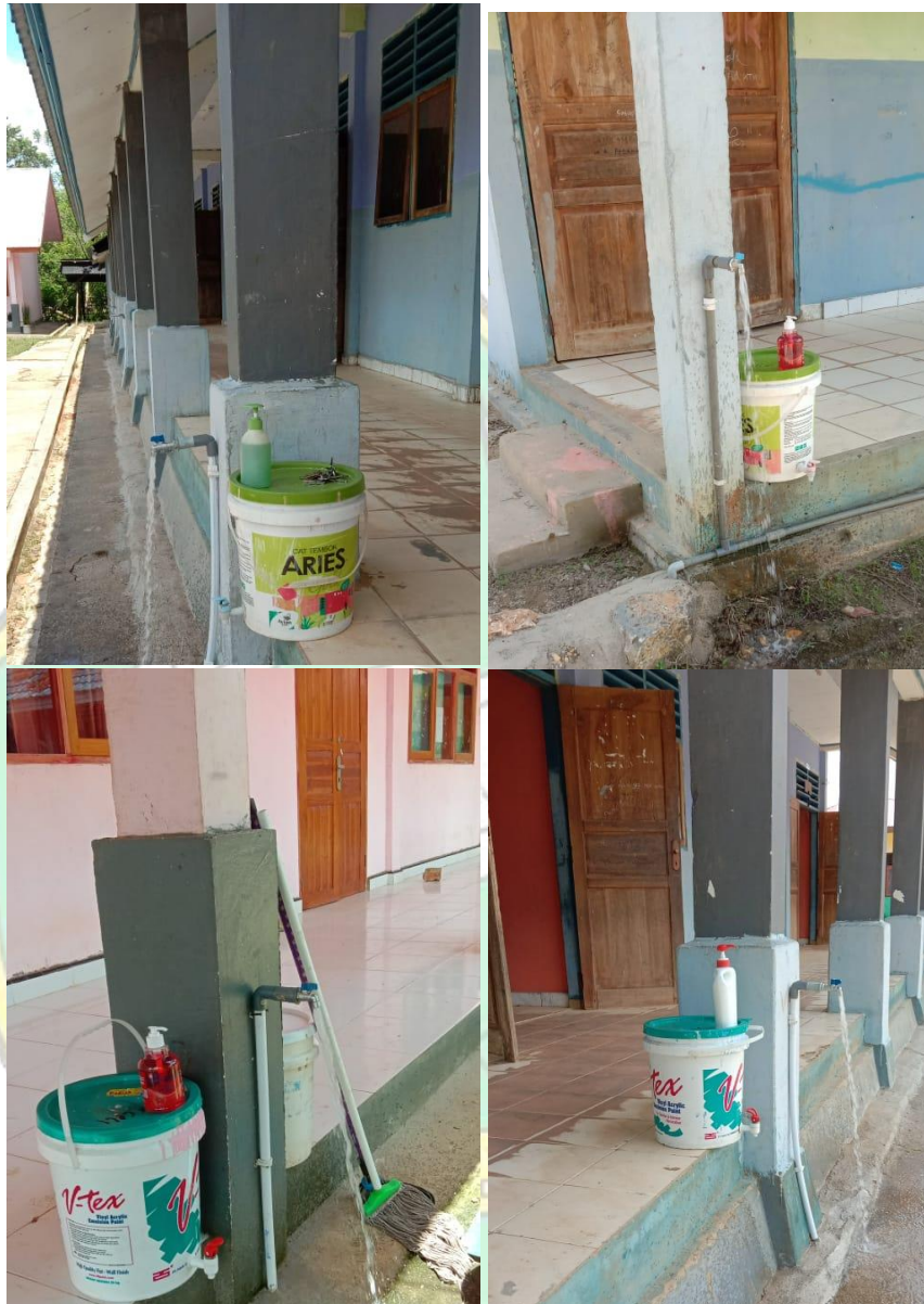
Gambar 9. Keran Air serta Perlengkapan untuk Mencuci Tangan sebagai Penunjang Pembelajaran Selama Pandemi Covid-19.