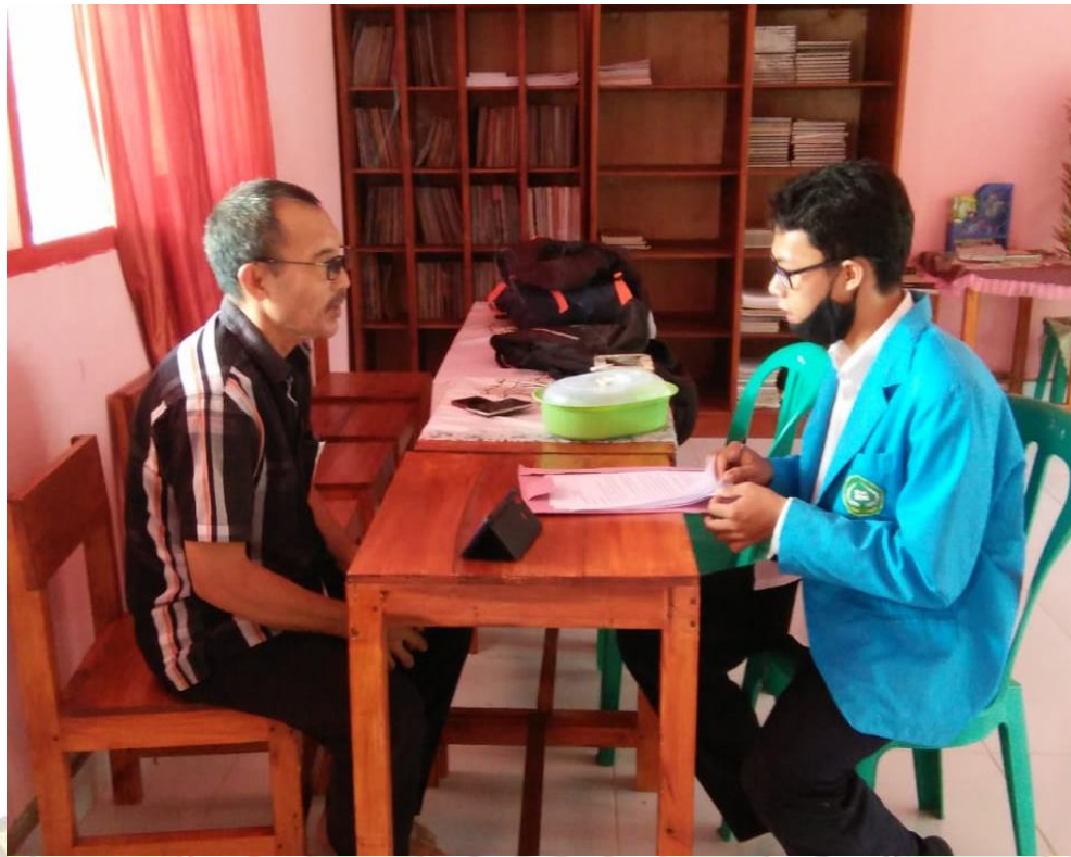
Gambar 3. Wawancara Kepala Sekolah SDN Satap 04 Konsel