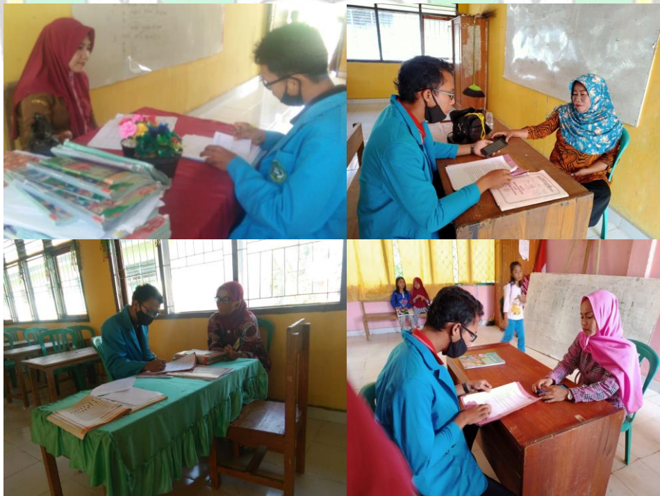
Gambar 4. Wawancara Guru Kelas SDN Satap 04 Konsel.