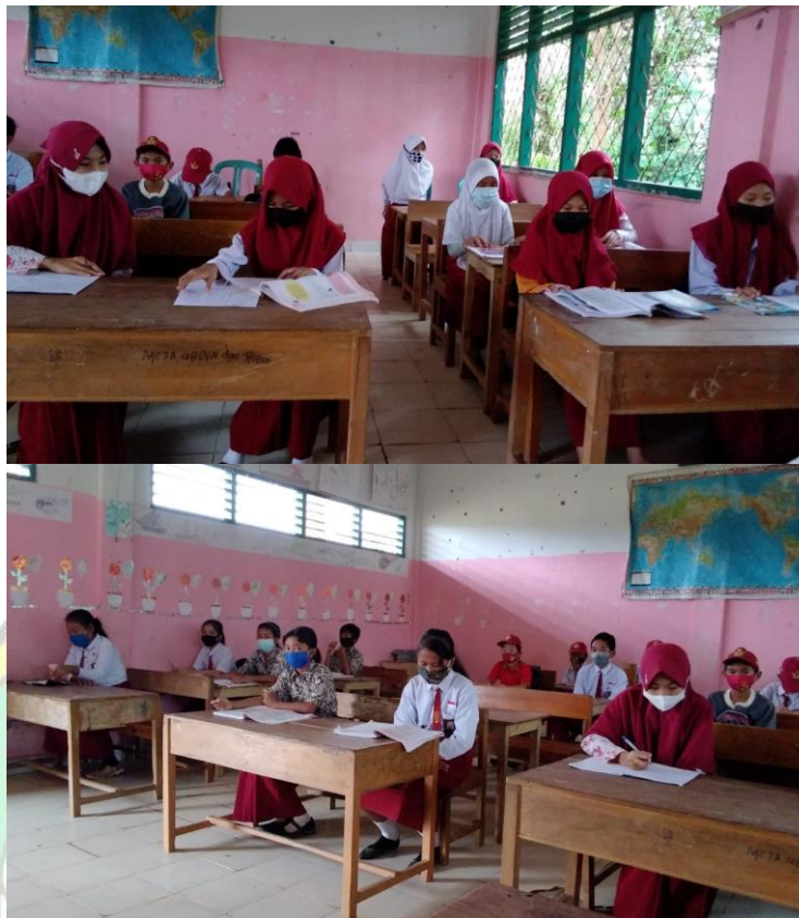
Gambar 9. Suasana Saat Pembelajaran Offline Selama Masa Pandemi Covid-19