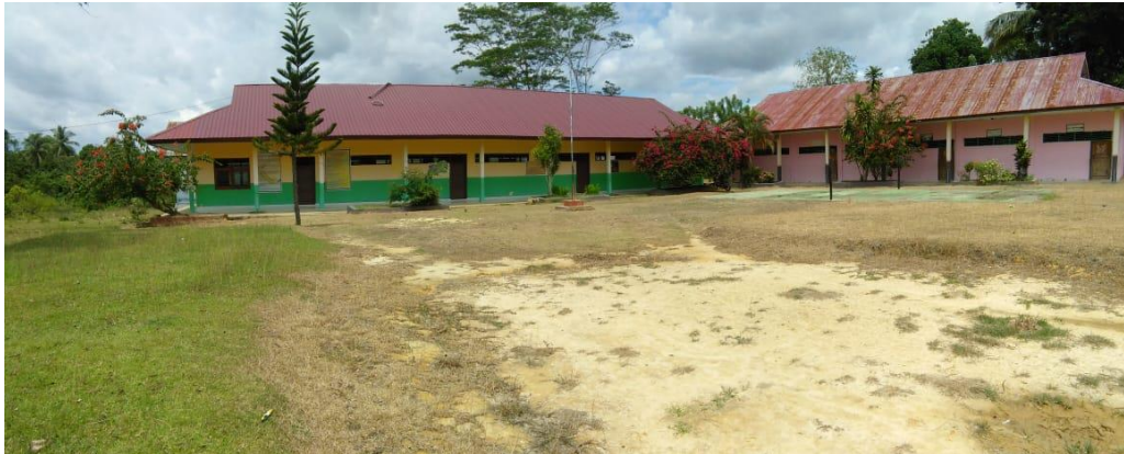
Gambar 1. Gedung KBM SDN Satap 04 Konsel.