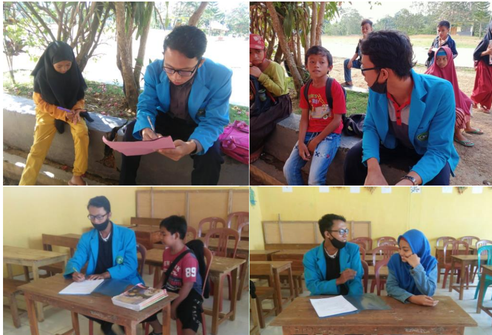
Gambar 5. Wawancara dengan Peserta Didik SDN Satap 04 Konsel