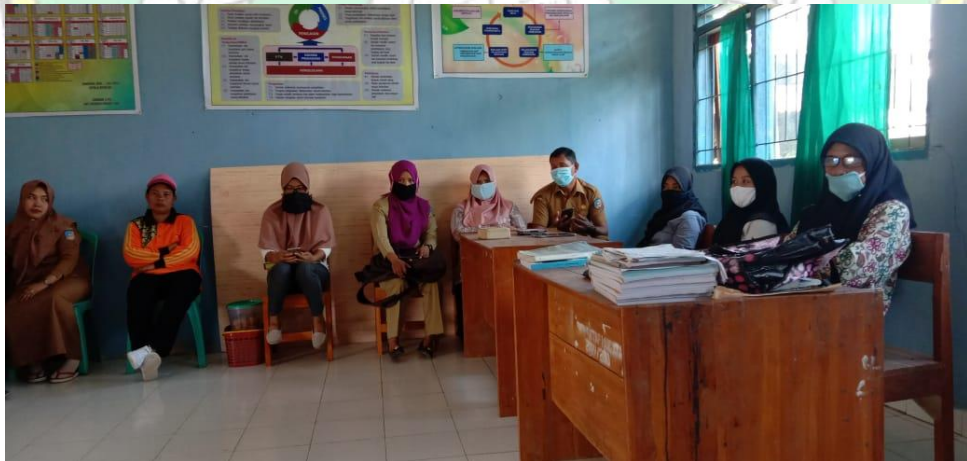
Gambar 6. Rapat Program Semester