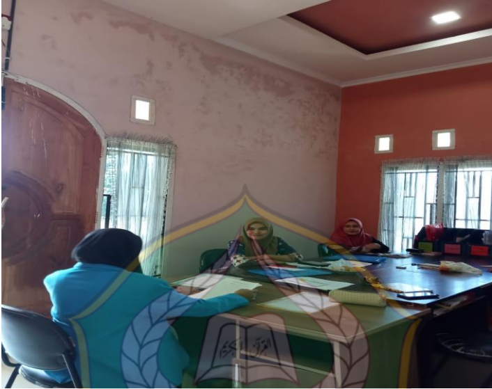
Pengambilan data primer dengan karyawan BTPN Syariah pada tgl 1 Desember 2022