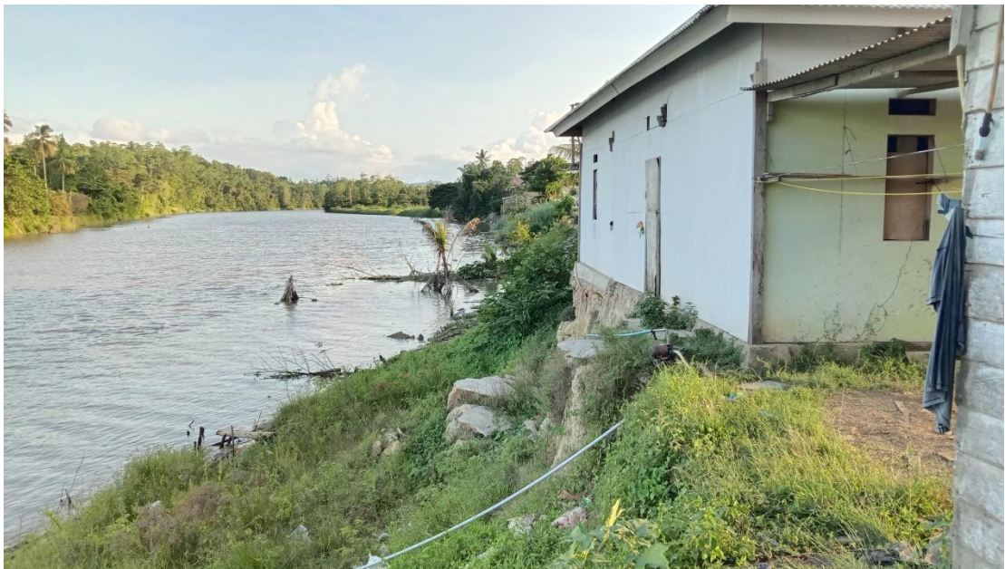
Rumah warga yang terkena longsor di Desa Besu Kec. Morosi