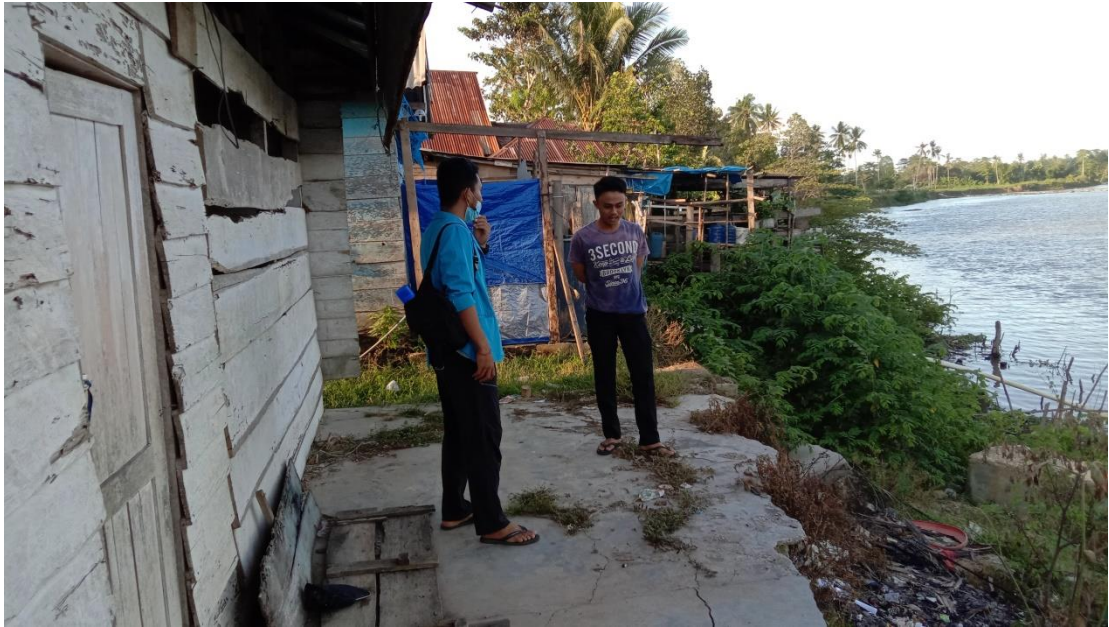
Wawancara kepada salah satu anggota karang taruna Desa Besu, Kec. Morosi Yang rumahnya terkena dampak dari longsor akibat penambangan