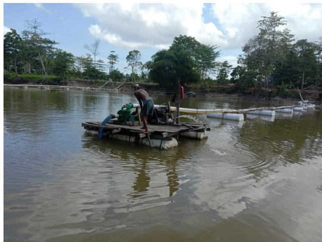
Proses penambangan pasir sungai Konaweaha