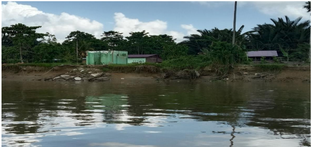
Rumah warga yang rusak akibat longornya bibir sungai (tampak belakang) Lokasi Kelurahan Laosu Kec. Bondoala