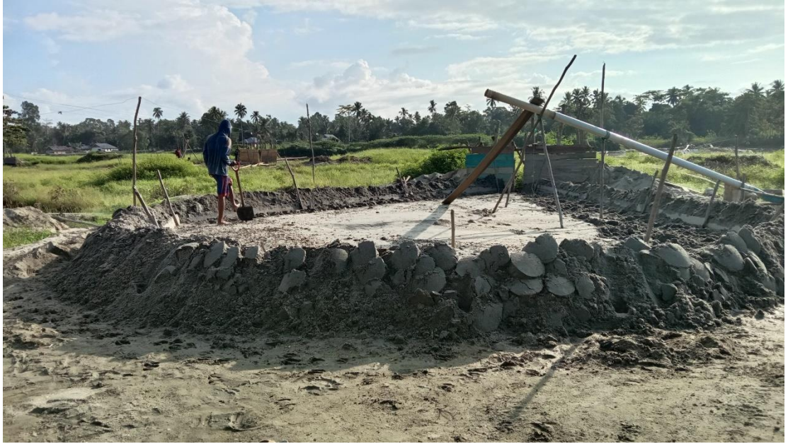
Proses penyedotan pasir di Desa Puusangi Kec. Anggalomoare