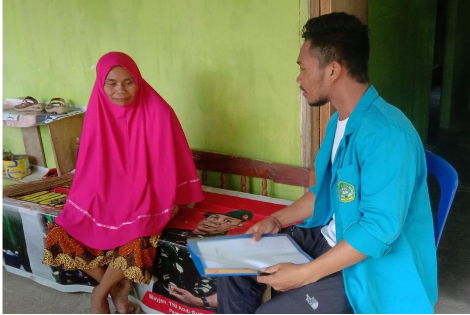
Wawancara kepada Ny. Pode sebagai salah satu penambang Lokasi Desa Rambu Kongga Kec. Bondoala