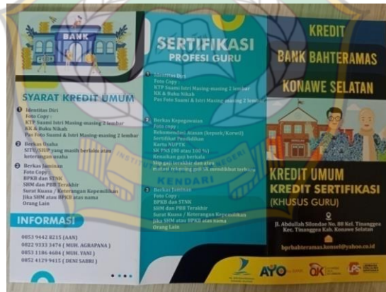
Gambar 9. Brosur kredit PD. BPR. Bahteramas Konawe Selatan