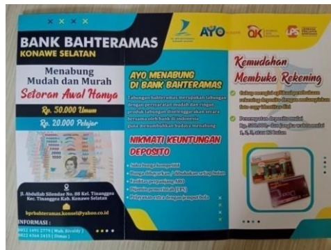
Gambar 10. Brosur tabungan PD. BPR. Bahteramas Konawe Selatan