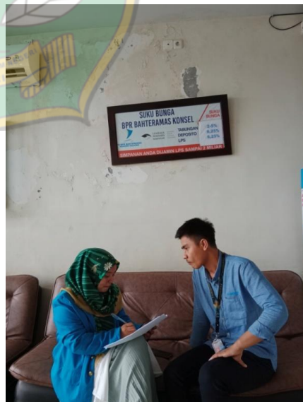
Gambar 3. Wawancara dengan