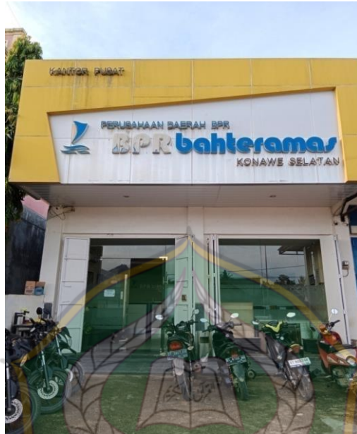
Gambar 11. Gedung Kantor Pusat PD. Bahteramas Konawe Selatan