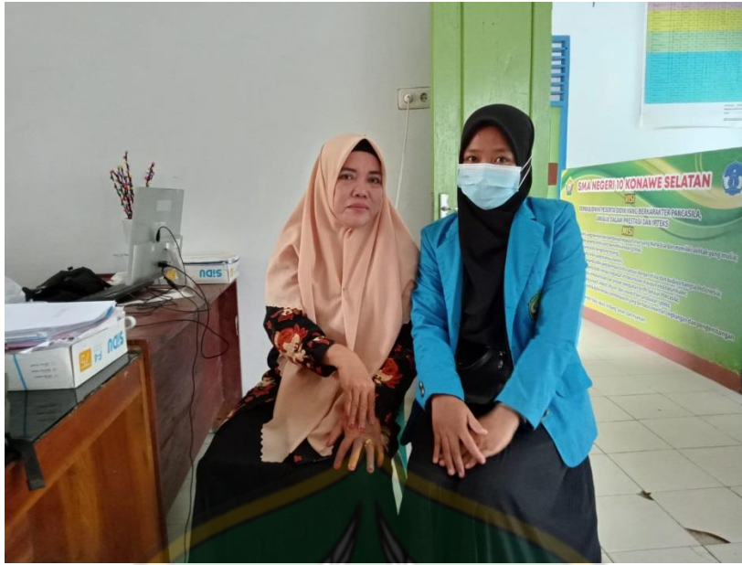
Wawancara dengan Kepala Sekolah SMAN 10 Konawe Selatan