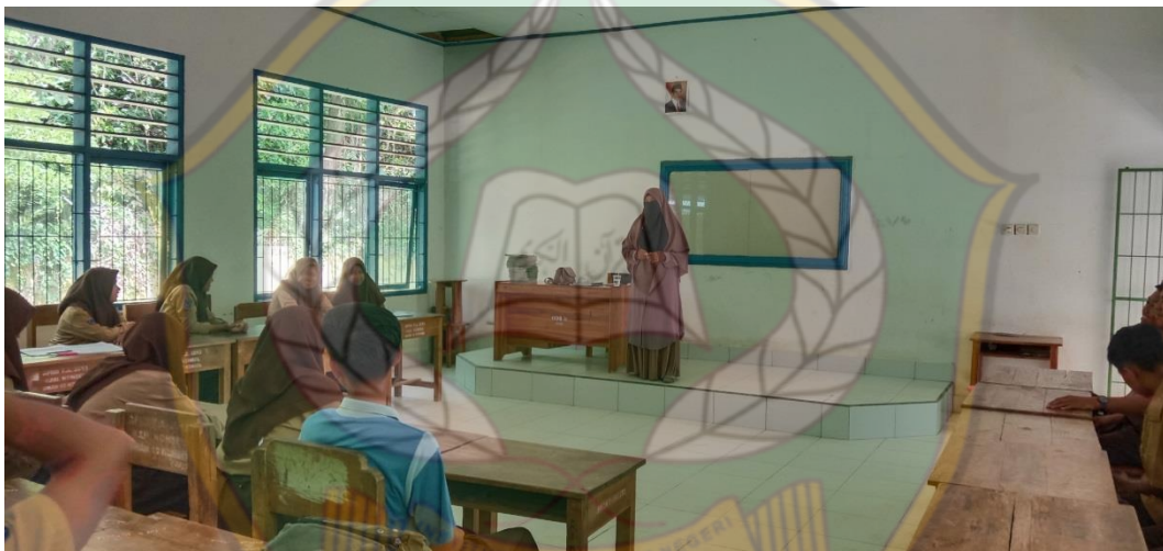
Wawancara dengan Guru PAI Di SMAN 10 Konawe Selatan