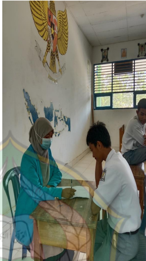
Wawancara dengan Guru PAI Di SMAN 10 Konawe Selatan