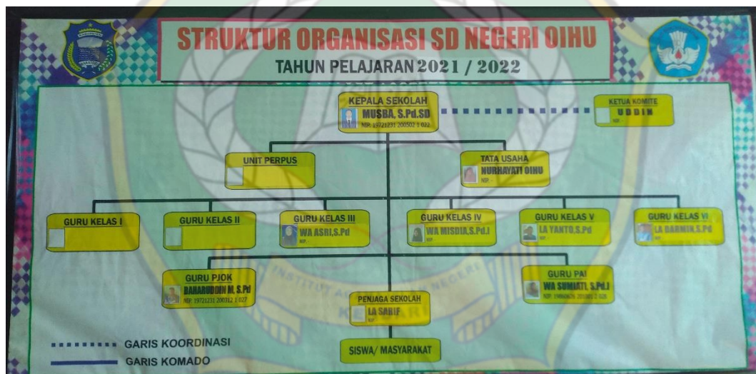
Gambar 1. Struktur Organisasi