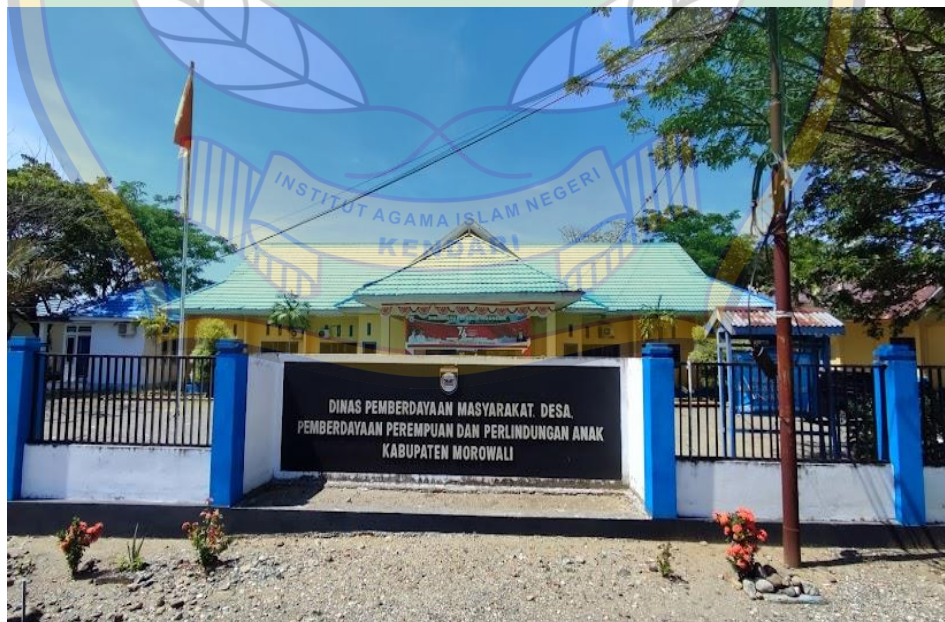
Gambar: 2. Gedung Dinas Pemberdayaan Masyarakat Desa, Pemberdayaan Perempuan dan Perlindungan Anak Kabupaten Morowali