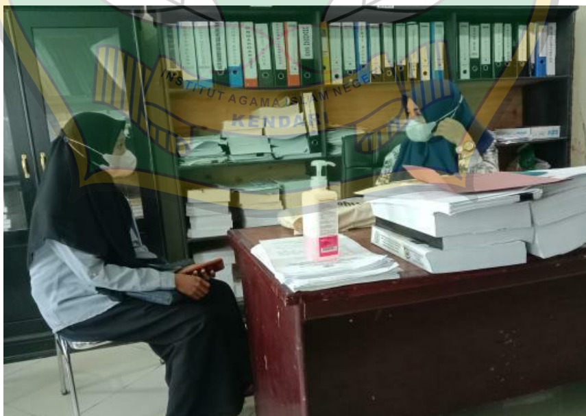
Sumber: Dialog di lapangan Tahun 2021