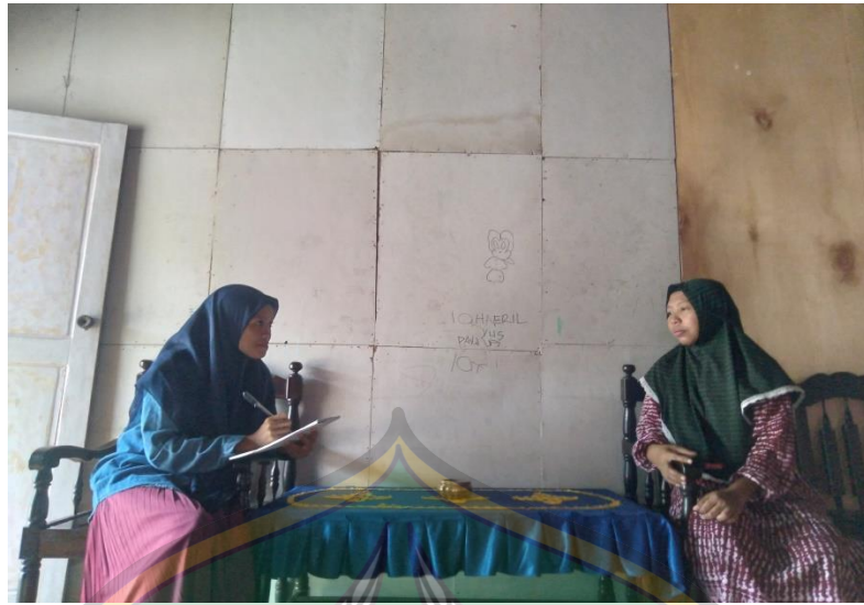
Sumber: Dialog di lapangan Tahun 2022