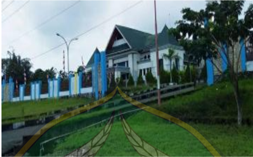
Gambar: 1. Gedung DPRD Kabupaten Morowali