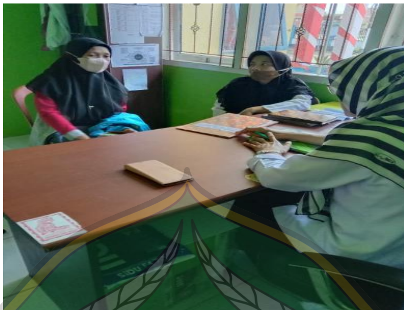
Sumber: Dialog di lapangan Tahun 2021