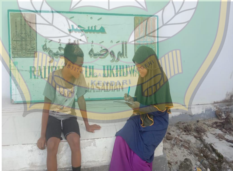
Sumber: Dialog di lapangan Tahun 2022