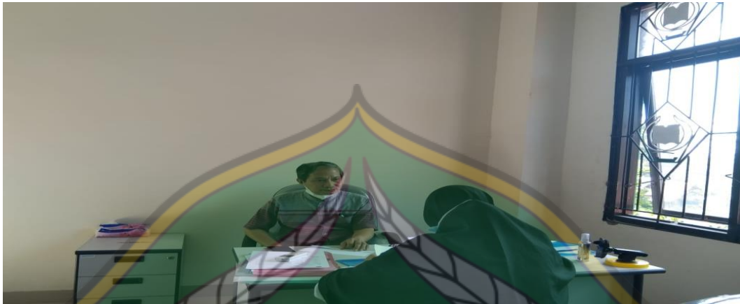
Foto Wawancara Bersama Dosen Biologi