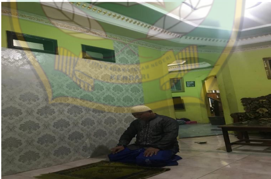
Dokumentasi Tokoh pajappi-jappi melakukan shalat sunnah hajat 2 rakaat