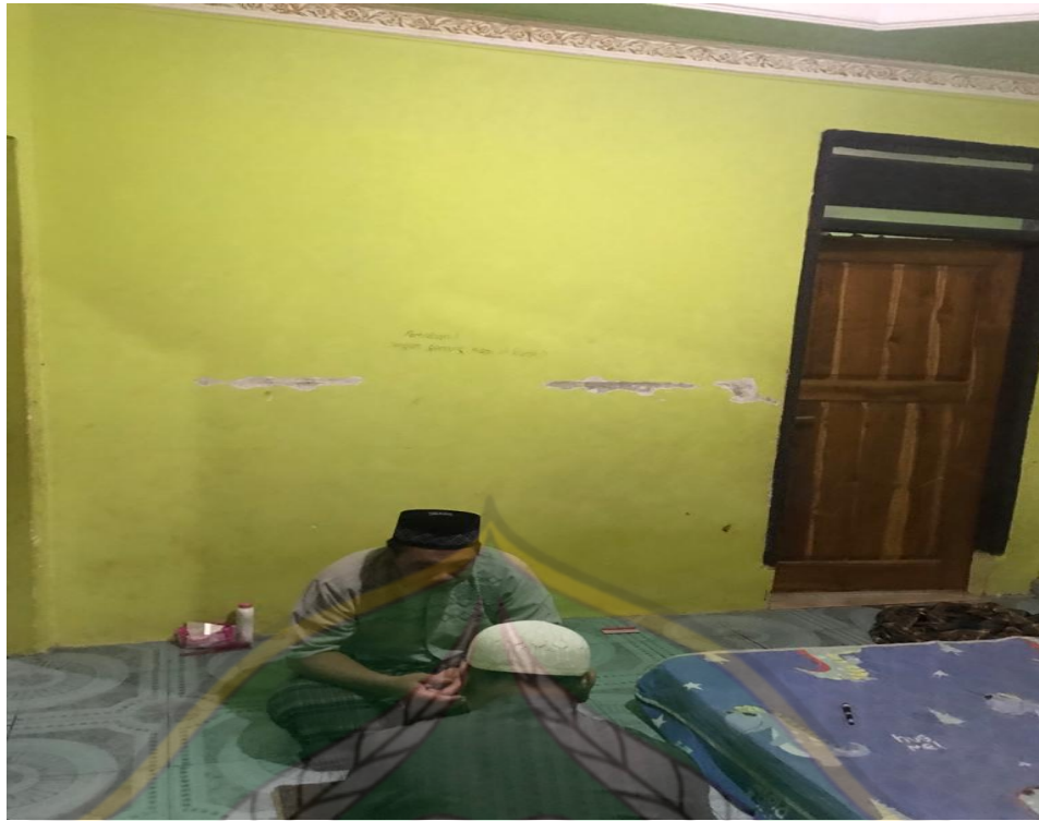
Dokumentasi pajappi-jappi membacakan QS. Al-Fātiḥah ke dalam air untuk di minum oleh para pasien, dan tokoh pajappi-jappi akan memberi tahu di mana barang para pasien tersebut