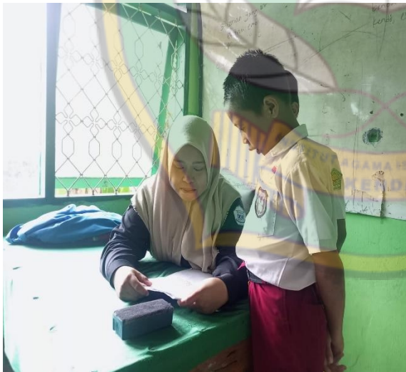
Wawancara dengan Peserta didik Kelas IV.C