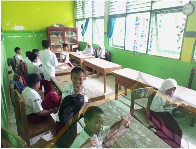
Situasi kelas IV.C saat proses pembelajaran