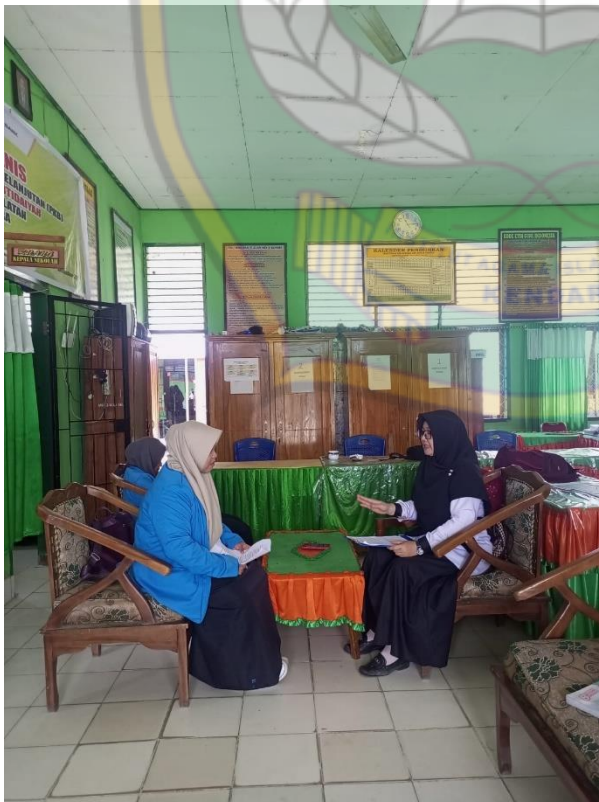
Wawancara dengan guru Kelas IV.B