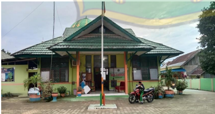
Keadaan Gedung dan halaman MIN 2 Konawe Selatan