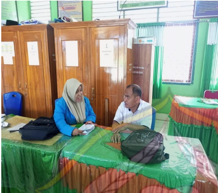
Wawancara dengan guru Akidah akhlak dan Fiqih