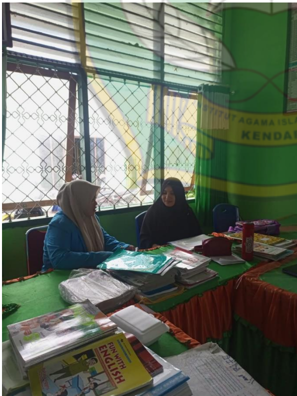
Wawancara dengan guru Al- Qur'an Hadist