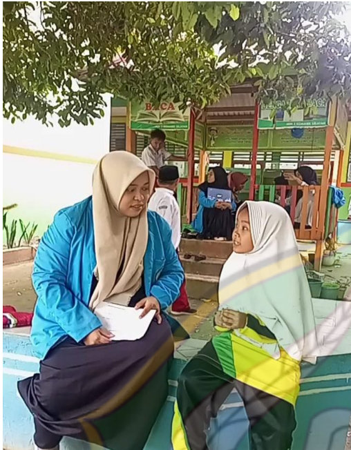
Wawancara dengan peserta didik Kelas IV.B