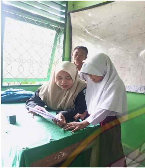
Wawancara dengan Peserta didik Kelas IV.C