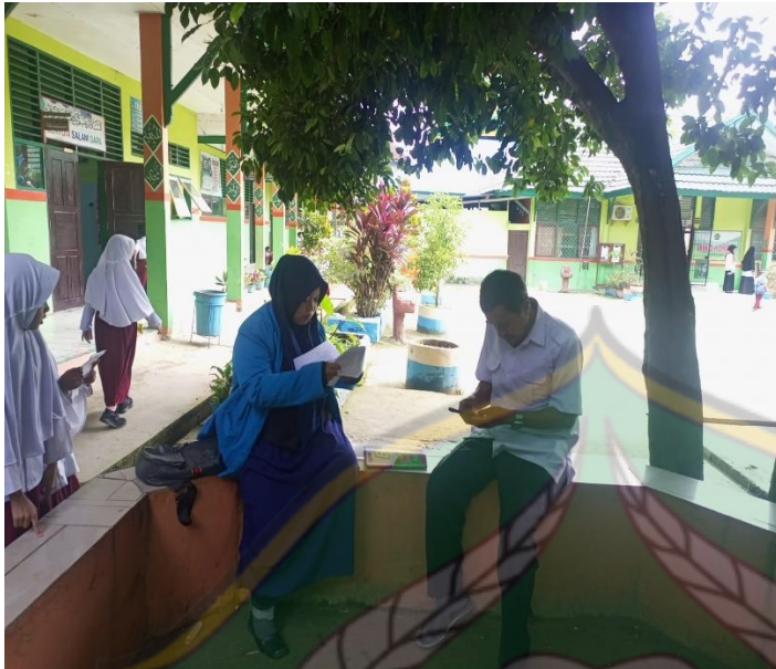
Wawancara dengan guru kelas IV.C