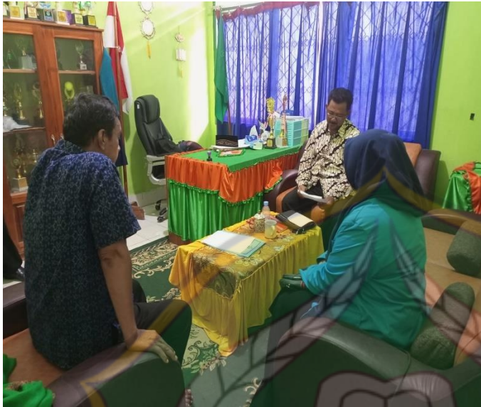
Wawancara dengan kepala Sekolah