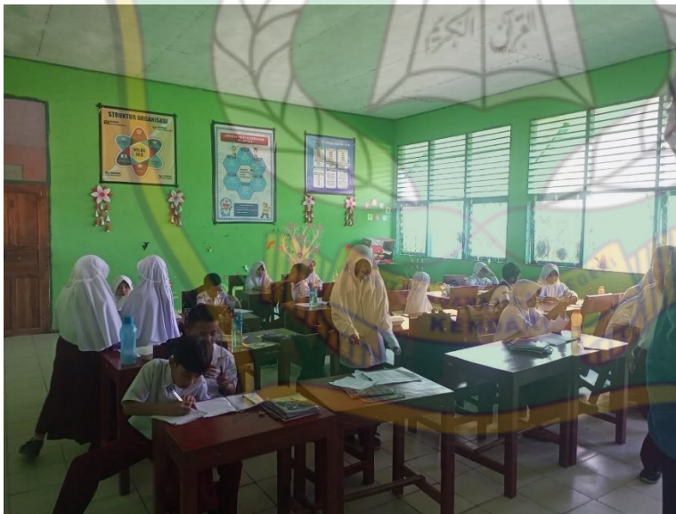
Situasi Kelas IV.B Saat Proses Pembelajaran