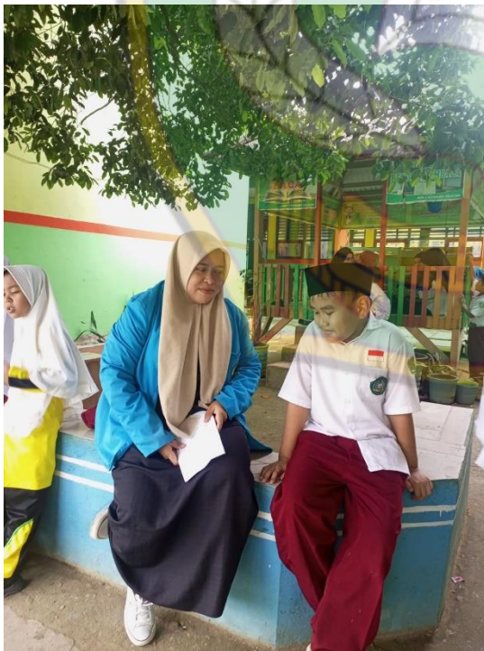
Wawancara dengan Peserta didik kelas IV.B