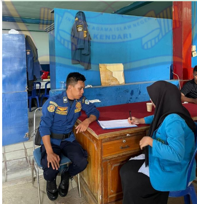
Gambar 6. Asparin (Pasukan Pemadam), Tanggal 29 Mei 2023