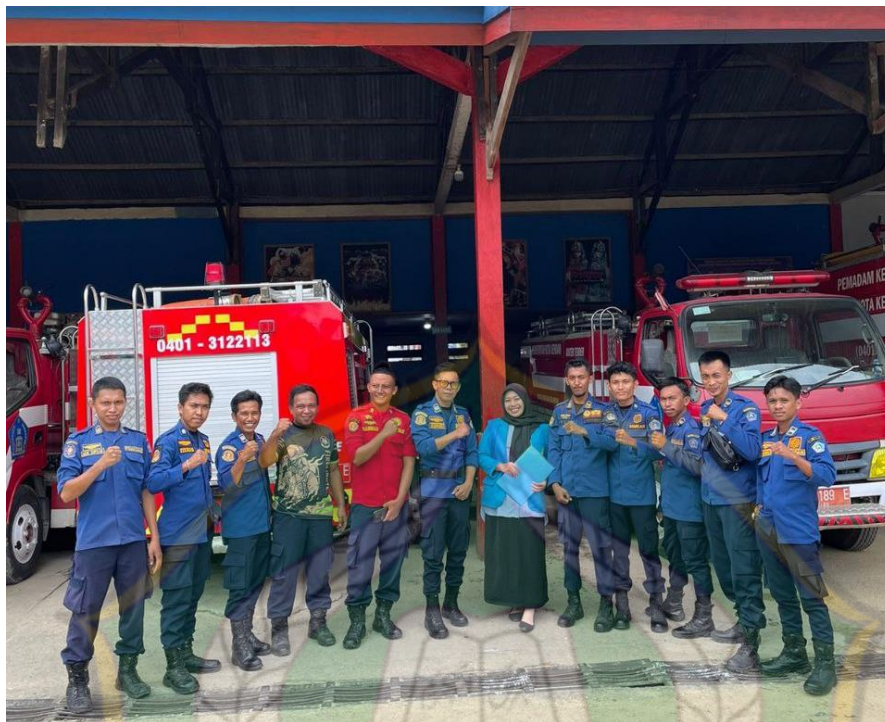
Gambar 9. Foto Bersama Pasukan Pemadam