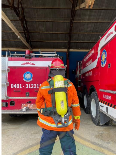
Gambar 3. Breathing Apparatus sebagai Alat Bantu Pernafasan. (Tanggal : 21 Februari 2023)