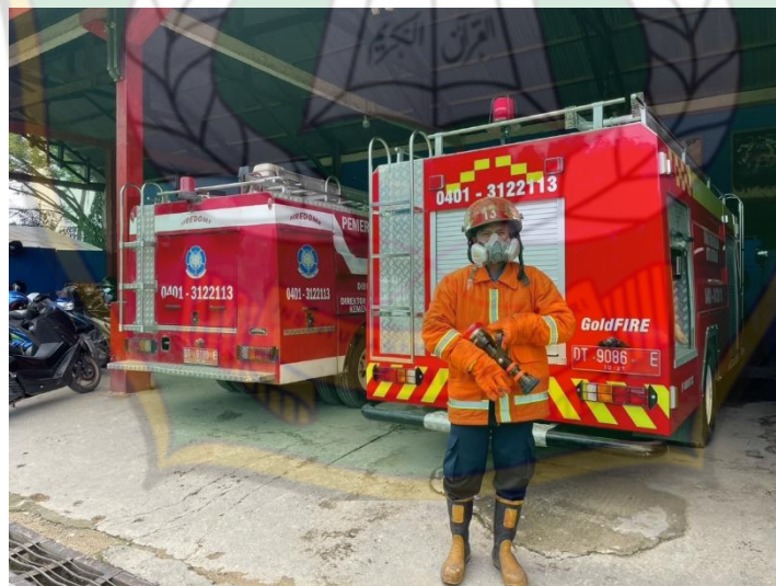
Gambar 2. Atribut Baju Anti Api, Sarung Tangan, Helm, dan Sepatu Boot. (Tanggal, 21 Februari 2023)