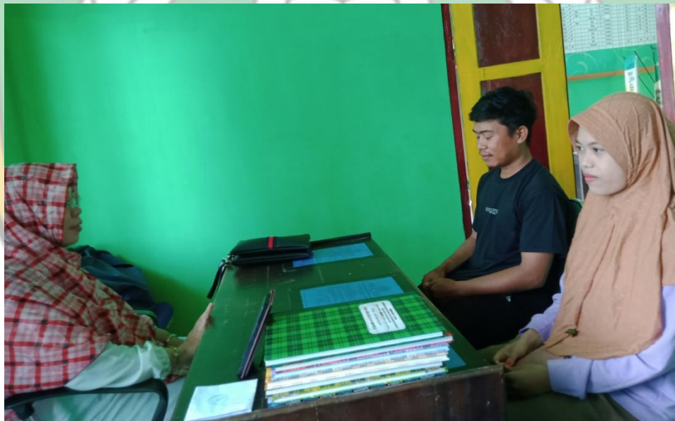
Kegiatan Bimbingan Pra Nikah 31 Mei 2023