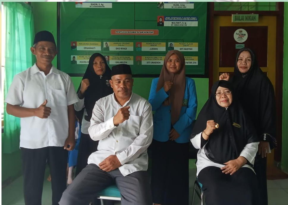
Kepala KUA, Penyuluh Agama Islam Fungsional & Penyuluh Agama Islam Non