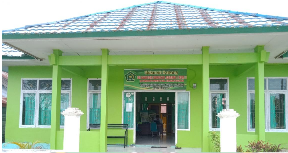
Kantor Urusan Agama Kecamatan Mowila