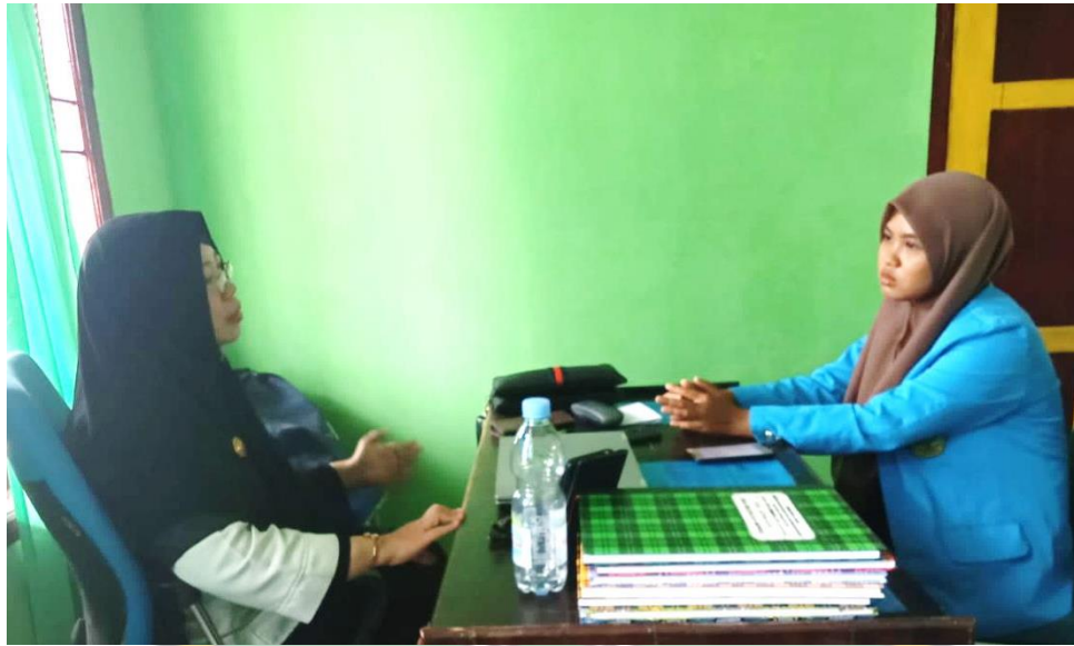
Husni, S.A. g Wawancara 29 Mei 2023