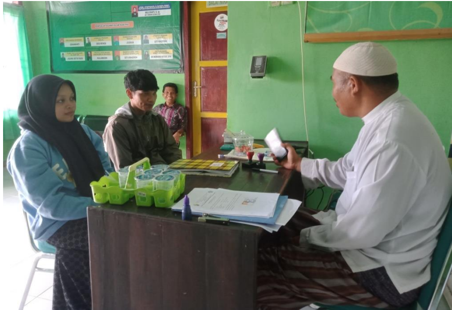
Kegiatan Bimbingan Pra Nikah 6 Juni 2023