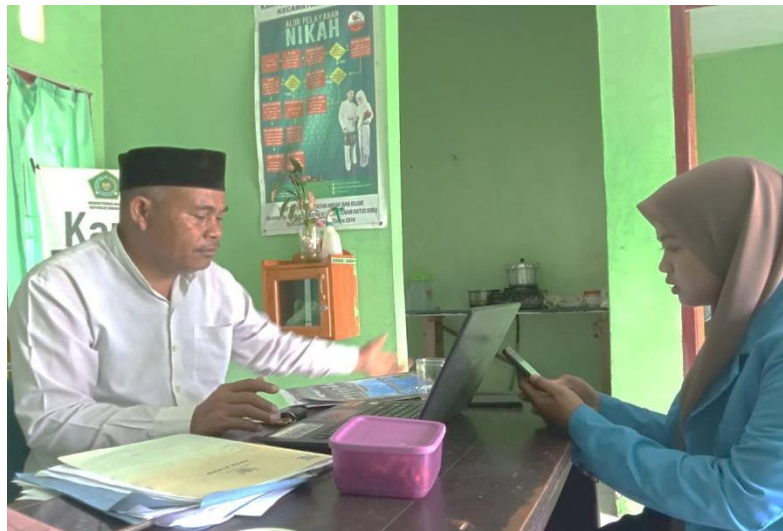
Ibadin, S. Ag Wawancara 29 Mei 2023