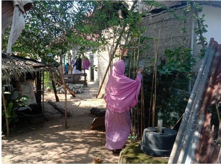
Gambar 7. Perkenalan Salah Satu Tumbuhan Obat Tradisional