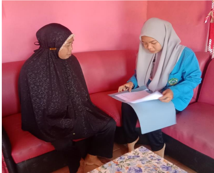
Gambar 5. Wawancara tokoh masyarakat