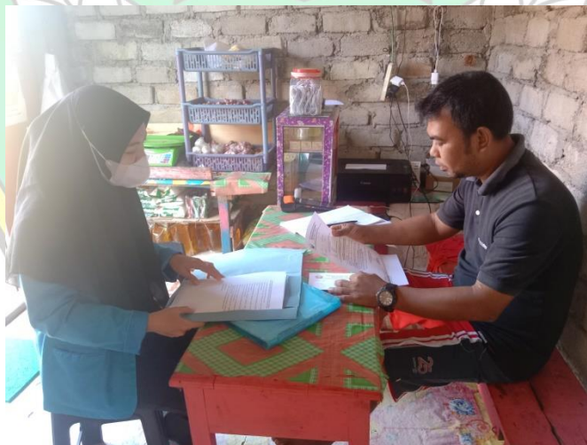
Gambar 2. Wawancara Kepala Desa