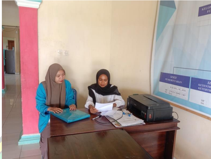
Gambar 1. Penyerahan Surat Izin Penelitian