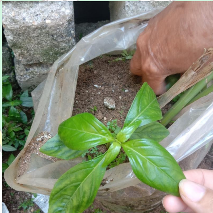
Gambar 8. Pengambilan Sampel Tumbuhan Obat Tradisional