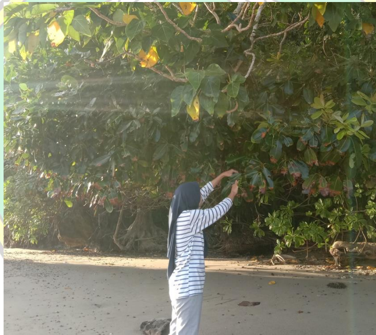
Gambar 6. Pencarian Sampel Tumbuhan Obat