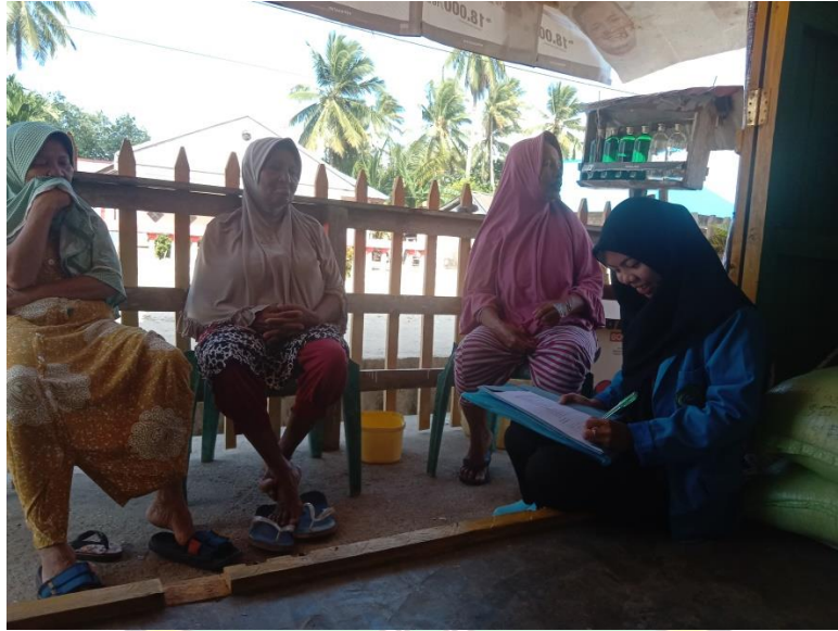
Gambar 3. Wawancara dukun terkait pemanfaatan tumbuhan obat