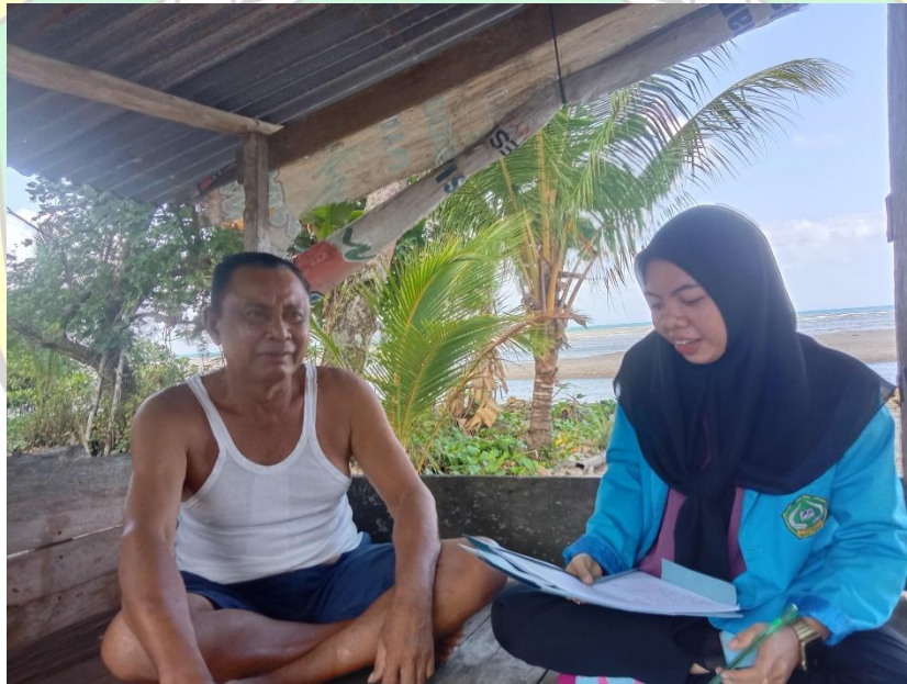
Gambar 4. Wawancara tokoh adat