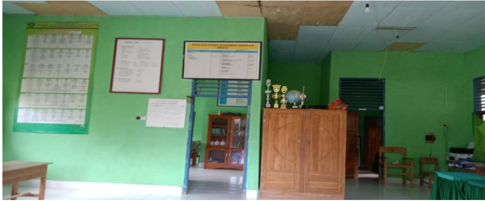
Ruang Guru MIN 1