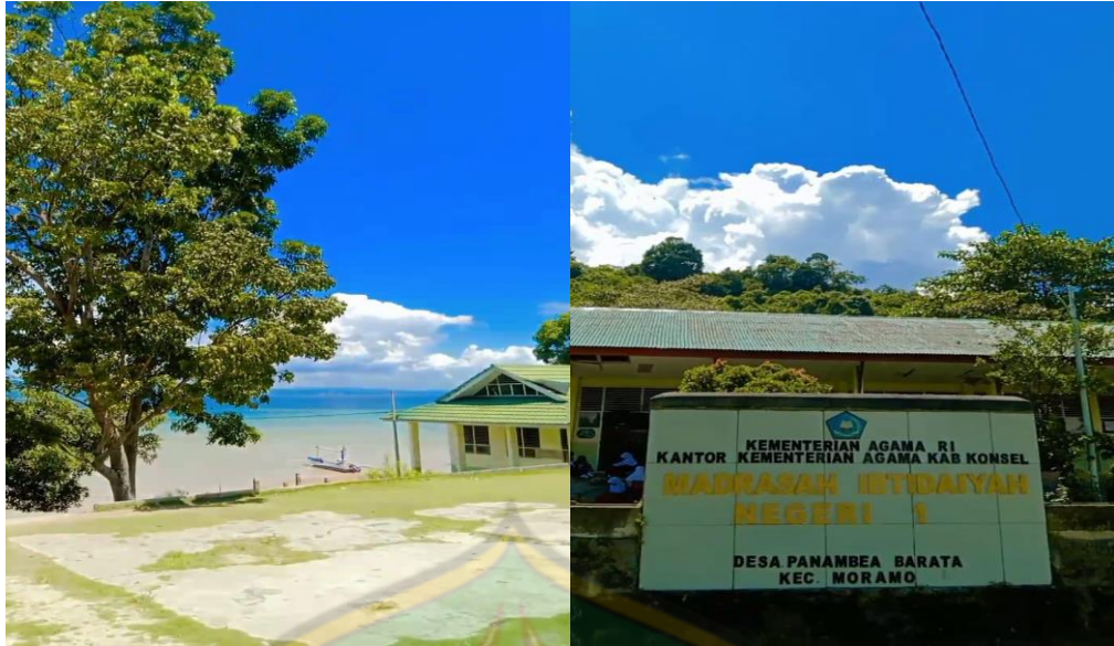
Halaman Depan MIN 1 Konsel