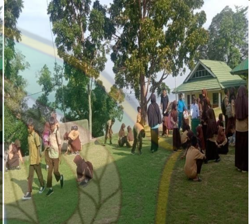
Kegiatan Jumat Bersih