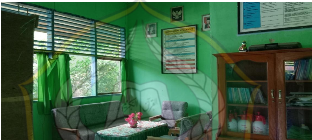
Ruang Kepala Madrasah