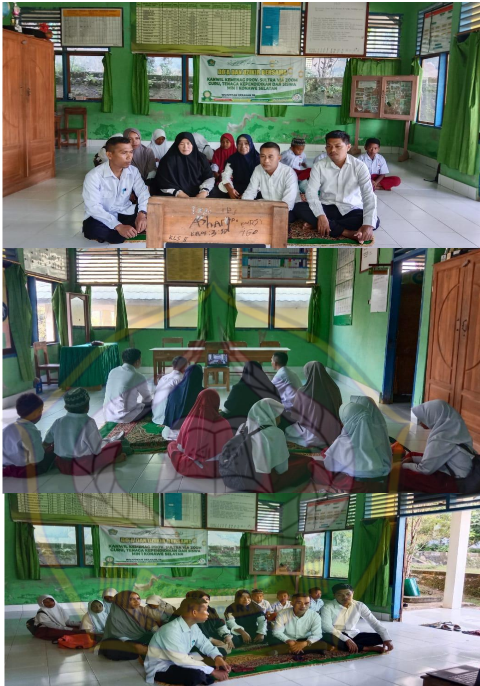
Dzikir Dan Doa Bersama