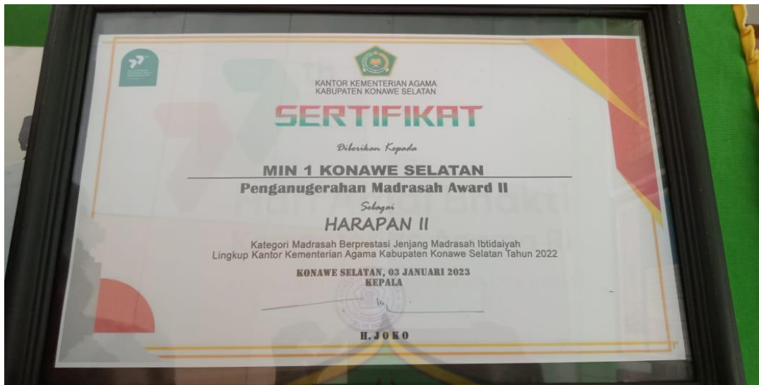
Sertifikat Penganugerahan Madrasah