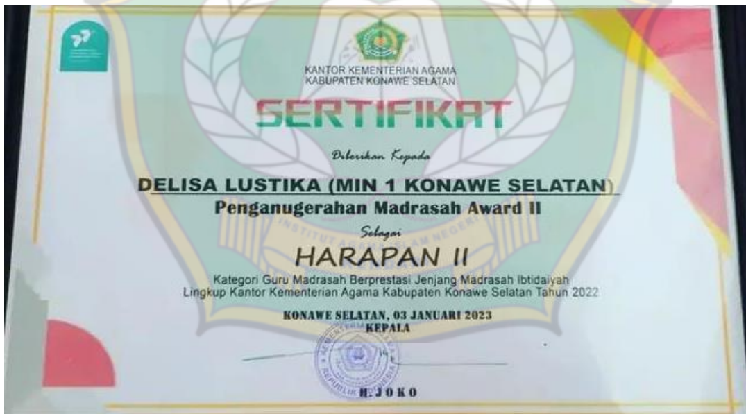
Sertifikat Guru Madrasah Berprestasi