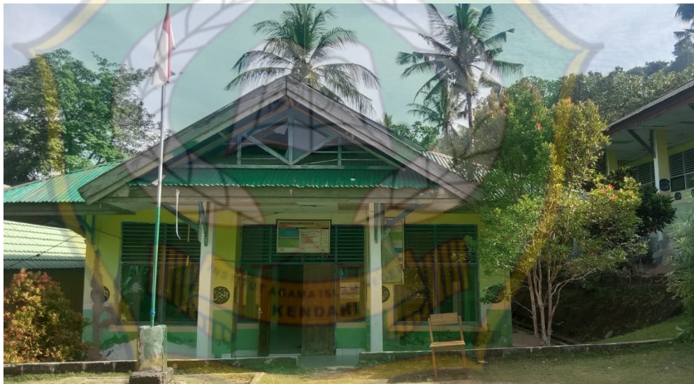
Kantor MIN 1 Konsel