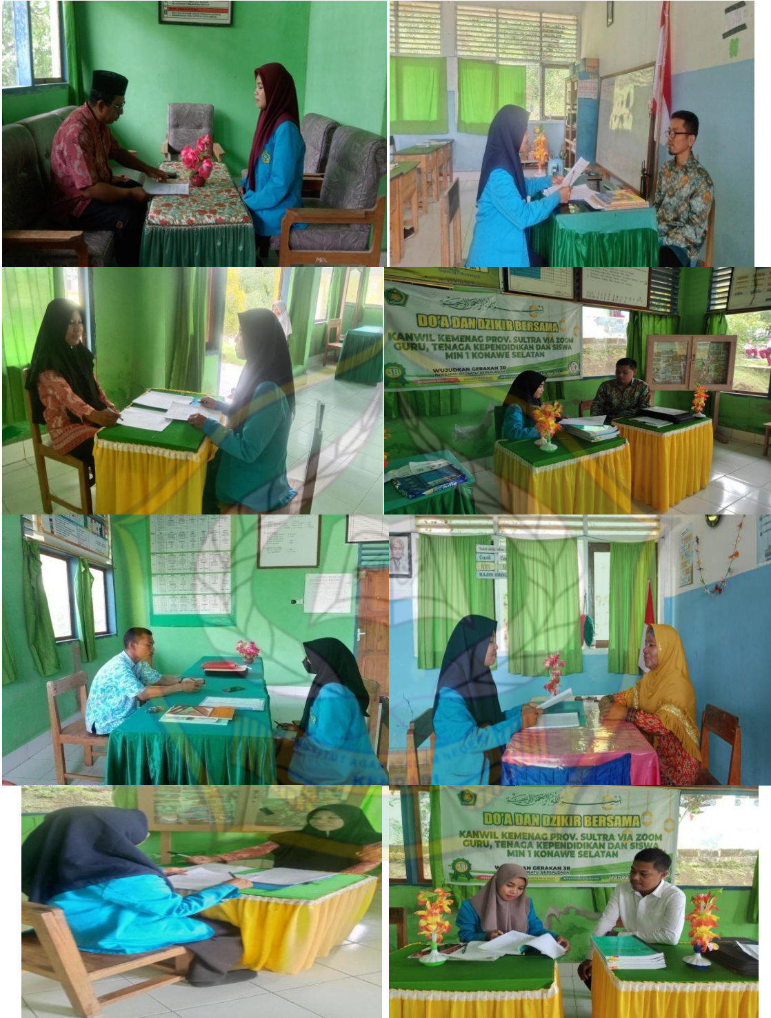
Wawancara Bersama Kepala Madrasah Dan Guru Min 1 Konsel