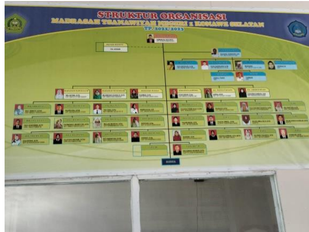
Dokumentasi 5. Gambar Kondisi guru, Siswa Dan Siswi