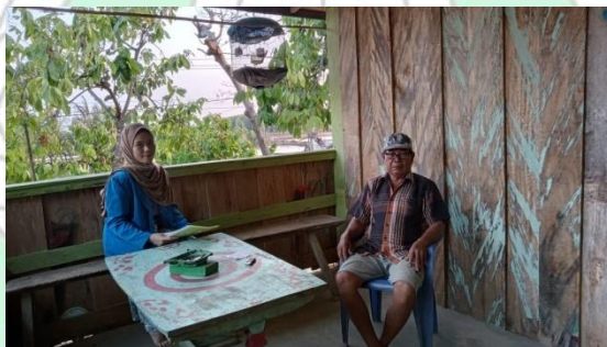
Gambar 2 Proses wawancara pada 28 September 2023 dengan penjual (petani cengkeh)