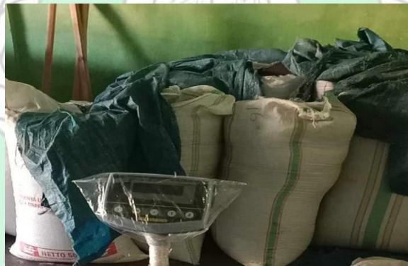
Gambar 12 Hasil cengkeh yang dipaja '