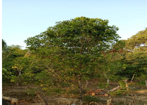
Gambar 11 Kebun cengkeh milik bapak Rustam