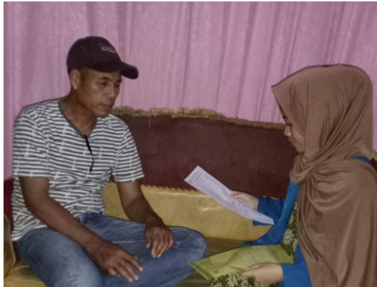
Gambar 8 Proses wawancara pada tanggal 05 Oktober bersama pembeli (pengepul)