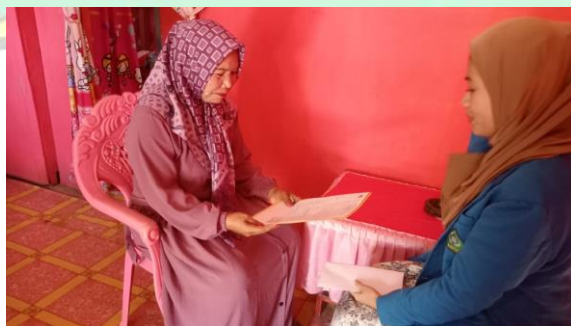
Gambar 3 Proses wawancara pada 28 September 2023 dengan pembeli (pengepul)