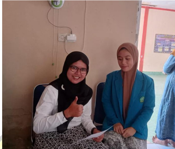
Gambar 1 25 September bersama dengan sekretaris Kelurahan