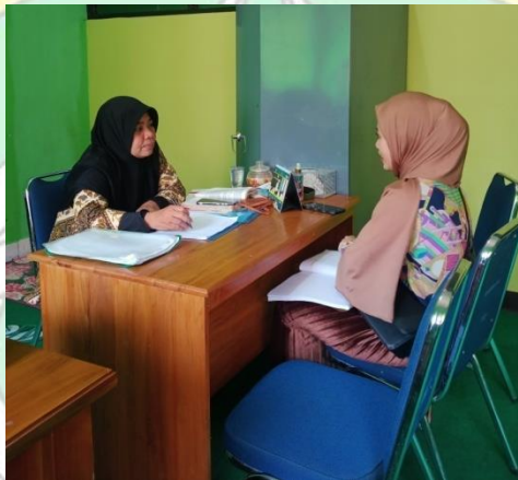
Gambar 9 Proses wawancara pada tanggal 31 Oktober bersama salah satu dosen IAIN Kendari