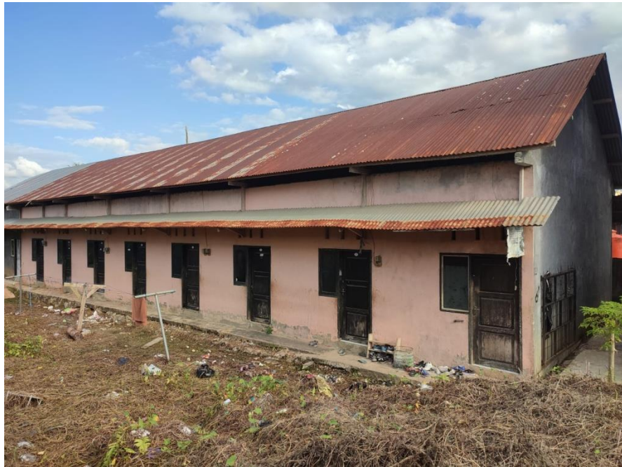
Gambar 7 Kost Shivana