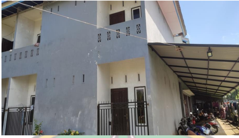
Gambar 3 Kost Shabrina