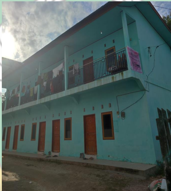
Gambar 4 Kost Riska Aspuri