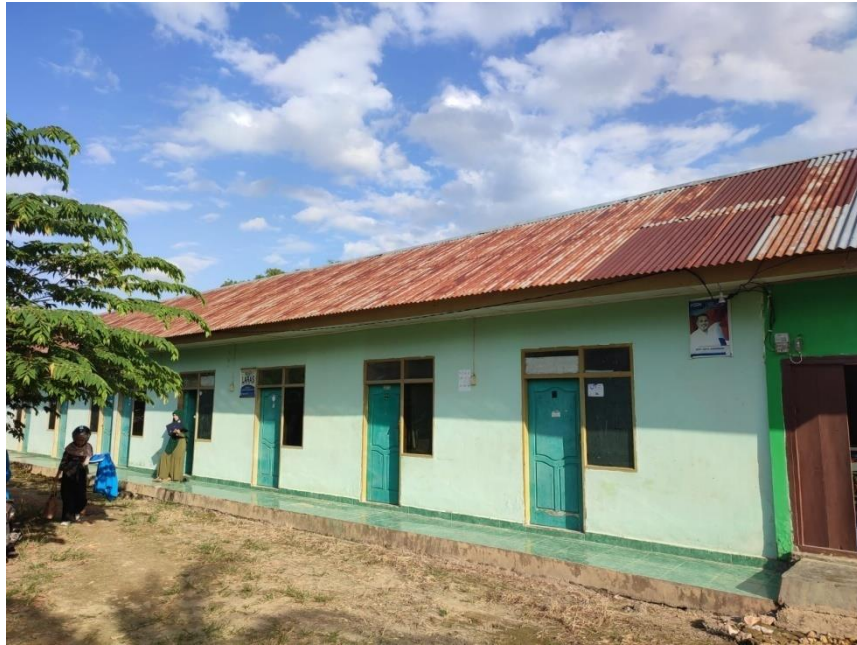
Gambar 5 Kost Laras