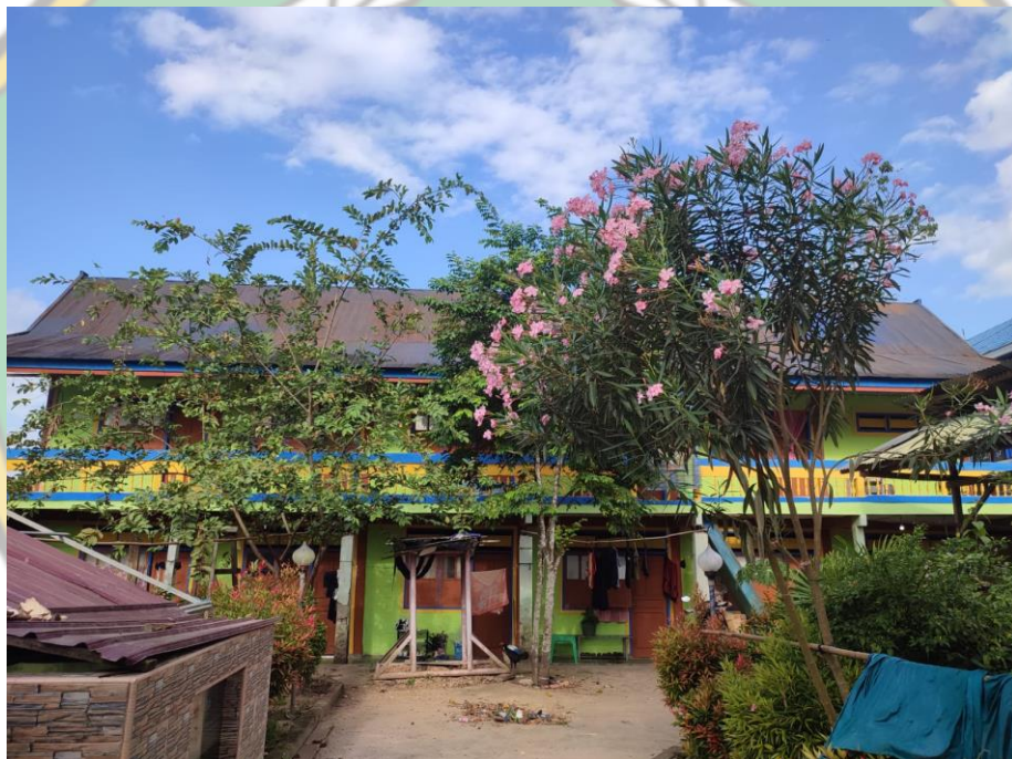
Gambar 6 Kost RW