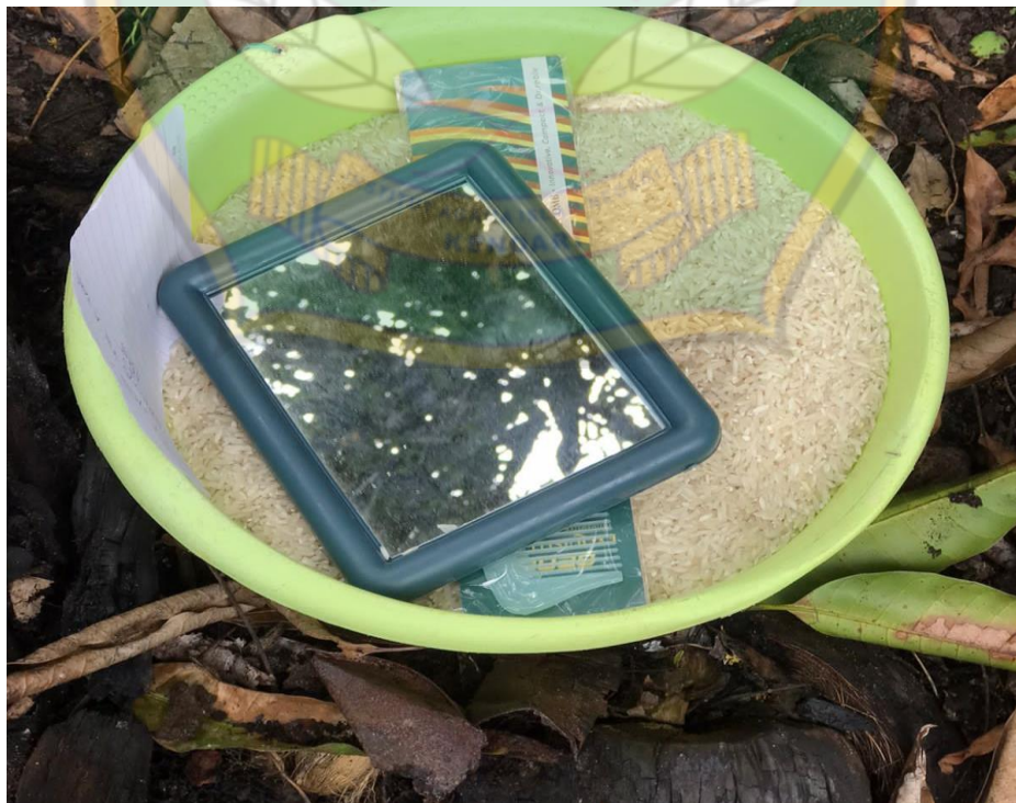
Alat dan Bahan untuk Aqiqah Pemotongan Rambut