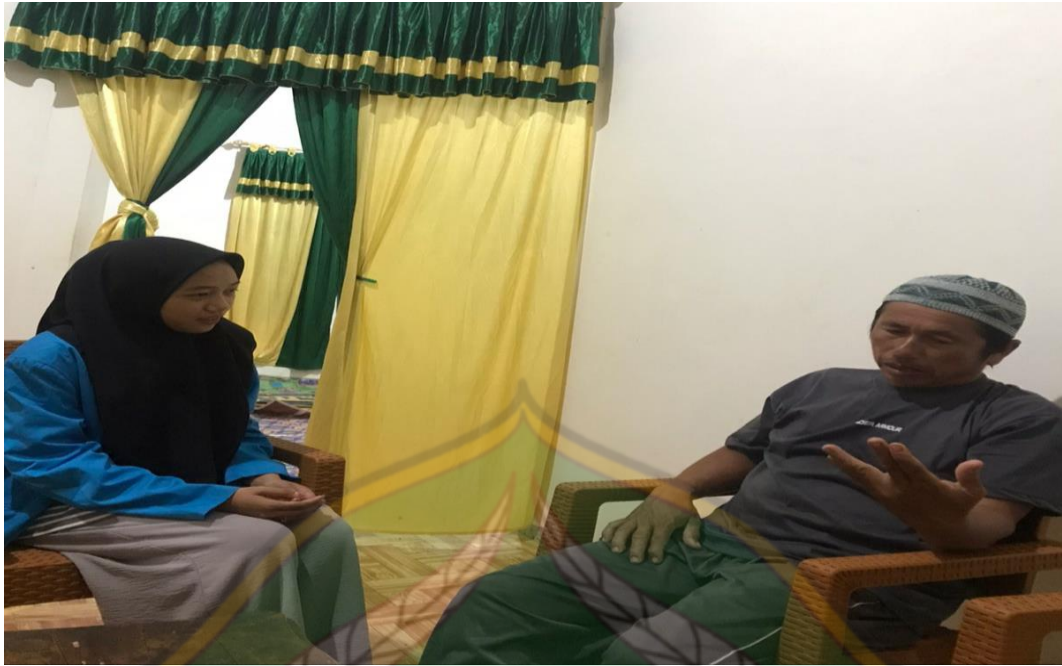
Wawancara Bersama Masyarakat