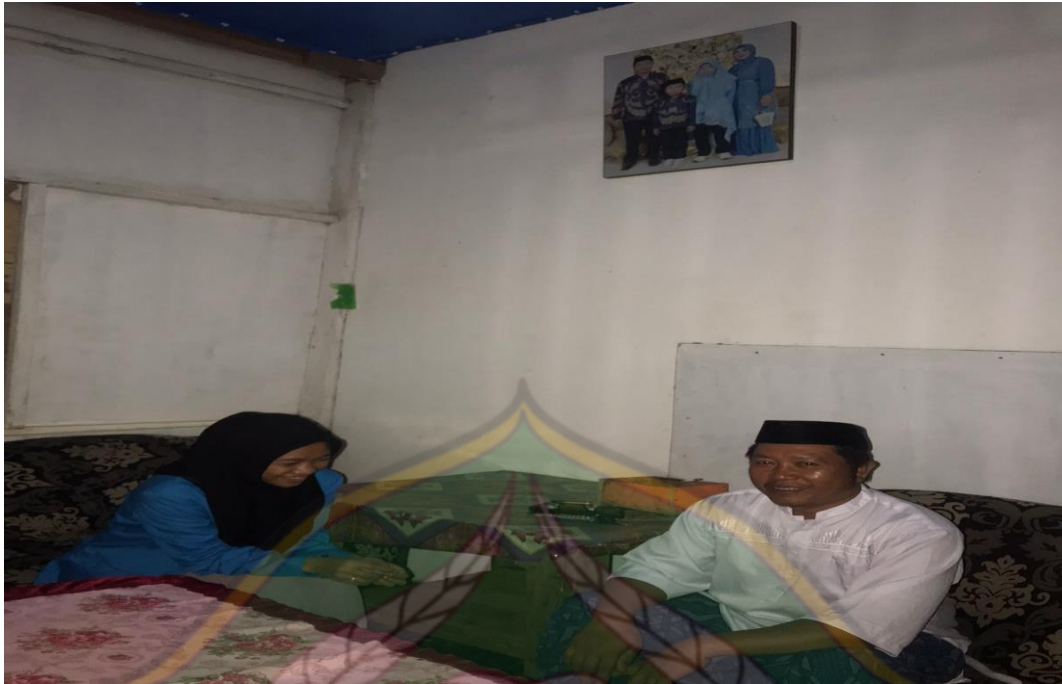
Wawancara Bersama Toko Adat/Agama