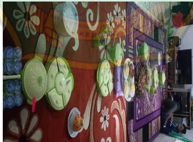
Sajian atau Hidangan Barazanji Aqikah