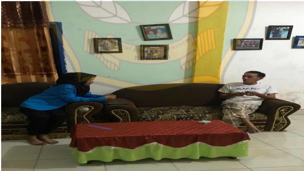
Wawancara Bersama Masyarakat