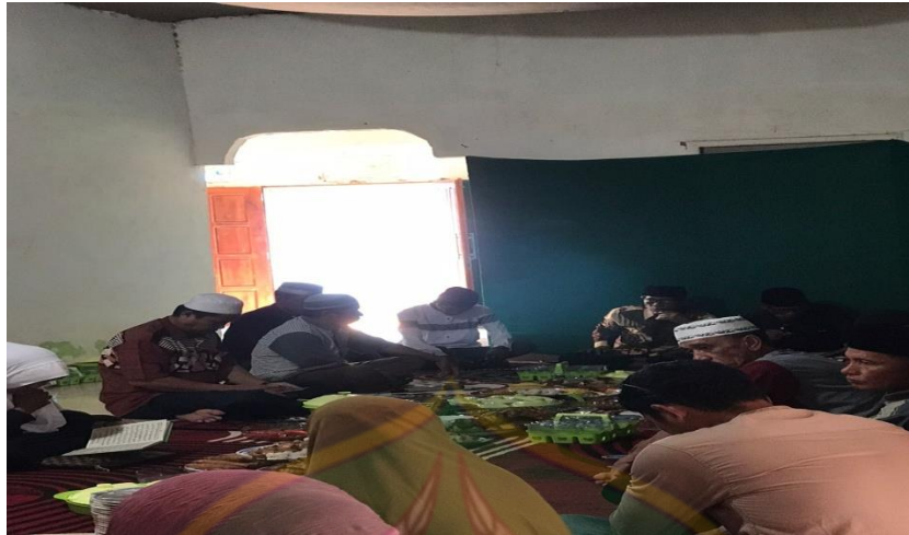
Kegiatan Pembacaan Shalawat Barazanji Aqikah