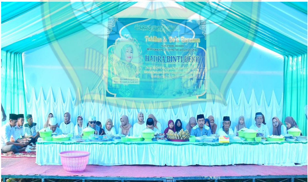
Kegiatan Barazanji Tahlilan