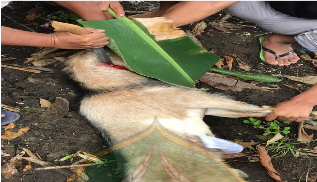
Proses Pemotongan Kambing Untuk Barazanji Aqikah