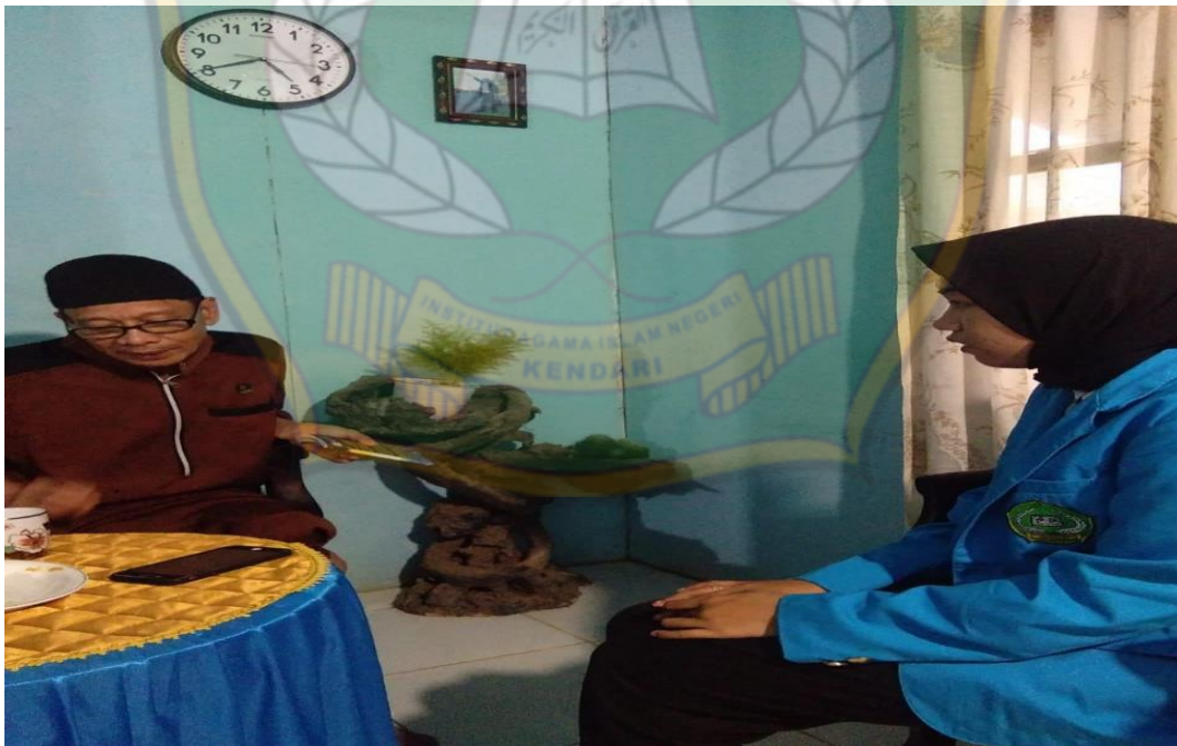
Wawancara Bersama Toko Agama