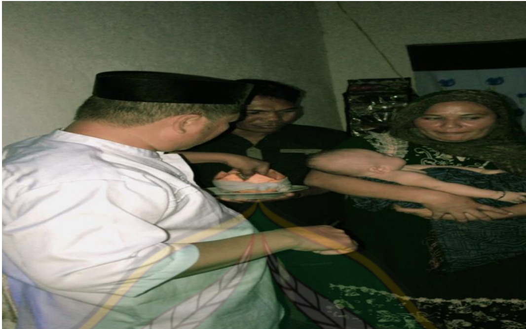
Proses Pemotongan Rambut Anak