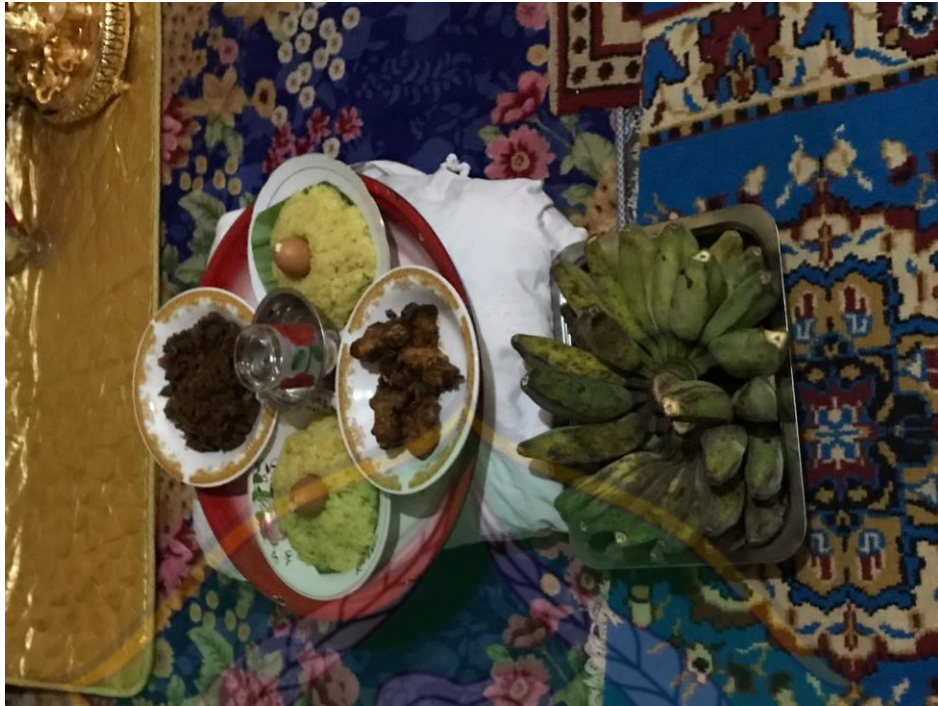
Sajian Barazanji Pernikahan