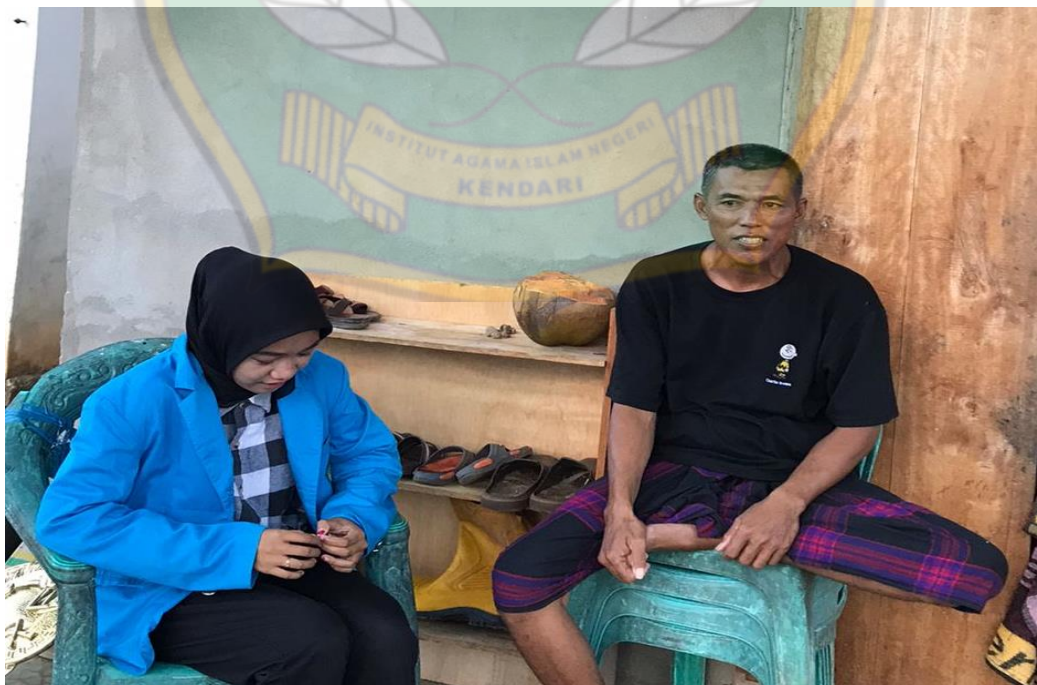
Wawancara Bersama Masyarakat