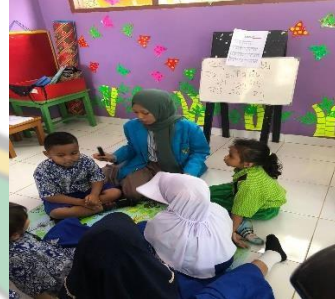
Kegiatan siklus II pertemuan 3