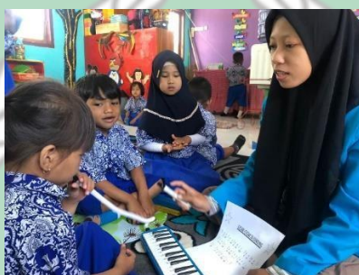
Kegiatan siklus II pertemuan 2