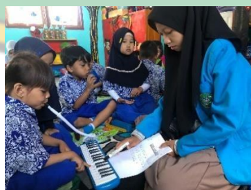
Kegiatan siklus I pertemuan 3