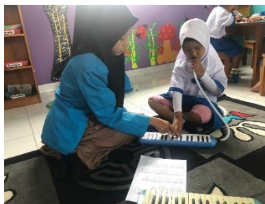
Kegiatan siklus II pertemuan 1