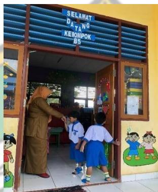
Kegiatan berbaris didepan kelas sebelum masuk ke ruang kelas