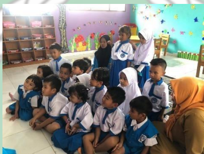
Kegiatan siklus I pertemuan 2