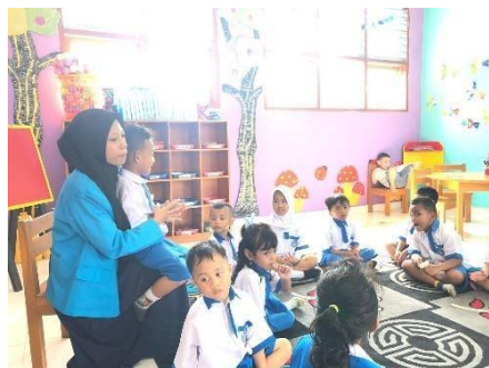
Kegiatan siklus I pertemuan 1