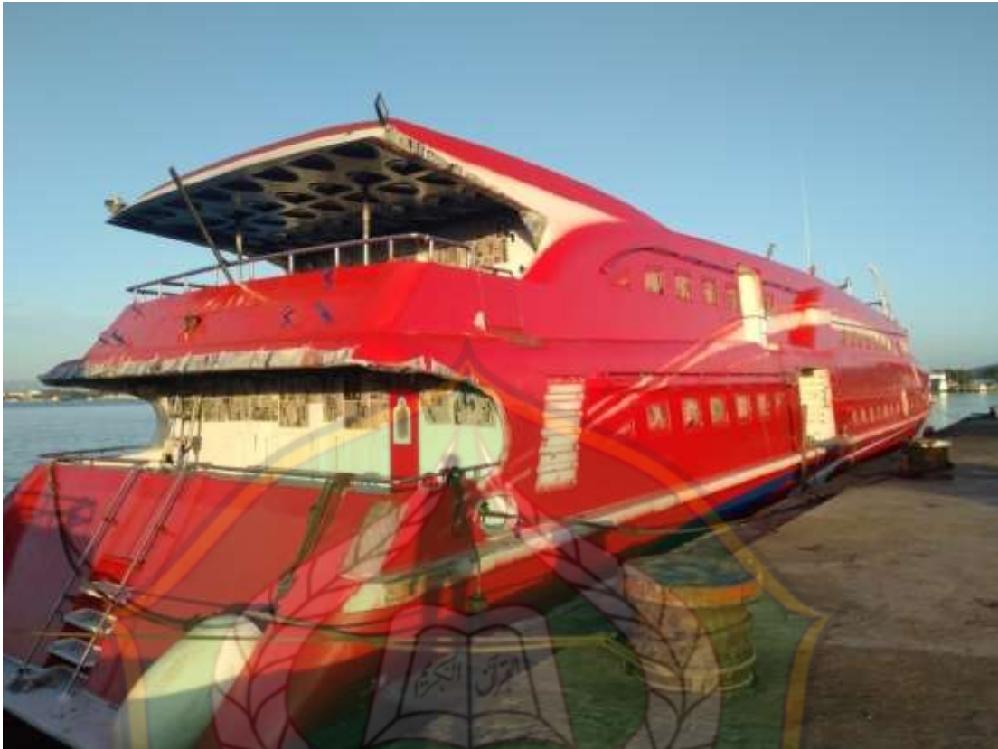
Ruang Eksekutif K.M Express Bahari 6E (7, Juli 2023)