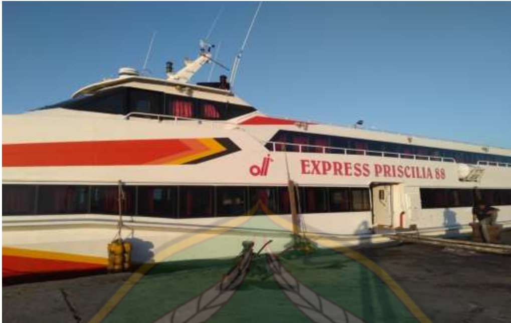
Ruang Eksekutif K.M Express Priscilia 88 (3, Juli 2023)