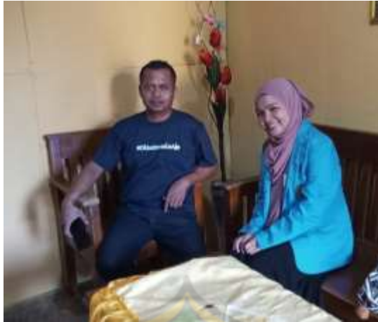
Wawancara bersama Bapak Ketua Pokdarwis