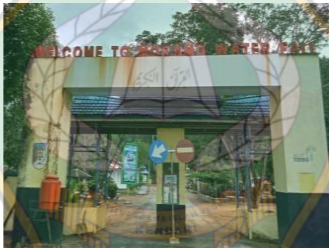
Gerbang Utama air terjun Moramo