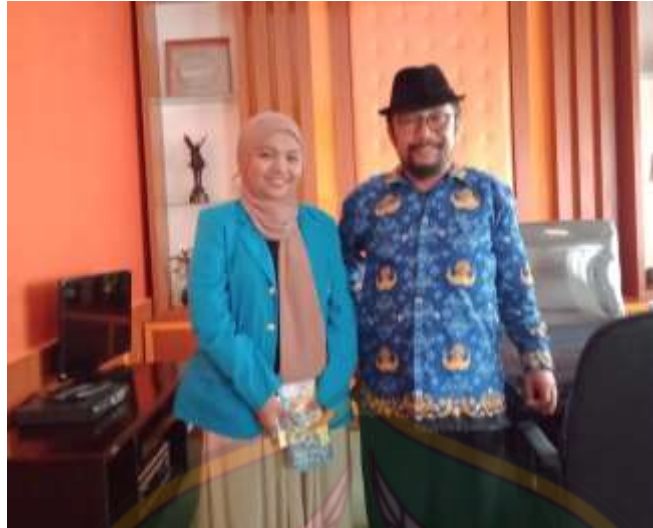
Wawancara bersama Bapak Dinas Pariwisata Konawe Selatan