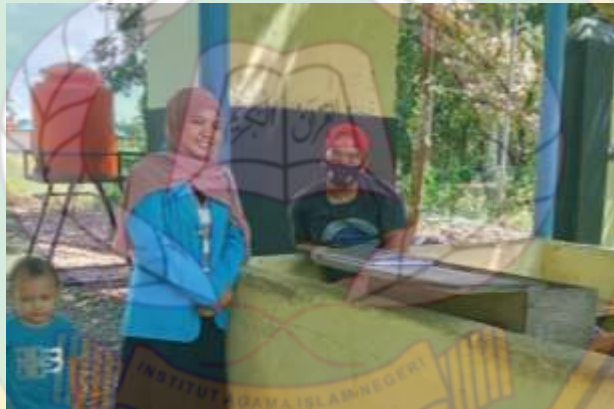
Wawancara bersama penjaga karcis