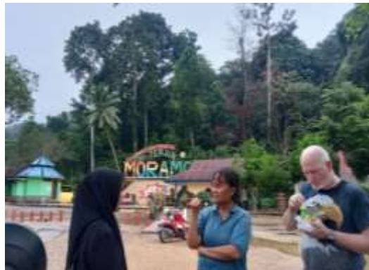
Wawancara pengunjung Rosalina