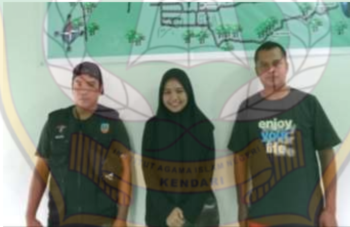
Wawancara bersama Bapak Pokdarwis