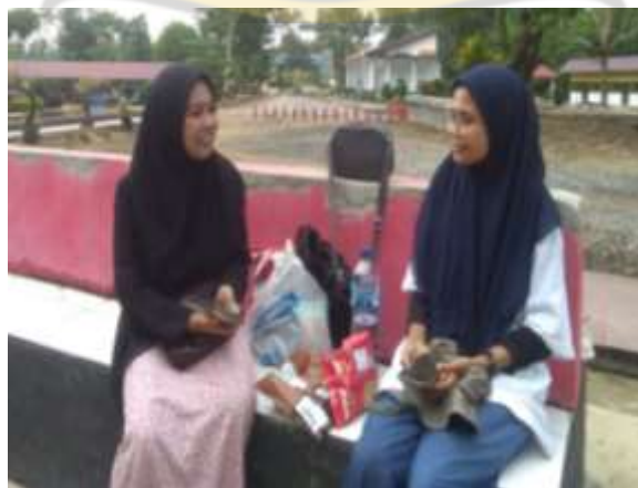
Wawancara pengunjung Ifa