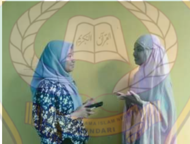
Wawancara pengunjung Chaerani Ummah