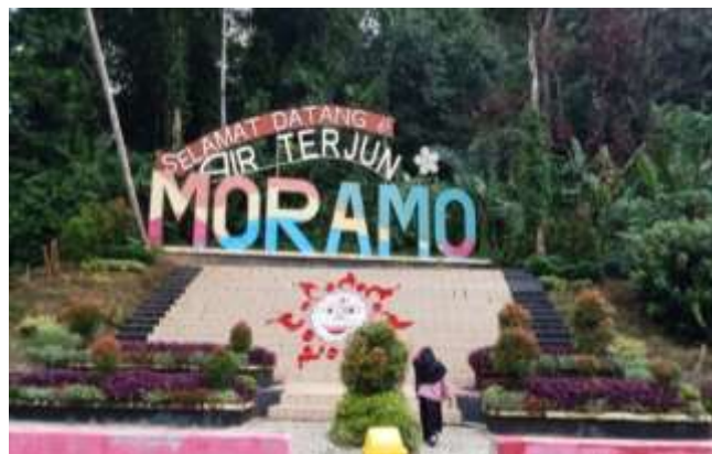
Ikon air terjun Moramo