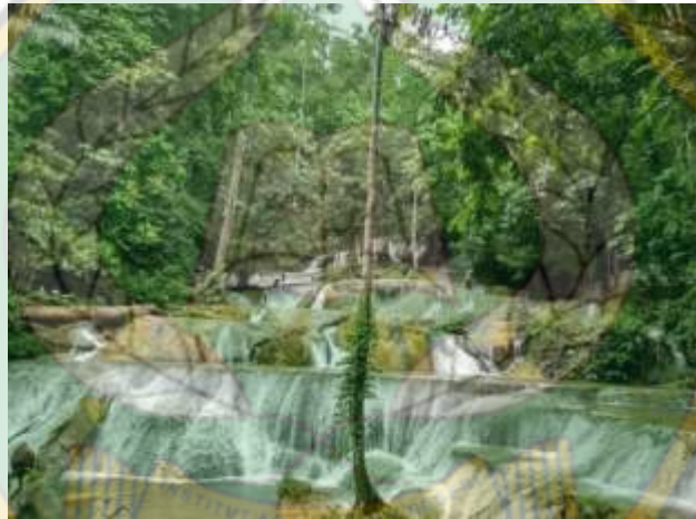
Air Terjun Moramo