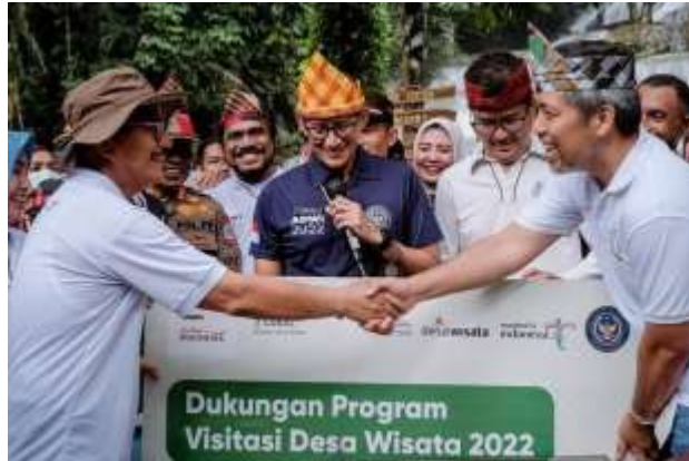
kunjungan bapak menteri pendidikan dan kebudayaan