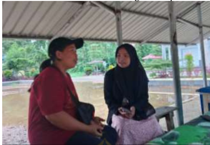
Wawancara bersama pedagang makanan khas