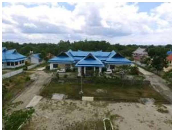
Kantor Dinas Pariwisata Konsel