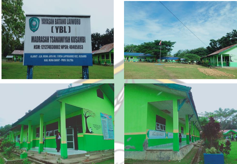
صورة مبنى المدرسة