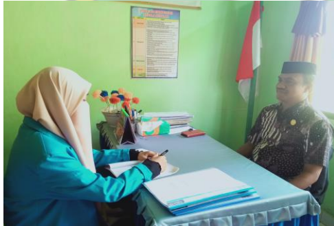
مقابلة مع مدير