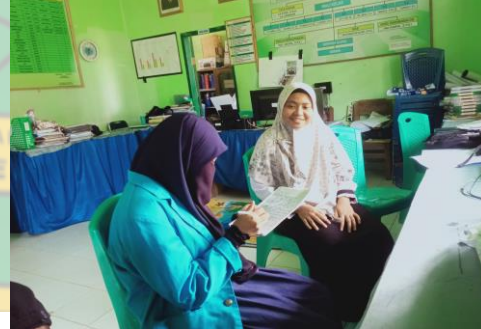
مقابلة مع مدرسة لغة عربية للصف السابع ١