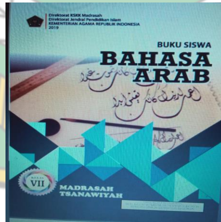
Buku Ajar bahasa Arab kelas VII