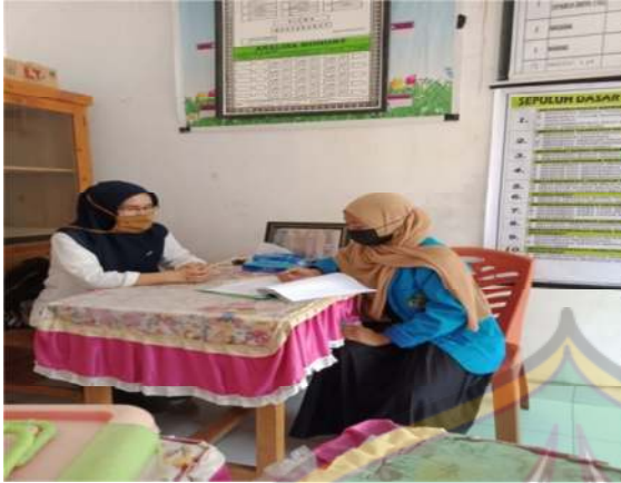
Wawancara Kepala Sekolah