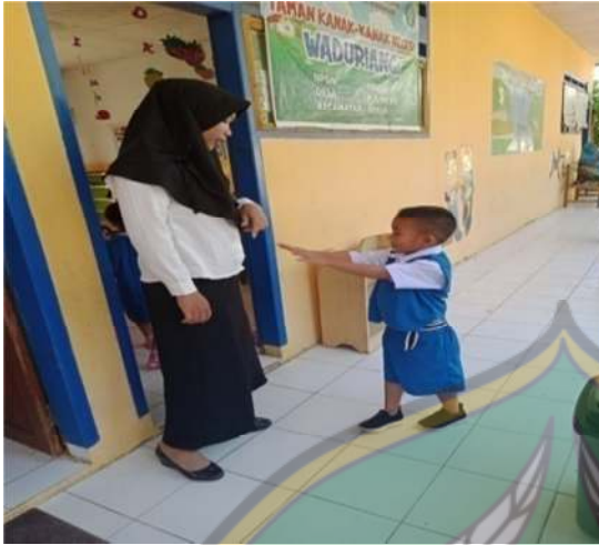
Periksa kuku sebelum masuk kelas