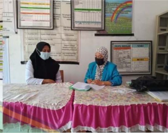
Wawancara Guru Kelas A