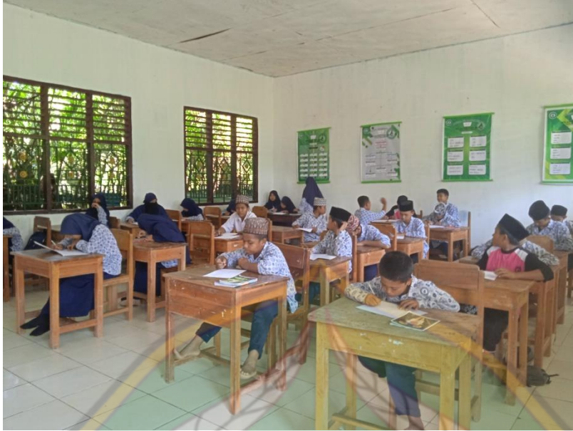
تعلم مهارة الكتابة