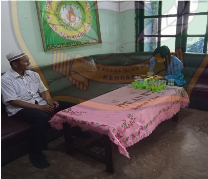
المقابلة مع معلم اللغة العربية