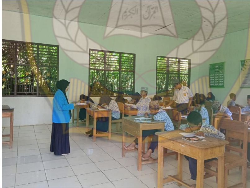
الإختبارات مع طلاب الفصل الثامن