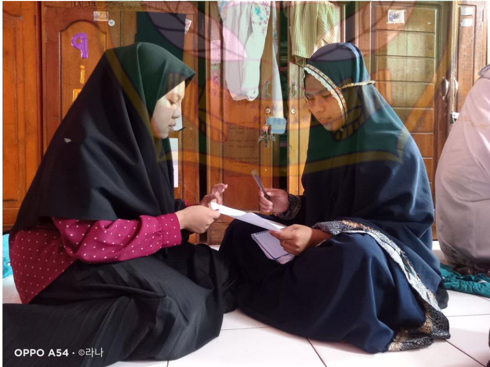
مقابلة مع رحماواتي