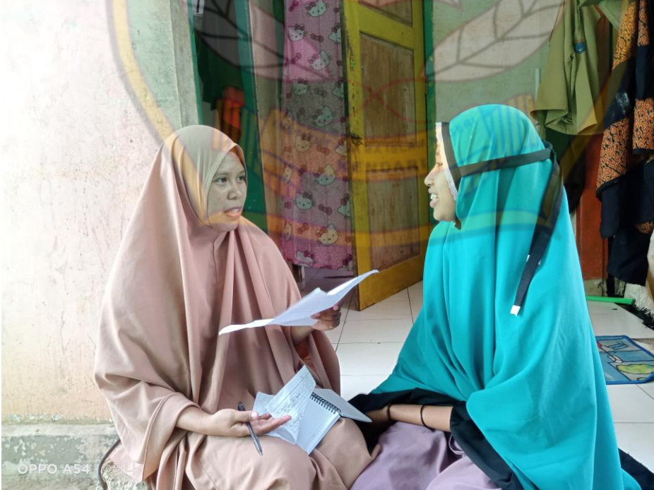
مقابلة مع سريفة الرفيقة