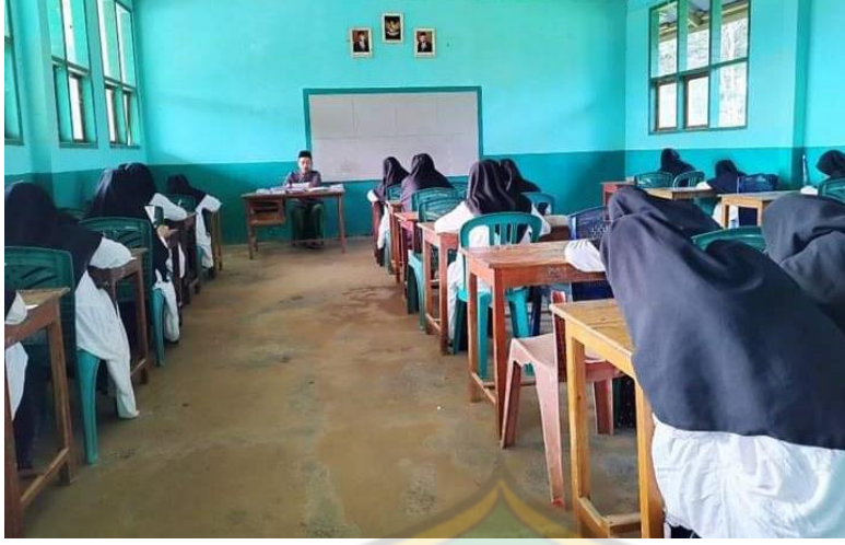
عملية تنفيذ امتحان الكتاب