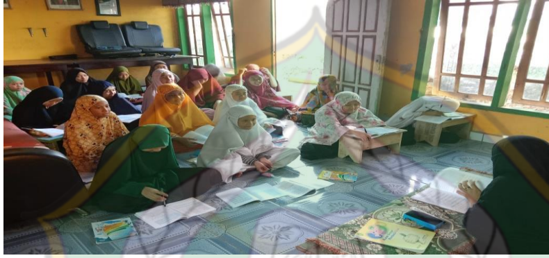
تنفيذ تعلم كتاب المفتاح للعلوم