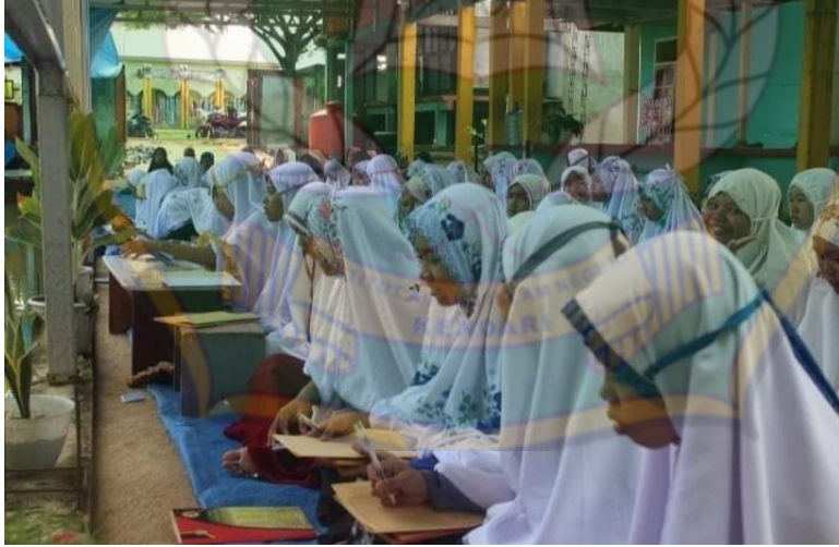
عملية تنفيذ دراسة الكتاب الكثرات