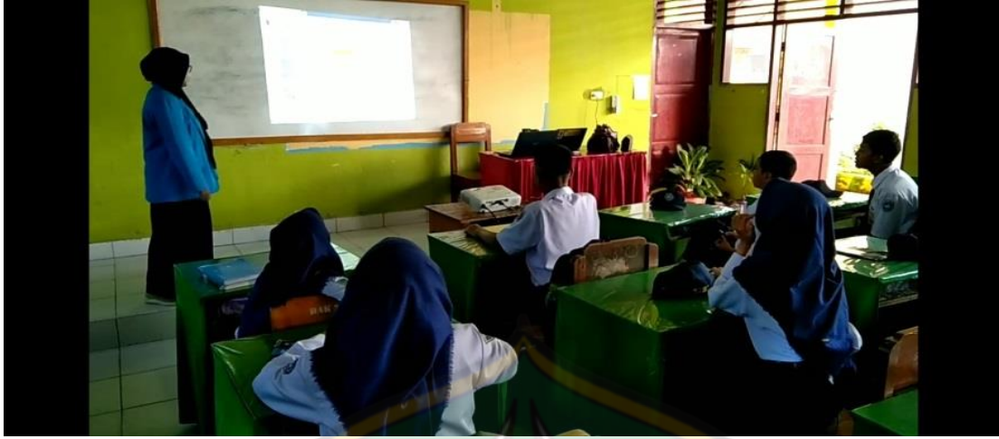
الشكل ٣. يغني الباحثون مع الطلاب باستخدام وسائط الفيديو