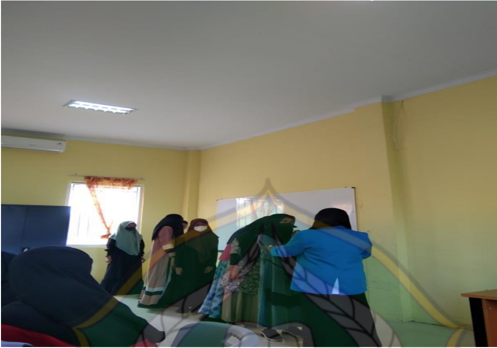
الشكل ٧. يرتب الباحثون الطلاب للقيام بوسائط تخمين مصورة