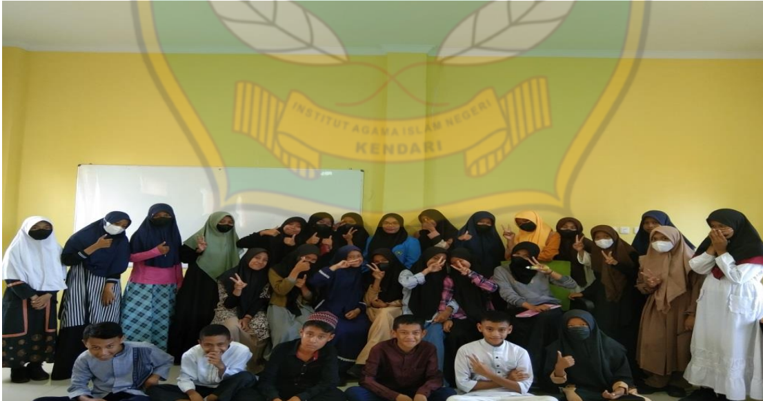
الشكل ٨. يقوم الباحث بالتقاط صورة مع الطلاب