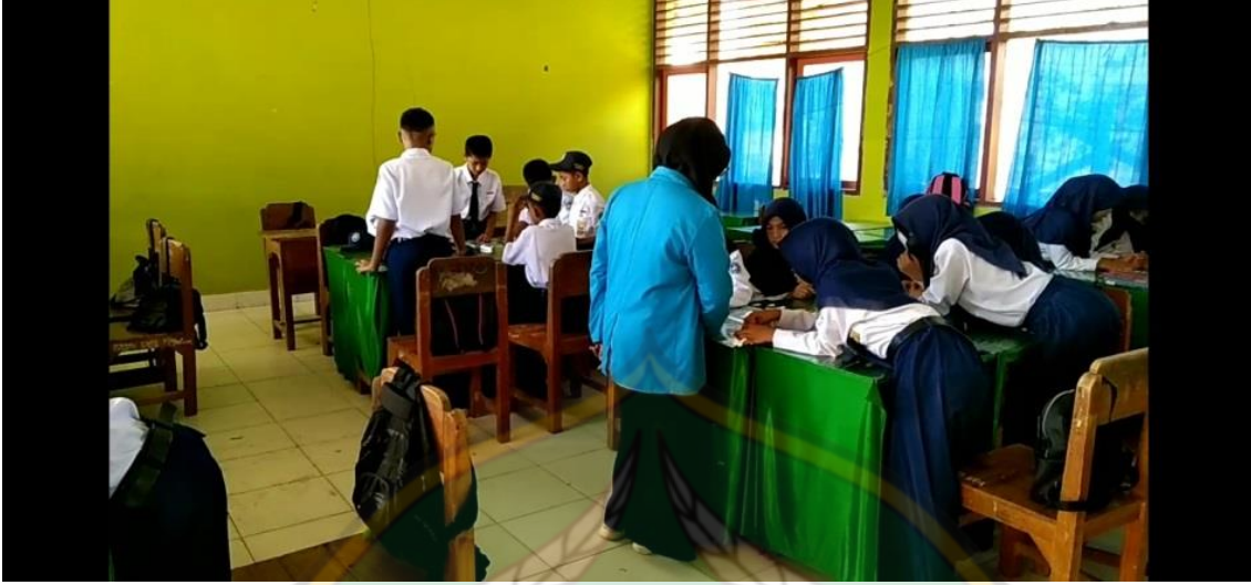
الشكل ٥. يشرح الباحث المادة الإعلامية الكترونية لكل مجموعة