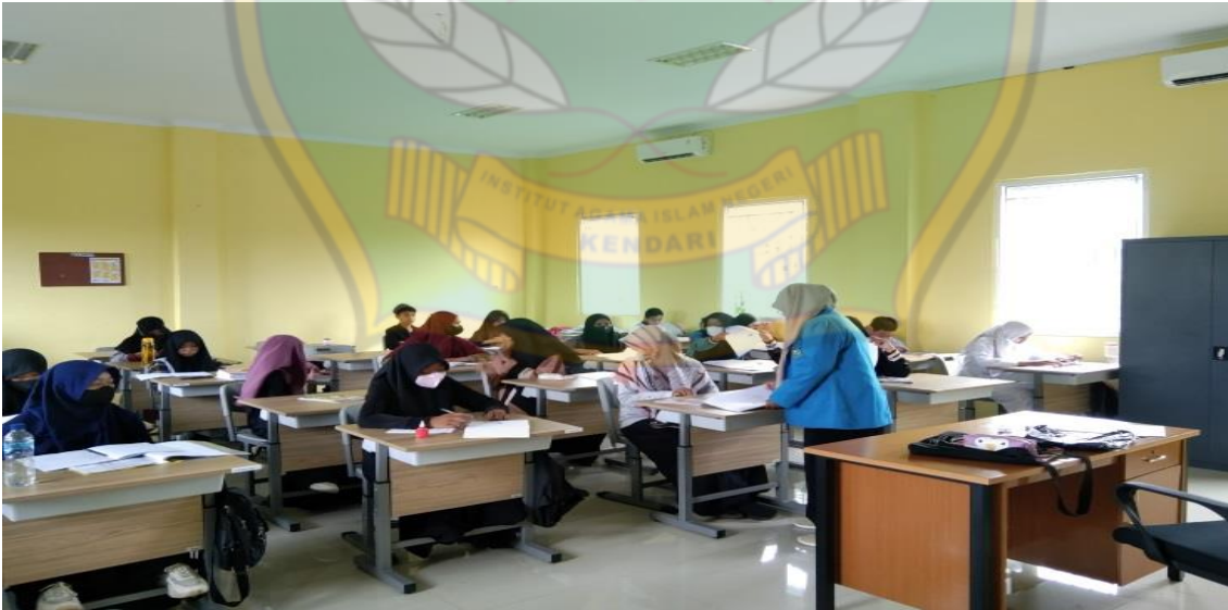
الشكل ٦. يبحث الباحثون في الوسائط التي يلعبها الطلاب