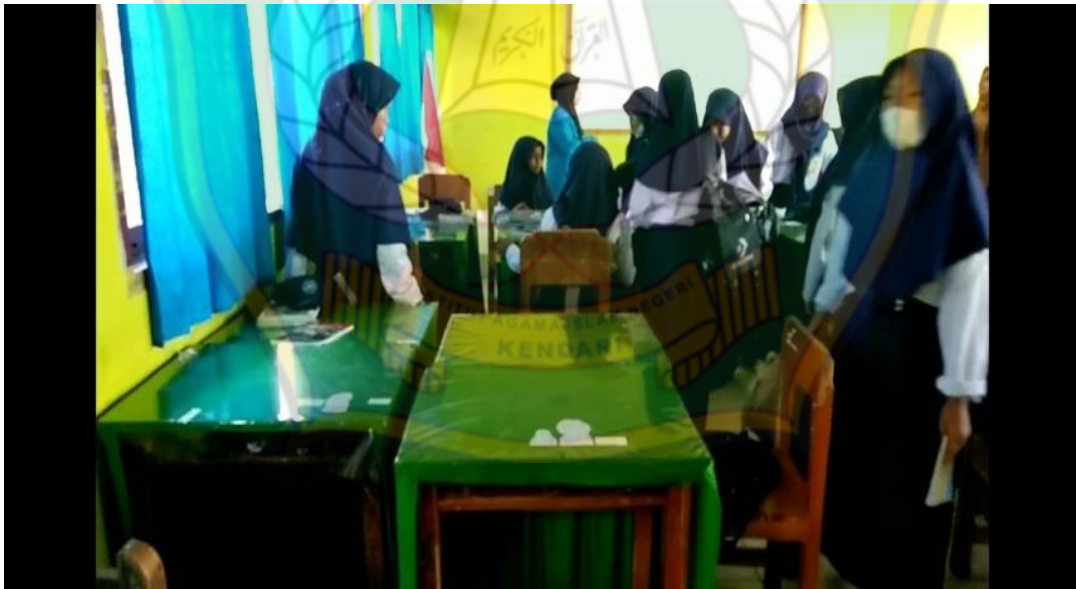
الشكل ٤. يقوم الباحثون بتشكيل مجموعة على الطلاب