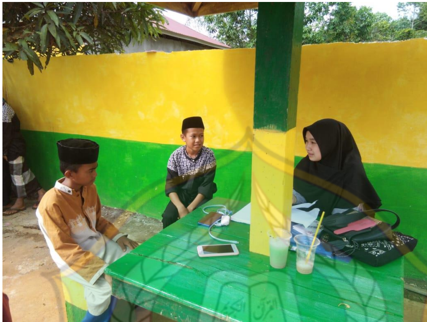
(مع أندي مُجّد ریحان نویر و مُجّد فطیر الکحفي)