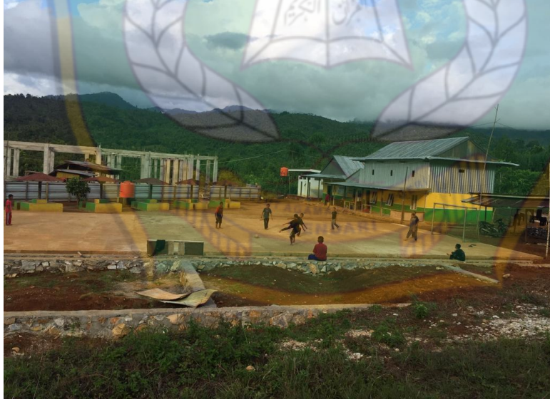
(بيئة سكن الرجال)