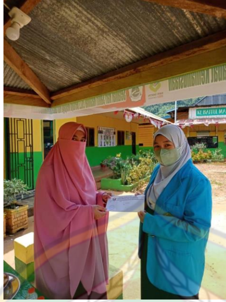
(قبول تصريح البحث)