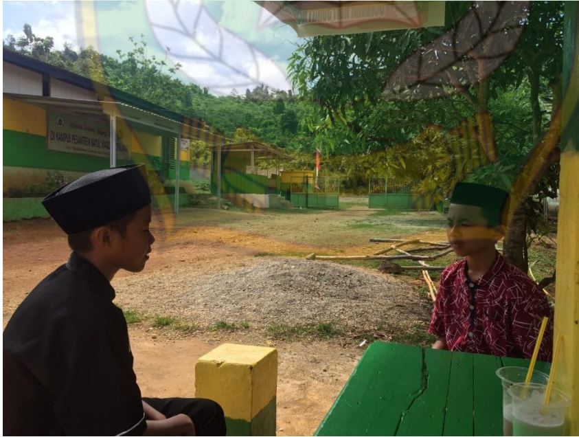
(حوار الطلاب باللغة العربية)