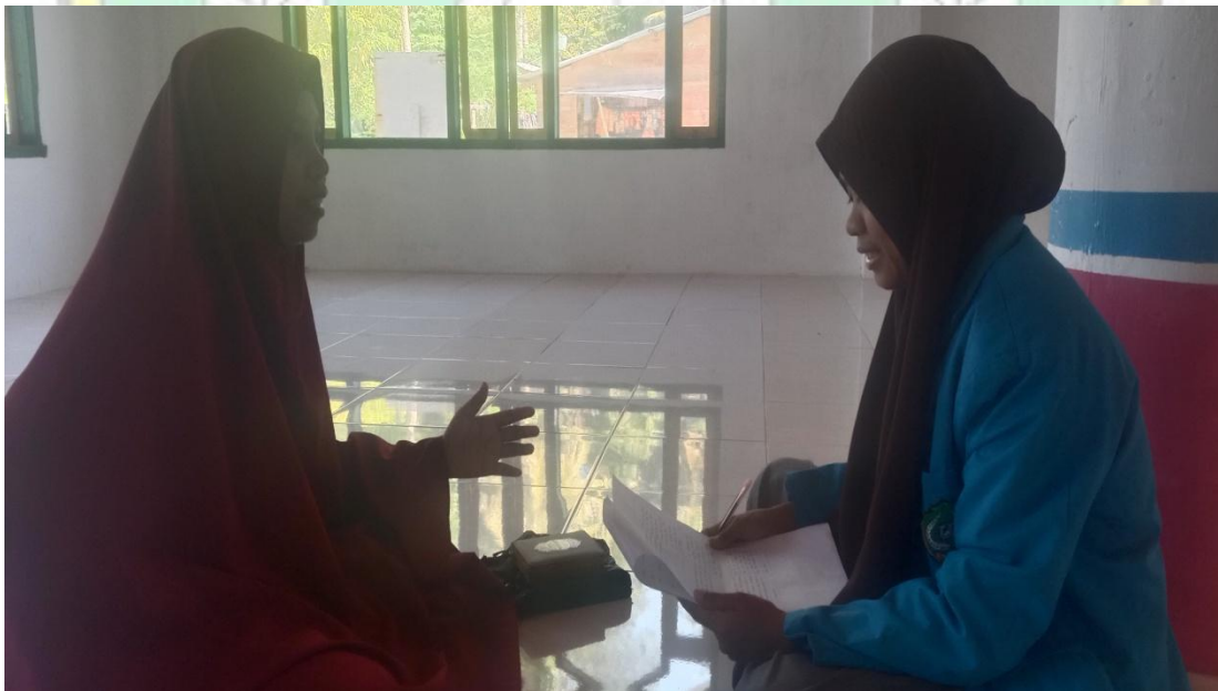
(Wawancara Bersama Guru Bahasa Arab Madrasah Tsanawiyah Karae)