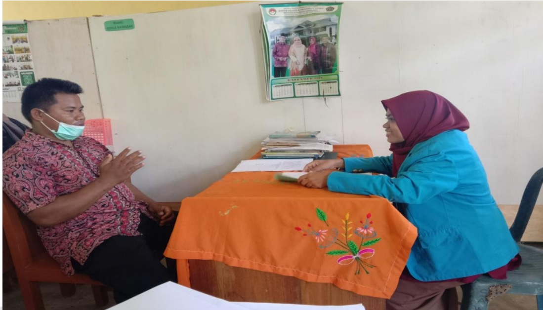
(Wawancara Bersama Kepala Sekolah Madrasah Tsanawiyah Karae)